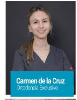
Carmen de la Cruz Ortodancia Exclusivo