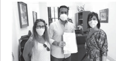
Visita de la parlamentaria andaluza a la sede del PSOE.