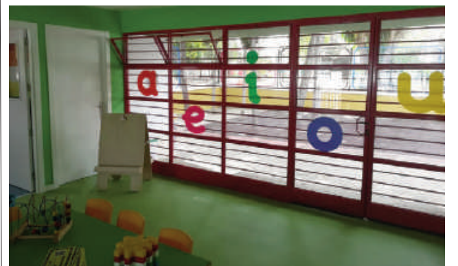
Foto aula reformada guardería municipal Fuente de Piedra.

Desde el Ayuntamiento de Fuente de Piedra han indicado en un comunicado que "invertir en la educación y seguridad ha sido y seguirá siendo una prioridad para este Equipo de Gobierno, que ha volcado todos sus recursos económicos y materiales desde el inicio de esta crisis sanitaria que se está viviendo actualmente".