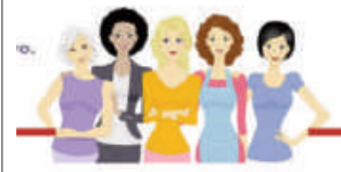
AYUNTAMIENTO DE VILLANUEVA DEL TRABUCO

Para más información se puede pedir cita en el Ayuntamiento de la localidad o llamando al teléfono 952751021.