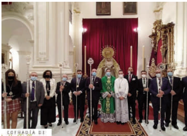
Fotografía de la Festividad. COFRADIA DE LA POLLINICA DE ARCHIDONA

Al finalizar la celebración religiosa, una representación de la Archicofradía del Carmen del Perchel de Málaga hizo entrega de un regalo para la Sagrada Imagen, el