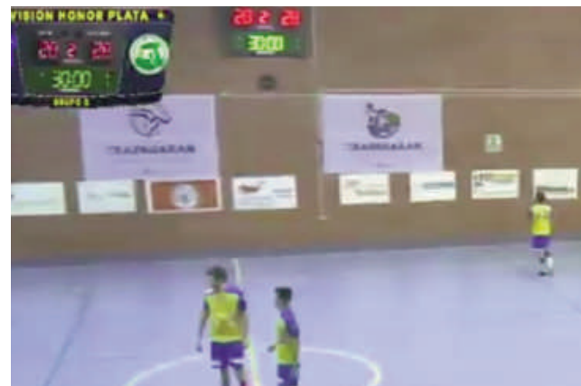
Imagen del final del encuentro deportivo

De hecho, fue en el último segundo cuando el equipo antequerano consiguió marcar un nuevo gol que llevó al encuentro al empate antes de que el árbitro pitara el fin del partido