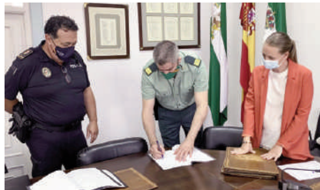
Momento de la firma.

El hecho de formar parte de este sistema permitirá además, el acceso a información y se podrán conocer las medidas judiciales existentes, órdenes de alejamiento impuestas a los agresores y otras medidas de protección.