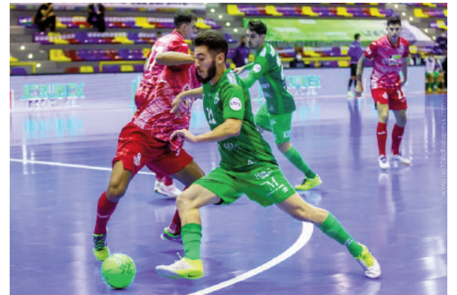
Momento del partido de fútbol sala.