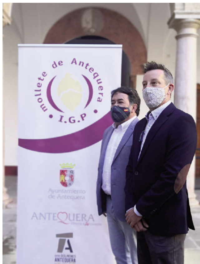
Imágenes de la presentación VIVA

denominaciones de calidad de Andalucía que, no solo otorgan prestigio a los territorios, sino que suman un valor económico de 500 millones de euros” y apuntó que el mollete ya se podrá acoger.