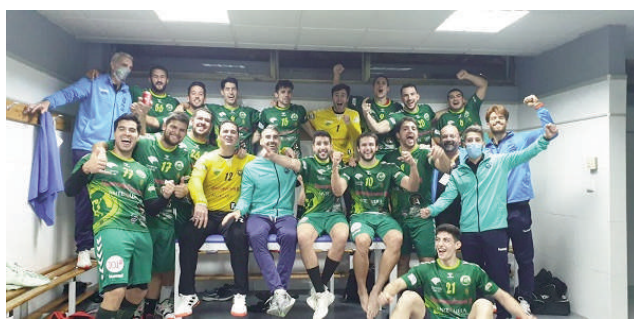
Equipo tras coseguir la victoria en el vestuario.

DEPORTES | El encuentro prometía ser uno de los más duros a los que el equipo local podría enfrentarse en esta primera fase pero ha resultado ser un partido muy bien orquestado y casi perfectamente ejecutado por el conjunto de Antequera. Los de Lorenzo Ruíz empezaron fuerte y en los primeros tres minutos de partido ya aventajaban al rival en tres goles. Durante esta primera mitad se marcaron en total 13 goles frente a 10 del rival; los antequeranos, de esta forma, supieron aprovechar muy bien todas las oportunidades y los errores del conjunto de Ciudad Real. En la segunda parte los visitantes al Fernando Argüelles endurecieron la defensa y subieron un poco el