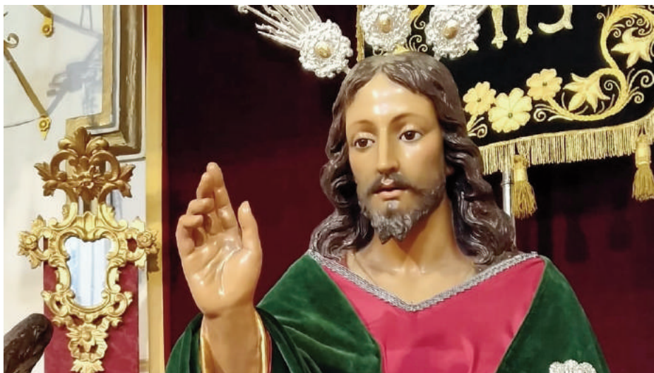
Imagen de la veneración al Señor de la Pollinica en el interior de San Agustín. ANTONIO JESÚS PALOMO