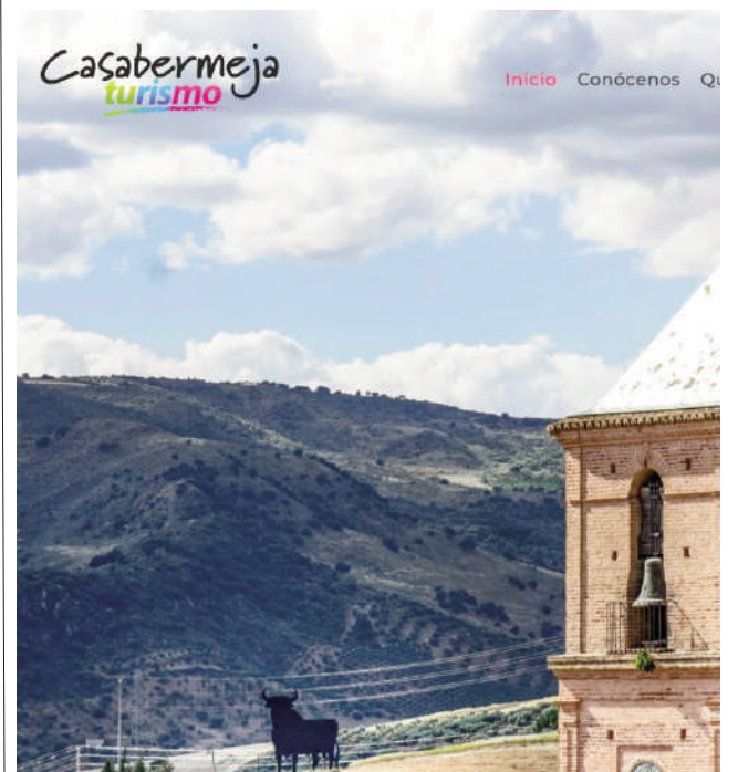
Fotografía de la home de la nueva web.