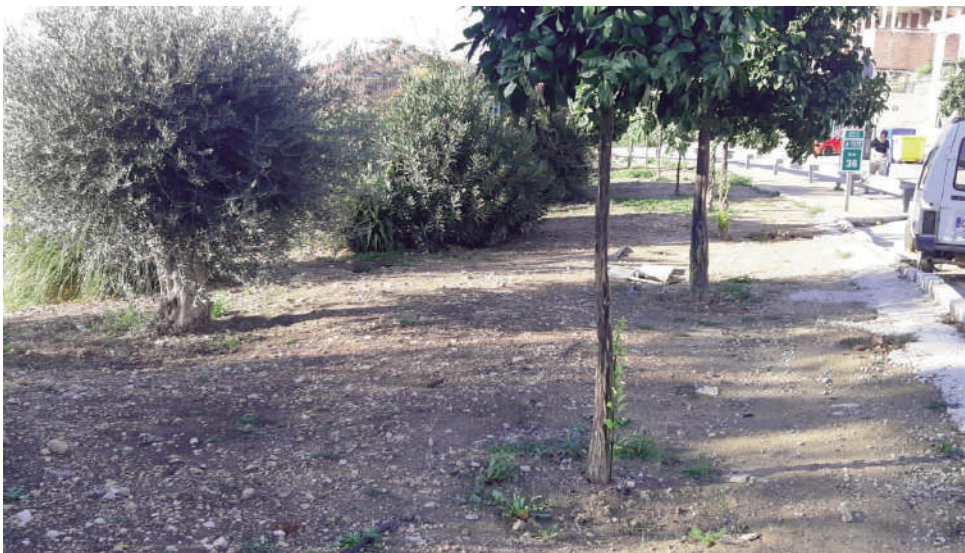
Imágenes de los emplazamientos que han iniciado las obras. VIVA