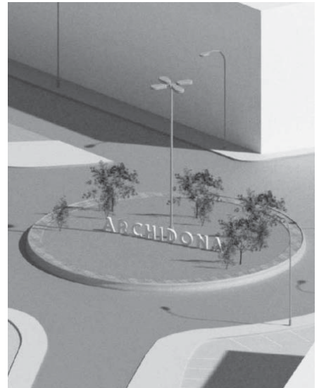
Reproducción virtual de cómo quedará la rotonda