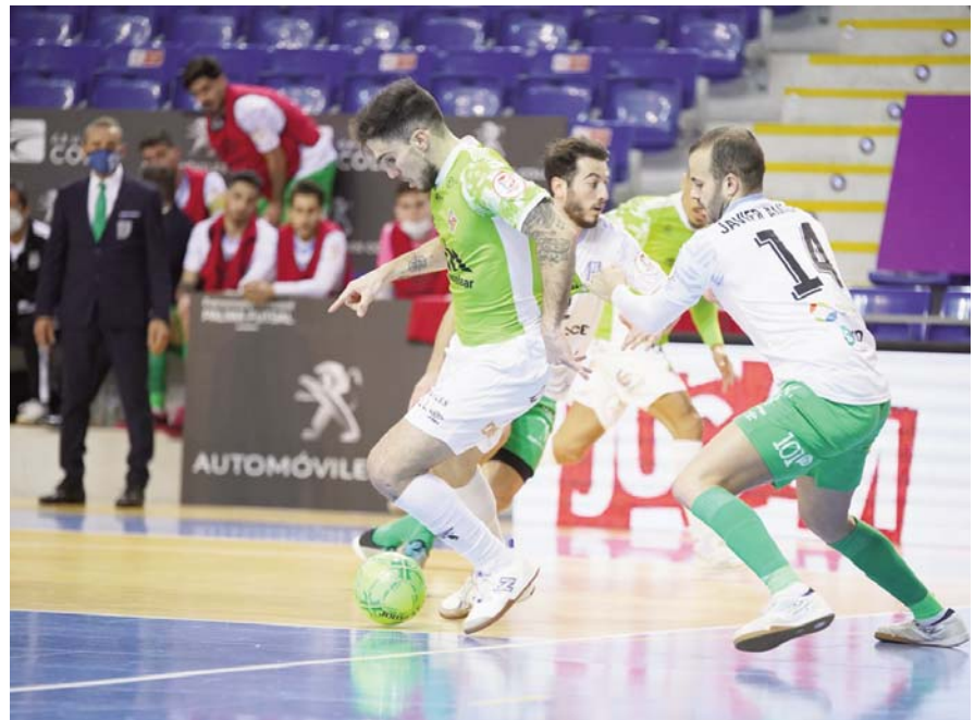
FOTOGRAFÍA UMA ANTEQUERA

DEPORTES El Cartagena visitará el Pabellón Fernando Argüelles el sábado 6 de febrero