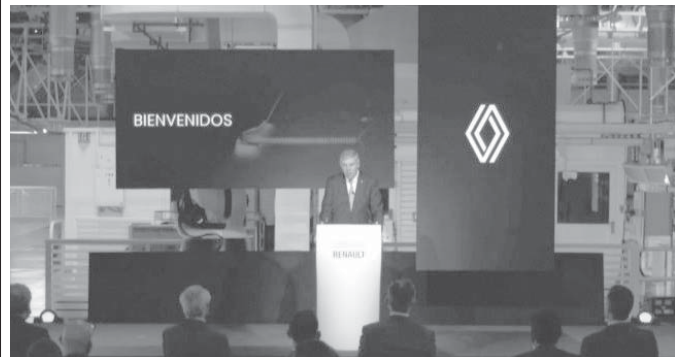
Acto de presentación del nuevo Plan de Renault a nivel nacional celebrado en los últimos días.

EMPRESAS | Buenas noticias para la economía de la región en medio de la incertidumbre de la pandemia de la mano de Renault, que cuenta con un concesionario en el polígono industrial de Antequera, Grupo Antequera Motor. La empresa destinará mil millones de euros a su último plan industrial que supondrá el impulso de un proyecto para reciclar vehículos, además de dos cajas de cambio en la planta de Sevilla. Además, en Palencia está prevista la fabricación de tres coches eléctricos y dos en Valladolid.