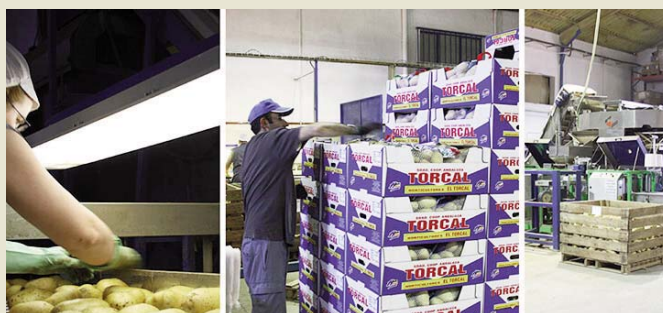
Imágenes de archivo de las campañas de espárrago, cebolla (superior) y patata (inferior).