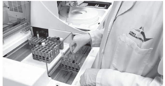
El centro sanitario se encuentra en calle Cuesta del Molino de Puente Genil. VIVA

Cabe señalar también, el Centro de Radiodiagnóstico del Hospital de día, gracias al cual, el Hospital, pudo ser uno de los pocos centros pioneros al inicio de pandemia, que ofrecían el diagnóstico Covid19.