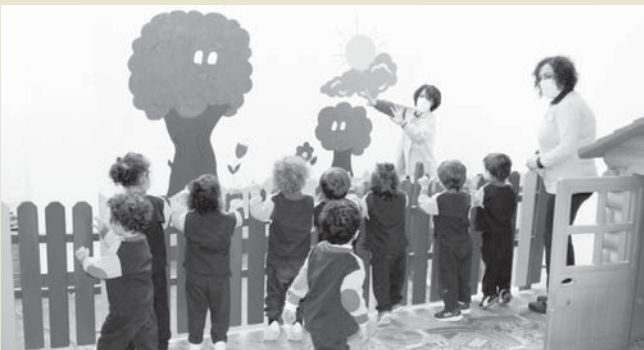
Guarderías El Bosque se encuentra en Plaza Descalzas y Calle Lucena de Antequera. VIVA

Aquellas familias que estén interesadas pueden solicitar información llamando a los teléfonos 952706013 / 609915465 ó personándose en cualquiera de los dos Centros Infantiles.