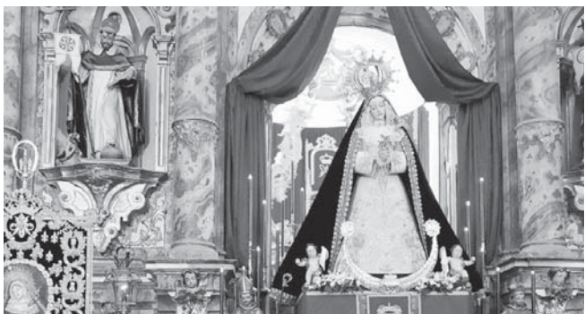
Imágenes de Ntra Sra de la Veracruz y cultos celebrados. ANTONIO JESÚS PALOMO

ANTEQUERA | La Archicofradía de los Estudiantes ha celebrado durante este fin de semana diferentes cultos en torno a Nuestra Señora de la Vera Cruz con motivo de su festividad que tiene lugar este lunes 3 de mayo. De esta forma, el templo de San Francisco permaneció abierto durante la jornada del pasado sábado de forma ininterrumpida desde las once de la mañana hasta la llegada de la noche, permaneciendo durante casi todo el día la Sagrada Imagen expuesta a veneración con posibilidad para que devotos y cofrades se acercaran para llevar a cabo ofrenda floral.