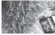
Archidoneses diseñan un abono elaborado con algas y bacterias en cultivos agrícolas - Las 4 Esquinas

La noticia sobre que emprendedores archidoneses han diseñado un abono elaborado con algas y bacterias que evita usar químicos en cultivos agrícolas ha sido la publicación más leída de nuestra web: www.las4esquinas.com