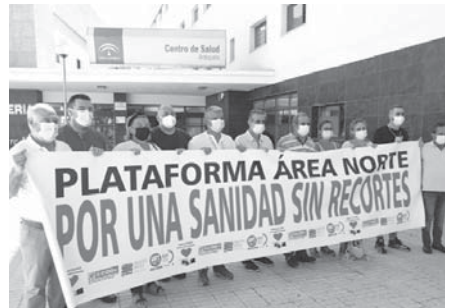
Concentración en el centro de salud.

años" han puesto de manifiesto "la debilidad" del sistema público andaluz de salud. Por último, celebró el inicio de obras del punto de urgencias en Campillos Bajo, "un pulso que la sociedad ha ganado a las administraciones".