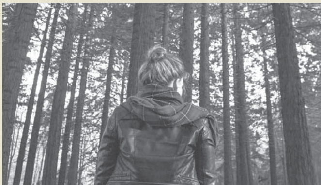
Prendas de otoño. VIVA

Si buscamos algo cómodo, práctico y cool son perfectas las chaquetas de cuero o efecto piel. Son muy fáciles de combinar y, además, su material te protegerá del frío de las épocas otoñales. Éste es un básico que no puede faltar en tu armario esta temporada ya que su tejido es capaz de elevar cualquier look. El chándal, aunque no lo creas,