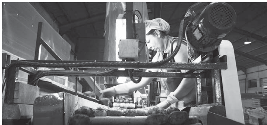
Patatas de cultivo VIVA