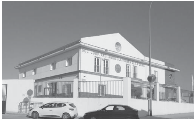
Cooperativa Virgen de la Oliva en Molina. VIVA

MOLINA | La última ola de calor sufrida en la comarca ha provocado que la uva se seque, por lo que la viña no ha conseguido coger la graduación correspondiente. Por ello, se ha tenido que adelantar la recolección de uva en Molina, iniciada el pasado 27 de julio.