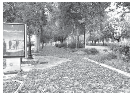
Aspecto del Paseo Real tras la granizada. VIVA

■ ■ El Ayuntamiento ha activado un plan especial de limpieza con el fin de dejar la ciudad en perfectas condiciones en un intervalo de tiempo de entre 15 días y un mes. Para ello ha abierto la bolsa de trabajo en la empresa municipal Aguas del Torcal. Durante la granizada, también se activo en Plan de Emergencias Municipal y se puso operativo el servicio de Protección Civil.