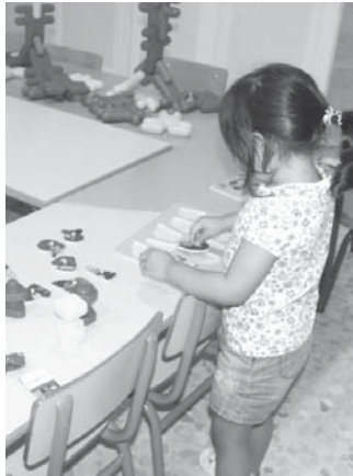
Primer día de cole en Guardería El Bosque. VIVA

Aunque todavía con pena de tener que dar la bienvenida a los pequeños tras una mascarilla, afirman volver a la rutina con muchas ganas y energías. Un entusiasmo que rebosó entre los bebés y niños de 0 y 2 años, pues eran tantas las ganas de volver al cole para jugar con