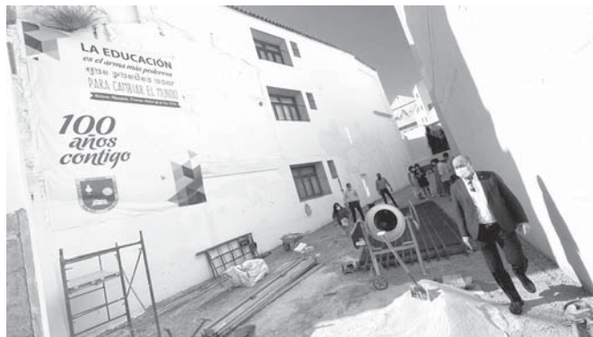
Vista de las obras de ampliación. VIVA

ANTEQUERA | El Colegio de Educación Infantil y Primaria Romero Robledo ubicado en la céntrica calle Calzada de Antequera cuenta ya con el segundo acceso tan demandado por la comunidad educativa del centro. Y es que el Ayuntamiento de Antequera ha acondicionado el solar anexo al edificio principal que estaba en desuso.