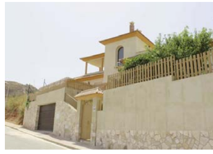
Un ejemplo de casa ya construida en la zona VIVA

cios al aire libre, en plena naturaleza y con todos los servicios de Antequera a escasos minutos de su hogar, además destinado a la alta demanda de inversores de segunda vivienda que invertirán en la urbanización con el fin de vivir en uno de los lugares mejores comunicados de Andalucía, y para poder teletrabajar desde la ciudad". Desde primeros de