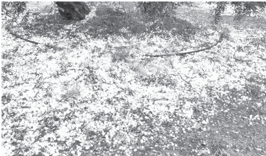
Aceitunas echadas a perder a causa de la granizada. VIVA

En cuestión de 15 minutos, la AEMET elevó el aviso amarillo a naranja por tormentas en toda la zona de Antequera hasta las diez de la noche, pues se llegaron a acumular 30 litros por metro cuadrado por hora. El temporal obligó a