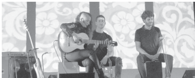
La Tremendita durante el Cabildo Flamenco VIVA

El IV Cabildo Flamenco espera ser un discurrir por el conocimiento del ayer y presente de este arte universal arraigado a nuestra idiosincrasia.