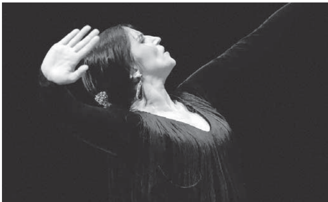
Cartel promocional de la exposición. VIVA

ARCHIDONA | La VII Bienal de Arte Flamenco de Málaga tributa con un homenaje de admiración y cariño al aficionado, fotógrafo y crítico de flamenco José Ramón Zapata Chacón - utilizó, que utilizó el sobrenombre de Zacha para firmar sus imágenes-, y el cual falleció en diciembre de 2019 en Fuengirola (Málaga).