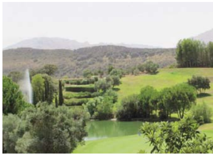
Vista del campo de golf VIVA

El "mayor desarrollo urbanístico residencial y de infraestructuras de toda la comarca de Antequera", situado a unos tres kilómetros de Antequera, estará gestionado principalmente por el grupo Andalucía Essence. La urbanización supone la