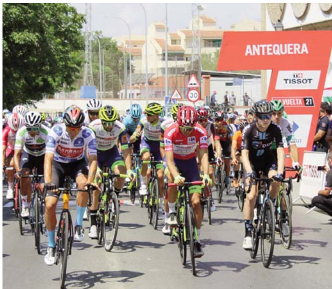
Imágenes del paso de La Vuelta Ciclista por Antequera.

Uno de los principales atractivos de esta salida de