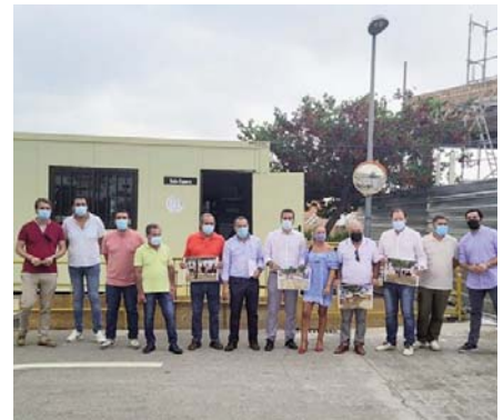
Representantes y alcaldes socialistas.