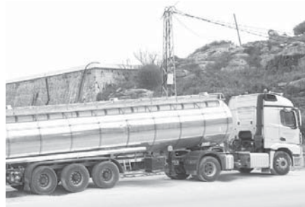
Camiones de cuba en Valle. VIVA

En 2005 las obras del AVE a Málaga provocaron una rotura en el acuífero principal que abastecía al pueblo. Desde entonces, el pueblo del Valle inició una lucha que hoy aún continúa sin solución.