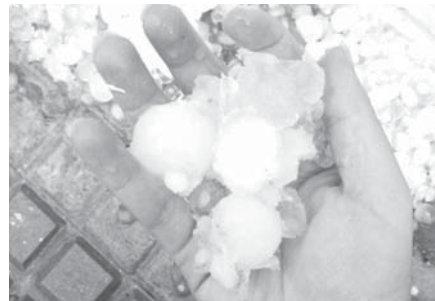
Tamaño de los granizos. VIVA