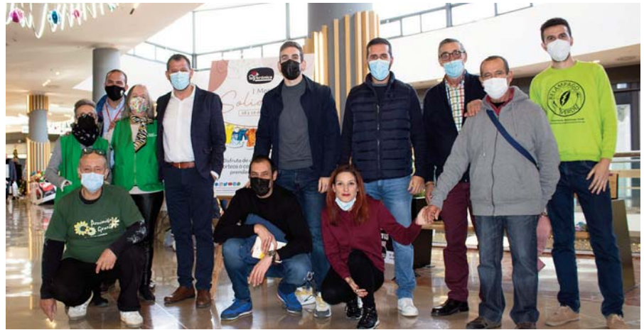
Día de la inauguración. VIVA

y la de todos sus establecimientos e hipermercado. Paralelamente a esta iniciativa se han llevado a cabo activi-