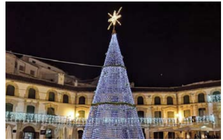
Plaza Ochavada Archidona. VIVA

Concretamente los pueblos firmantes han sido Archidona, Fuente de Piedra, Villanueva de la Concepción, Villanueva de Algaidas, Villanueva de Tapia, Villanueva del Rosario, Villanueva del Trabuco, Humilladero, Alameda, Cuevas Bajas, Mollina y Casabermeja. En conjunto, han emitido un comunicado explicando la situación y pidiendo «comprensión» a los vecinos ante una decisión necesaria, pero «no grata» de tomar. Pues es una decisión que se adopta «teniendo en cuenta que en este momento se ob-