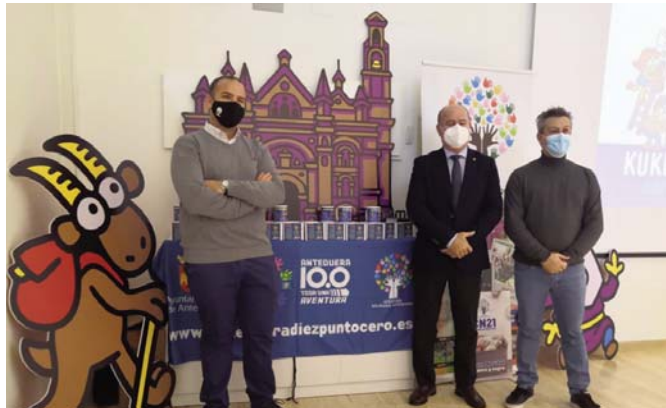
Durante la presentación del proyecto VIVA

ANTEQUERA | Antequera como nunca vista antes. Aventura Solidaria ha promovido el desarrollo de una nueva marca promocional para la ciudad que aterriza en el universo de Kukuxumusu, empresa que se ha encargado de recrear a su estilo las principales señas de identidad en el desarrollo de esta simpática imagen corporativa.