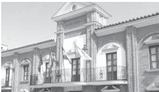
Ayuntamiento de Sierra de Yeguas. VIVA

“Esta medida no va a desestructurar las previsiones económicas ni las cuentas municipales y es posible gracias a la buena situación financiera con la que cuenta el Ayuntamiento, que consiguió, por fin, el pasado año reducir su deuda a cero. Y ello permite ahora asumir operaciones de crédito con las que llevar a cabo proyectos de esta envergadura”, explicó el alcalde de