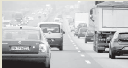
Imagen de recurso vehículos VIVA

En este sentido el Tribunal Supremo sostiene que la finalidad del seguro de responsabilidad civil consiste precisamente en la protección del asegurado ante la eventualidad de la responsabilidad en que pueda incurrir en cada caso.