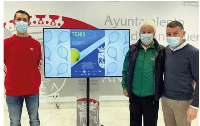
Presentación del evento. VIVA