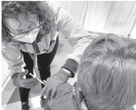
Vacuna a un niño VIVA

El distrito sanitario la Vega ha lamentado dos muertes por Covid en menos de una semana. Se trata de un vecino de Mollina y otro de Sierra de Yeguas que se sumaron a la lista negra de las 126 vidas