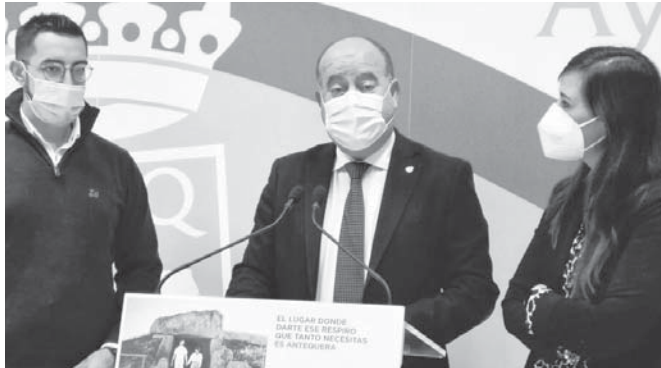
Rueda de prensa sobre la campaña de BonoConsumo.

La idea era sacar remesas semanales de 50.000 euros, pero un "error humano" por parte de la empresa encargada de ponerlos a disposición del público a través de la página web habilitada hi-