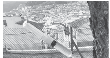
Inyección en el tronco de un pino.

soras. La semana pasada se completaron las actuaciones al respecto tanto en Antequera como en las pedanías, caso de la zonas de Herradores, la Alcazaba, Cantera, barriada Los Remedios, los colegios de San Juan y Veracruz así como en los anejos de Los Llanos, La Higuera y Cartaojal.