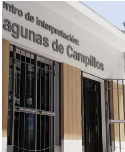
Centro de Interpretación de Campillos. VIVA

Además, se da a los visitantes la posibilidad de conocer toda esa información me-