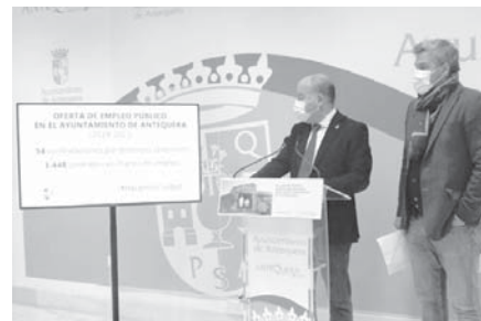
Durante la presentación del balance. VIVA

Durante estos dos años y una pandemia de por medio, la Administración local también ha realizado 1.448