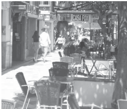
Una terraza de bar en Antequera.

La normativa vigente condiciona dicha exención a que los establecimientos hosteleros tengan que estar abiertos al público un mínimo de diez horas diarias; que estén abiertos seis días a la semana y que el día de cierre del mismo no pueda