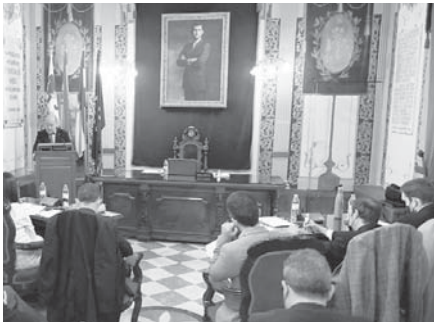
Vista general durante el debate. VIVA

Por su parte, los portavoces de la oposición también tuvieron su tiempo de exposición, produciéndose, como suele ser habitual, un encontronazo entre todos los fren-