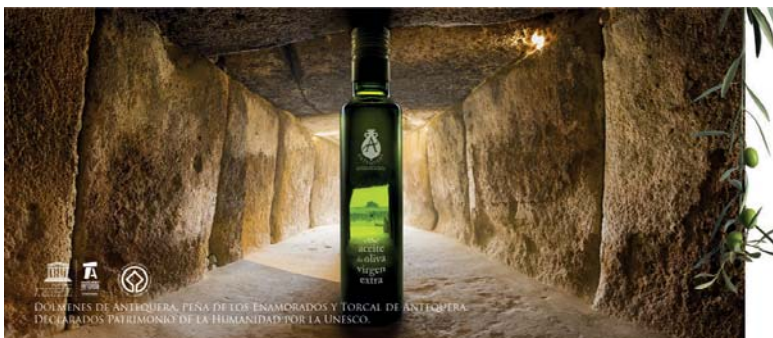
DOLMENES DE ANTEQUERA, PEÑA DE LOS ENAMORADOS Y TORCAL DE ANTEQUERA DECLARADOS PATRIMONIO DE LA HUMANIDAD POR LA UNESCO.

Desde La Verónica quisieron invitar a todos los visitantes a pasar una bonita Navidad en el centro comercial.