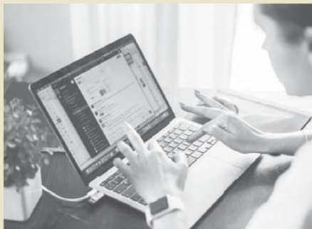
Imagen de recurso VIVA

Sin embargo, no todo es positivo. Uno de los problemas más evidentes es el se-