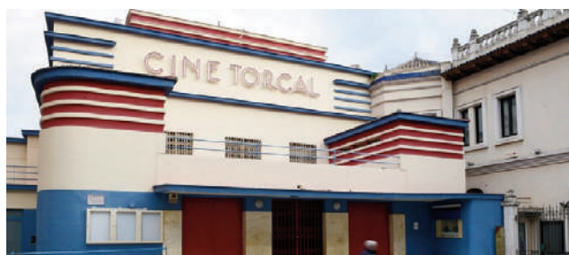
Teatro Torcal desde fuera. VIVA

Carmona ha indicado que “por fin” se van a poder iniciar los trabajos de remodelación en uno de los inmuebles más destacados de la arquitectura moderna andaluza, ejemplo del movimiento artístico ‘Art Déco’. Para ello, se ha encargado la redacción del proyecto al estudio del arquitecto ante-