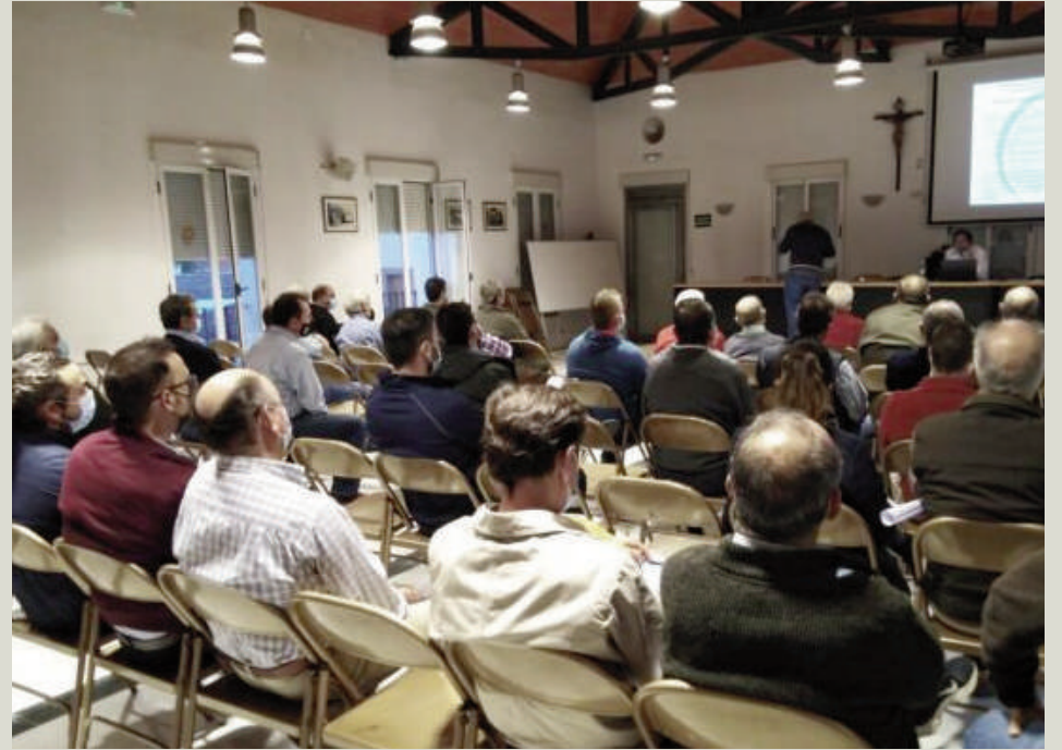
Imagen del evento. VIVA

Sensibilizar y crear conciencia sobre la importancia de cuidar el medio ambiente, proteger la flora y la fauna autóctonas y sumar esfuerzos con las iniciativas mundiales orientadas a frenar el cambio climático son algunos de los objetivos que Dcoop se ha marcado con sus Jornadas de Información en Buenas Prácticas. Una iniciativa que el Grupo ha llevado a cabo durante los últimos tres años y que consigue formar a los agricultores.