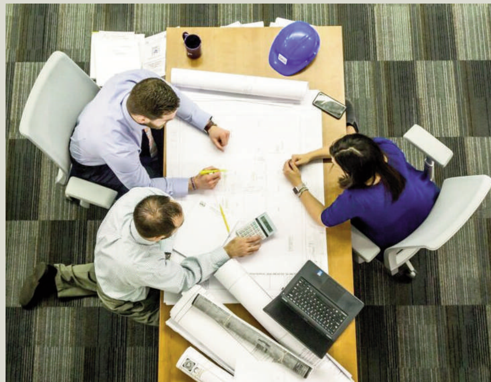
Imagen de recurso trabajo. VIVA

Por tanto, una buena noticia para el futuro laboral y formativo de las empresas españolas.