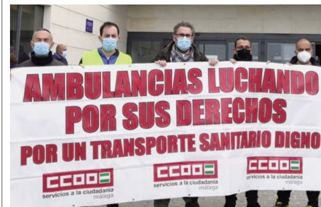
Técnicos de ambulancias a las puertas del Hospital VIVA

Se trató de una nueva jornada de huelga permanente en la que destacaron además el anuncio que ha realizado la Junta de Andalucía sobre la licitación del servicio. Mientras tanto, esperan poder negociar las condiciones mientras sale o no adelante el convenio, que, en caso de que sea deficitario “habrá que impugnarlo, porque si no estamos en las mismas”.