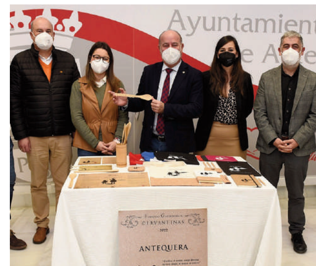
Rueda de prensa de presentación VIVA