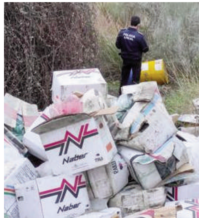
Policía Local de Casabermeja. VIVA

Por su parte, el responsable de la Policía Local ha indicado que la rápida actuación de los agentes de seguridad evitó un impacto medioambiental aún más grave y el riesgo para el equilibrio de los sistemas naturales.