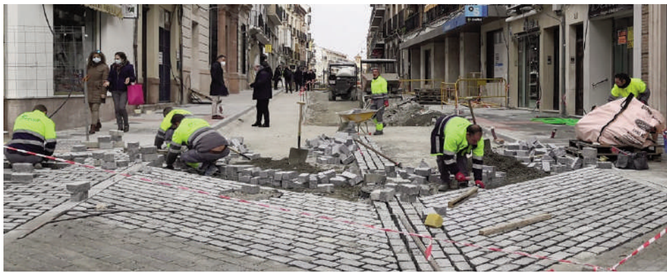
Obras calle Infante Don Fernando. VIVA

ANTEQUERA | Las obras que se están ejecutando en la calle Infante Don Fernando de Antequera, en las que se invierten casi 1,4 millones de euros con un plazo de ejecución de 16 meses, siguen avanzando. Esta actuación va a suponer una importante transformación de la principal vía de la localidad. Se van a sustituir todas las infraestructuras de la vía, ampliar el ancho de las aceras, instalar nuevo mobiliario urbano y renovar el pavimento para el tráfico rodado.