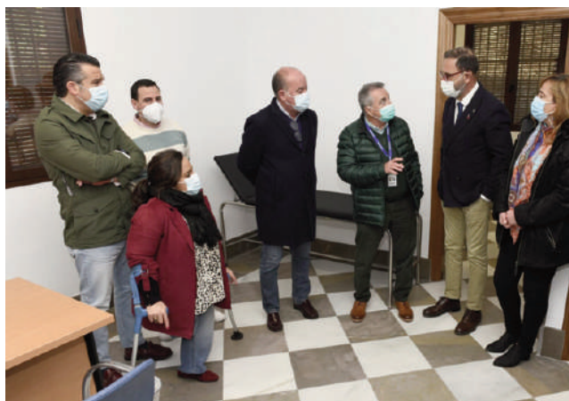
Durante la inauguración de las instalaciones.

La Consejería de Salud y Familia ha dotado al centro de un nuevo equipamiento y mobiliario, que se suma al equipamiento existente, con una inversión superior a los 6.000 euros, habiendo asumido el Ayuntamiento de Antequera el importe total de las obras de ampliación y reforma.