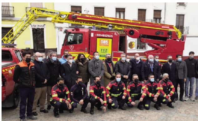
Durante la presentación de los nuevos vehículos VIVA

Se potencia el parque de bomberos de Antequera con otros vehículos: una autobomba urbana ligera, con capacidad para 2.000 litros de agua y unas dimensiones muy compactas para poder acceder a las calles de los núcleos urbanos antiguos; y una autobomba rural pesada, 4x4 y con capacidad para 3.000 litros de agua, para intervenir tanto en incendios de vegetación y de zonas rurales o diseminadas, como en accidentes de tráfico y rescates. Y para las labores operativas y de coordinación, se han incorporado un todo terreno pick-up, de apoyo a cualquier tipo de intervención, y todoterreno jefatura. Asimismo, en los próximos meses estará ope-