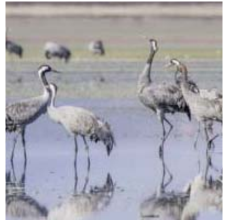
Humedales en Campillos.

Esta actividad se emitió en directo en 'streaming' a través del Facebook ( https://www.facebook.com/aytocampillos ) y del canal de YouTube del Ayuntamiento. La segunda actividad de esta iniciativa, por su parte, ten-