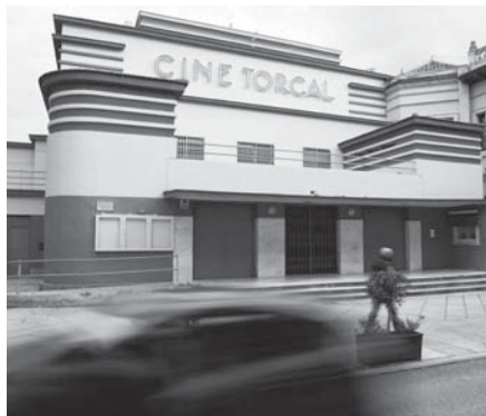
Teatro Torcal desde fuera. VIVA

Carmona ha indicado que “por fin” se van a poder iniciar los trabajos de remodelación en uno de los inmuebles más destacados de la arquitectura moderna andaluza, ejemplo del movimiento artístico ‘Art Déco’. Para ello, se ha encargado la redacción del proyecto al estudio del arquitecto antequerano Ignacio Molina, quien conoce a la “perfección” el inmueble al haber sido responsable de su última remodelación y reconversión en multicines en el año 1998. El pasado lunes se recibió el último informe de los Bomberos necesario para poder dar luz verde al