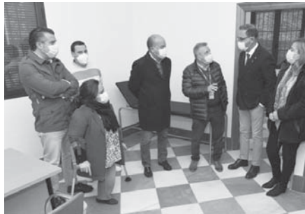
Durante la inauguración de las instalaciones.

La Consejería de Salud y Familia ha dotado al centro de un nuevo equipamiento y mobiliario, que se suma al equipamiento existente, con una inversión superior a los 6.000 euros, habiendo asumido el Ayuntamiento de Antequera el importe total de las obras de ampliación y reforma.