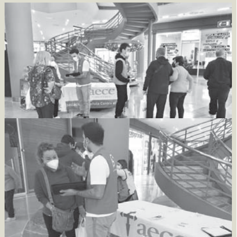
Voluntarios de AECC en La Verónica.

Toda persona que quiso colaborar pudo hacerse socio rellenando un sencillo formulario.