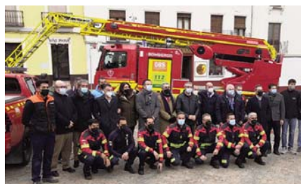
Durante la presentación de los nuevos vehículos VIVA

Se potencia el parque de bomberos de Antequera con otros vehículos: una autobomba urbana ligera, con capacidad para 2.000 litros de agua y unas dimensiones muy compactas para poder acceder a las calles de los núcleos urbanos antiguos; y una autobomba rural pesada, 4x4 y con capacidad para 3.000 litros de agua, para intervenir tanto en incendios de vegetación y de zonas rurales o diseminadas, como en accidentes de tráfico y rescates. Y para las labores operativas y de coordinación, se han incorporado un todo terreno pick-up, de apoyo a cualquier tipo de intervención, y todoterreno jefatura. Asimismo, en los próximos meses estará ope-