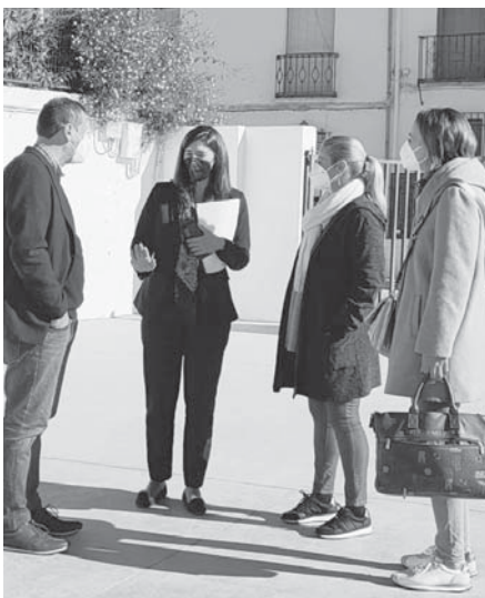
Durante la visita al CEIP San Juan Bautista. VIVA

Durante su visita al municipio, la responsable territorial de Administración Local también informó de la concesión al Ayuntamiento de Cuevas Bajas de una subvención de 18.138 euros por parte de la consejería para la adquisición de "maquinaria de limpieza y desinfección" frente al COVID, en el marco de la línea de ayudas destinada a reforzar servicios públicos de competencia municipal ante aumentos estacionales de población o circunstancias excepcionales como la pande-