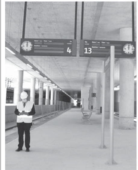
Un andén de la estación VIVA

Cultura al tratarse de un Bien de Interés Cultural (BIC).