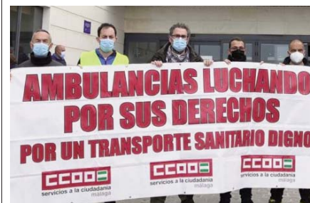
Técnicos de ambulancias a las puertas del Hospital VIVA

Se trató de una nueva jornada de huelga permanente en la que destacaron además el anuncio que ha realizado la Junta de Andalucía sobre la licitación del servicio. Mientras tanto, esperan poder negociar las condiciones mientras sale o no adelante el convenio, que, en caso de que sea deficitario “habrá que impugnarlo, porque si no estamos en las mismas”.