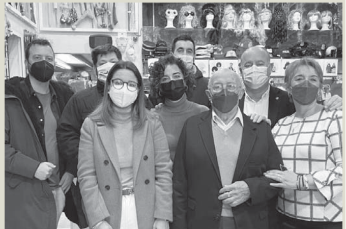
Foto de familia.

“Ha sido un año complicado y difícil a la hora de ensayar, ya que nos hemos tenido que regir por las restricciones. Además, hemos dudado mucho a la hora de decidir si salir o no, hasta el último momento. De hecho, los ensayos más fuertes que se hacen en diciembre no los hemos podido realizar, por lo que hemos empezado ahora en enero y prácticamente vamos a hacer una chirigota en un mes, pero aun así lo hacemos con mucha ilusión y ganas y estaremos presentes en todas las actividades que se organicen”, explicaron.