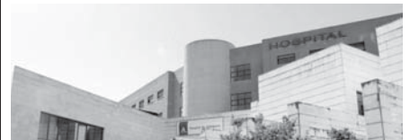
Hospital de Antequera. VIVA

Los contagios se han registrado en Alameda (18), Almargin (2), Antequera (98), Archidona (12), Campillos (25), Cañete la Real (5), Cuevas Bajas (1), Cuevas de San Marcos (7), Fuente de Piedra (10), Humilladero (9), Mollina (7), Sierra de Yeguas (6), Teba (11), Valle de Abdalajís (4), Villanueva de Algaidas (6), Villanueva de la Concepción (2), Villanueva de Tapia (2), Villanueva del Rosario (6) y Villanueva del Trabuco (9).