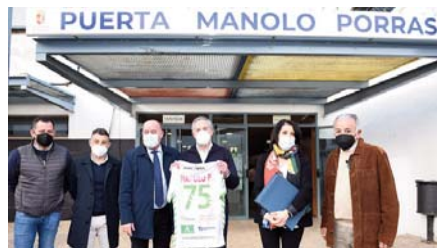
Durante el acto inaugural VIVA

El sencillo y emotivo acto ha tenido lugar escasos minutos antes del inicio del partido de liga ASOBAL que enfrentó