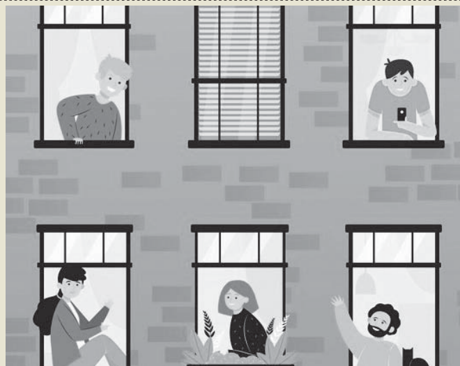
Imagen de recursos vecinos. IVA