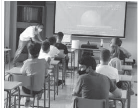
IES Barahona de Soto. VIVA

Es por ello que piden a las administraciones que tomen con urgencia cartas sobre el asunto ya que el personal sanitario y educativo no tiene medios ni competencias suficientes como para poder hacer frente a esta sexta ola.