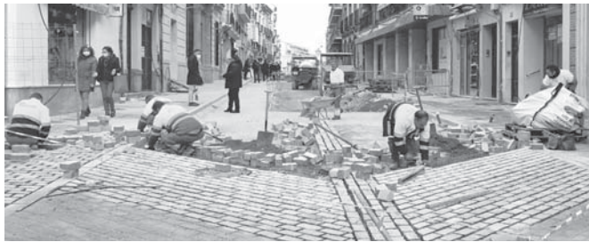
Obras calle Infante Don Fernando. VIVA

Los trabajos se están ejecutando por tramos y han empezado en la zona entre San Agustín y las Cuatro Esquinas, que ya se encuentra al 65% de ejecución. Tras la renovación de todos los servicios y canalizaciones urba-