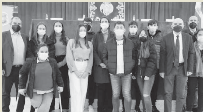
Imagen de la presentación. IVA

vas y la labor de Bancosol impulsando proyectos de esta índole. Los centros seleccionados por esta ONG han sido, además del colegio San Francisco Javier, el IES Ciudad de Coín, diferentes institutos de Málaga: IES Valle de Azahar (Cártama), IES Ben Al Jatib (Rincón de la Victoria), IES General Brenan (Alhaurín de la Torre), CDP El Pinar (Alhaurín de la Torre), IES Rosaleda (Málaga), CDP Maravillas (Benalmádena), CDP San Francisco Javier La Salle - Virlecha (Antequera), IES Mayorazgo (Málaga), IES Las Salinas (Fuengirola), IES Guadalpín (Marbella), IES Guadaiza (San Pedro de Alcántara), IES Cánovas del Castillo (Málaga), CDP Novashool (Rincón de la Victoria), IES La Cala de Mijas, IES Portada Alta (Málaga), IES Camilo José Cela (Campillos), IES Fuente Lucena (Alhaurín el Grande), IES Valle del Sol (Álora), IES Al Baitar (Benalmádena) y Trinidad (Málaga).