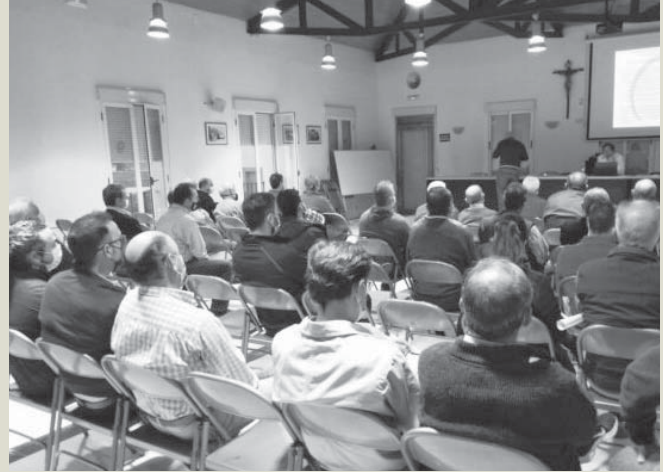
Imagen del evento. VIVA

Sensibilizar y crear conciencia sobre la importancia de cuidar el medio ambiente, proteger la flora y la fauna autóctonas y sumar esfuerzos con las iniciativas mundiales orientadas a frenar el cambio climático son algunos de los objetivos que Dcoop se ha marcado con sus Jornadas de Información en Buenas Prácticas. Una iniciativa que el Grupo ha llevado a cabo durante los últimos tres años y que consigue formar a los agricultores.