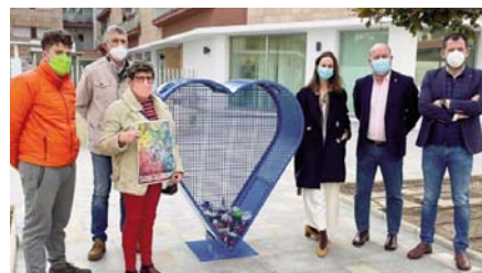
Presentación del nuevo contenedor. VIVA

Por tanto, además de favorecer el desarrollo de una iniciativa solidaria, se trata