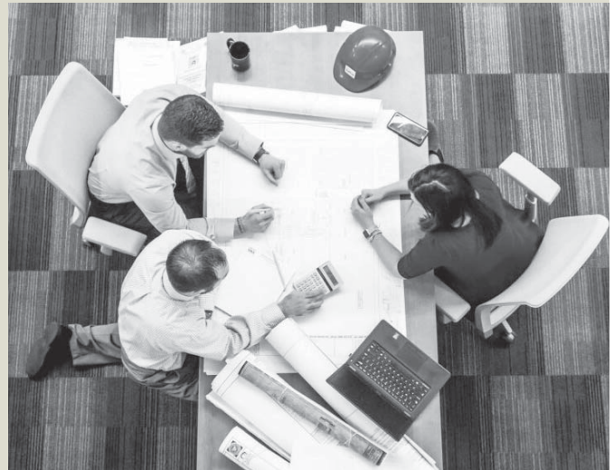
Imagen de recurso trabajo. VIVA

Por tanto, una buena noticia para el futuro laboral y formativo de las empresas españolas.