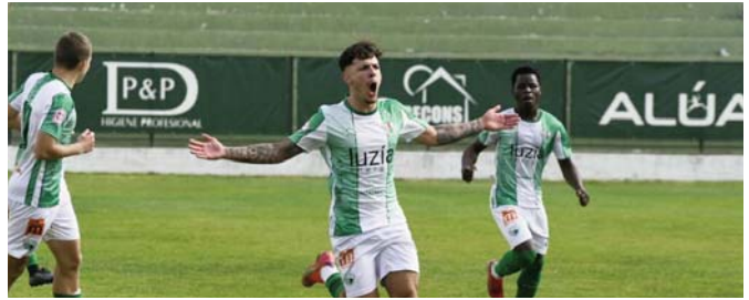
Celebrando un gol VIVA