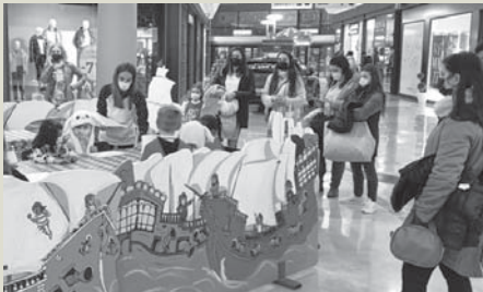
Una imagen en el centro comercial. VIVA

ANTEQUERA | El Centro Comercial la Verónica en Antequera pone en marcha actividades infantiles para el entretenimiento y disfrute de toda la familia. Talleres, manualidades, teatros y títeres esperan a los más pequeños de la casa todos los viernes y sábados por la tarde en la planta alta del establecimiento. El objetivo es que los padres tengan un momento de alivio para poder realizar las compras al tiempo que los hijos se quedan con la monitora realizando el taller. Cada pase tendrá una duración de entre 15 y 20 minutos y un aforo máximo de 10 participantes. Se trata de una actividad totalmente gratuita para menores de entre 4 y 12 años que tendrán garantizada la diversión mientras tú realizas tus compras. En este mes de febrero los ni-