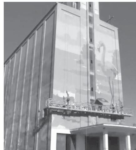
Mural en Fuente de Piedra. VIVA

el Ayuntamiento de Fuente de Piedra compartió a través de sus redes un time-lapse del desarrollo del trabajo en uno de los paneles del edificio, realizado por el fotógrafo local Rafa García, en el que se puede percibir el arduo trabajo que se llevó a cabo para el gran resultado final del proyecto, con el que se pretende simbolizar la riqueza artística, histórica y geográfica.