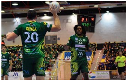
Instante del partido VIVA