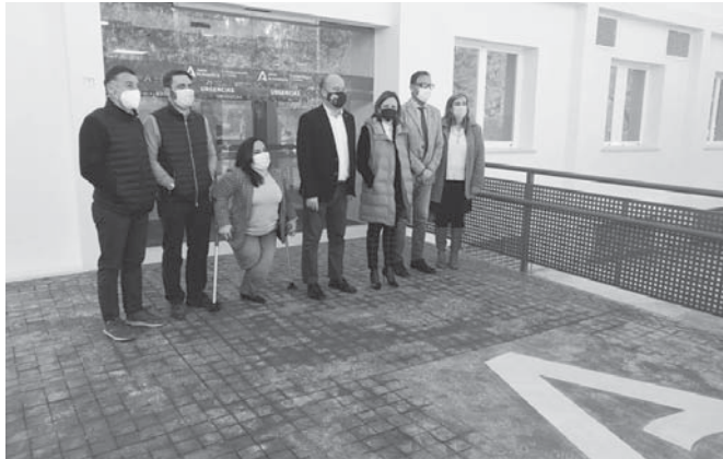
Rueda de prensa sobre la campaña de BonoConsumo.

La reforma, que ha contado con un presupuesto de 600.000 euros, abarca unos 600 metros cuadrados, en