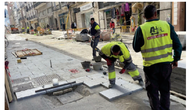
Obremos trabajando en calle Infante VIVA

tender la evolución del séptimo arte y cómo el cine de antaño sigue marcando el actual.