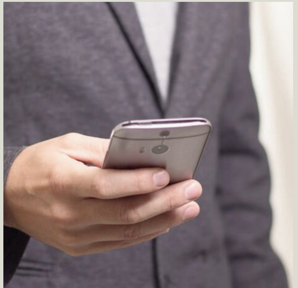
Imagen de recurso móvil. VIVA

También nos podemos encontrar ante el caso de que los contratos sean correctos. Entonces no existe un trámite de alegaciones o impugnación contra la carta recibida. Además, como tampoco se ha iniciado una inspección, no sería necesario en este caso hacer nada.