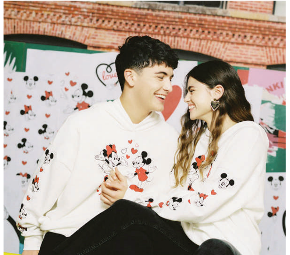
Colección San Valentín Lefties. VIVA

Parece que para muchos los bombones y las flores pasaron a mejor vida. Elijas lo que elijas, no olvides que el amor más importante es el de quererse uno mismo. ¡Feliz San Valentín!