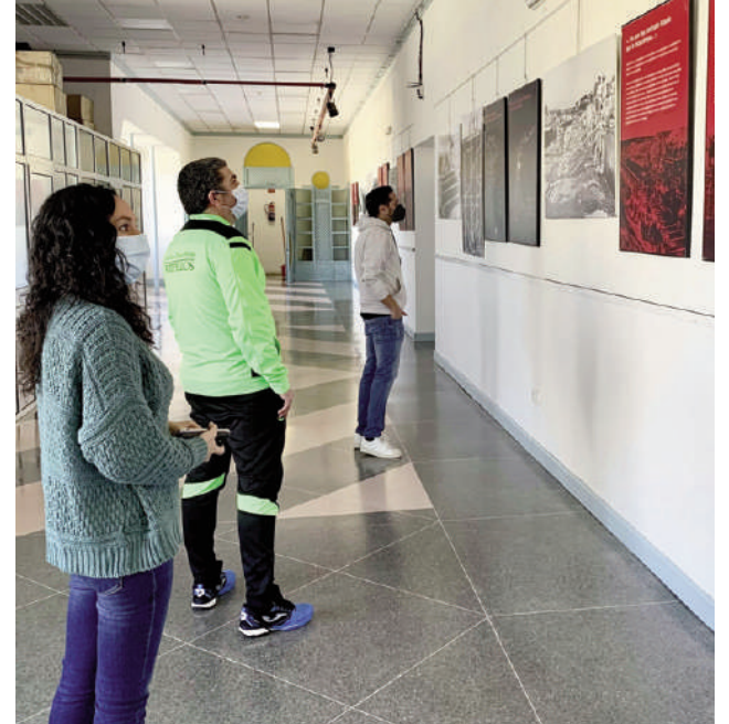
Exposición de la ‘V Semana por la memoria histórica’.