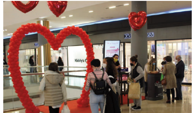
Stand de la planta alta. VIVA

un pack de experiencias gratis. Durante los días 11, 12 y este mismo 14 de febrero, está instalado en la planta alta del establecimiento el tradicional stand de este tipo de eventos para validar los códigos y donde también se pueden recoger los premios de cinco de la tarde a nueve de la noche.