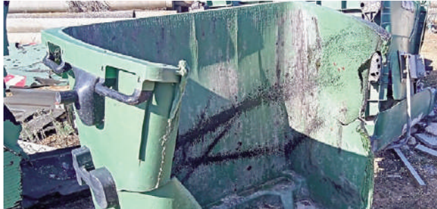
Contenedores quemados. VIVA

Efectivos del Cuerpo Nacional de Policía fueron comisionados por la sala 091 a la plaza de San Francisco donde se encontraba otro contenedor ardiendo que fue también sofocado. Acto seguido, los agentes de la Policía Local de Antequera