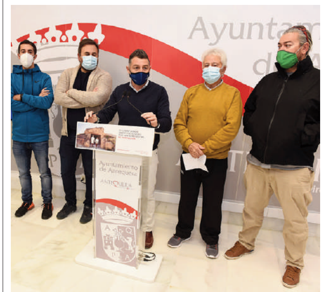
Durante la rueda de prensa VIVA

dando cuenta de los hechos ocurridos en torno al presunto delito de daños y atentado a la autoridad.