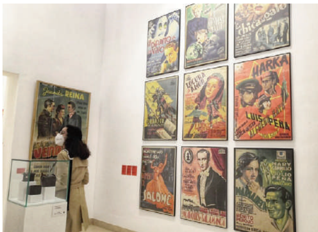
Recorrido por la exposición. VIVA

La colección suma ya más de 4.000 ejemplares y sigue creciendo con el material que el actor encuentra en los almacenes de los teatros y salas, un tesoro histórico que permite entender la evolución del mundo cinematográfico y el de la sociedad reflejada en él. En esta muestra inédita, el actor ha escogido personalmente una amplia selección de carteles, lo más representativos del cine español desde los