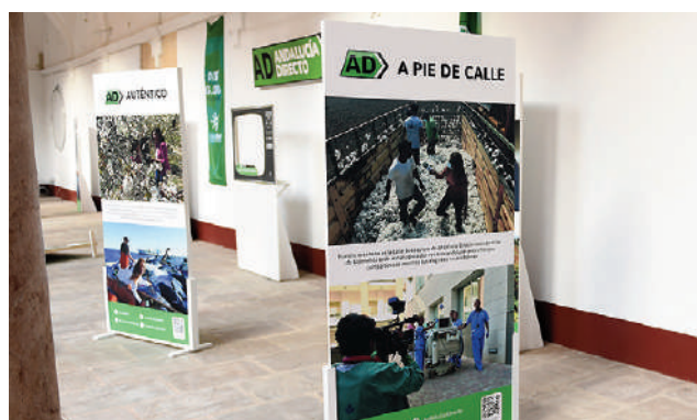
Parte de la muestra en el Ayuntamiento. VIVA