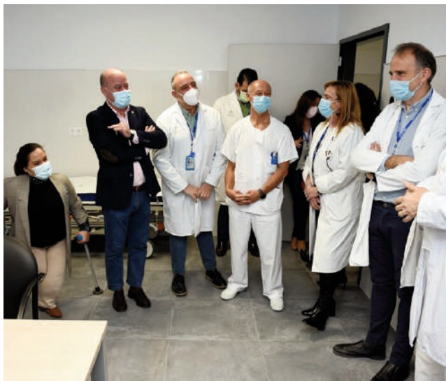
Equipo de gobierno visitando las nuevas dependencias VIVA

En concreto, se han inaugurado dos nuevas consultas de triaje, cuatro de carácter general y una de pediatría. Además, se han mejorado las salas de espera, tanto de pacientes como de familiares, con el fin de prestar una mejor atención a los usuarios y para facilitar la labor de los profesionales sanitarios, pudiendo así retirar de manera defini-