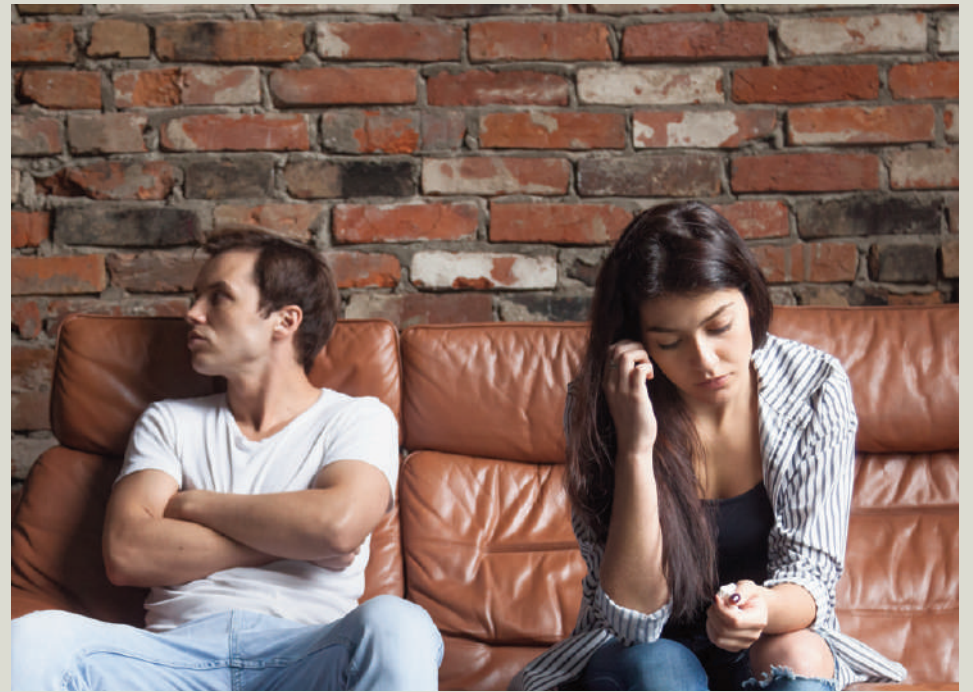
Imagen de archivo separación. VIVA

Se le reconoce una cifra superior a los 100.000 euros, que se obtiene atendiendo al salario que hubiera percibido un empleado o empleada del hogar o al salario mínimo interprofesional (SMI) durante el tiempo que duró el matrimonio.