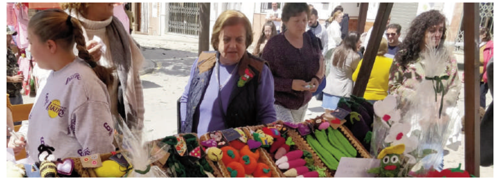
Día de la Haba en Villanueva de la Concepción. VIVA