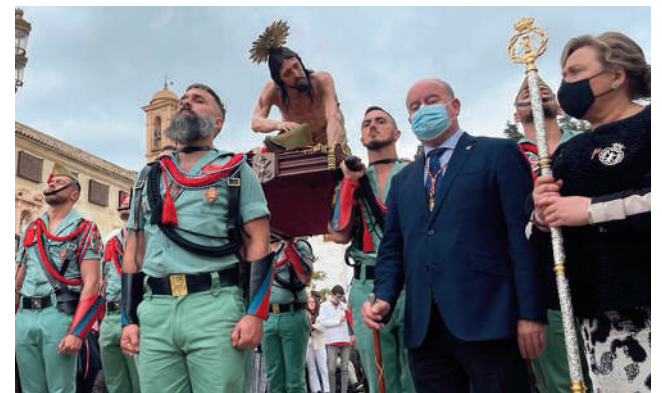
Barón participando en el traslado del Mayor Dolor VIVA

También destacó la gran repercusión económica que ha tenido la afluencia de gente en bares, restaurantes y hoteles de la ciudad.