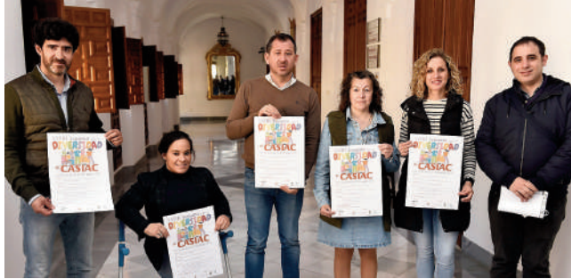
Presentación de la programación. VIVA

El viernes 29, a las diez de la mañana, se realizará la tradicional actividad de valoración de barreras arquitectónicas promovida por CASIAC y AFEDAC en colaboración con los institutos de