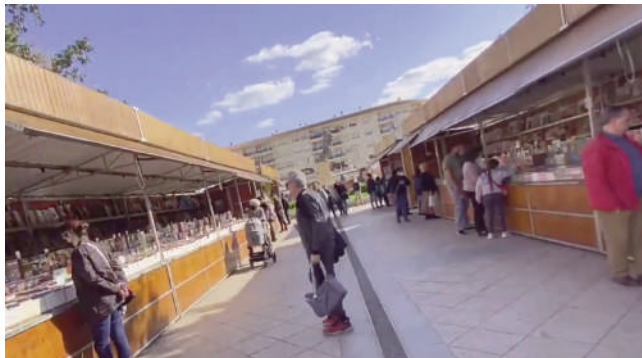
Feria del Libro Antequera 2022. VIVA

Otro de los eventos destacados dentro de la programación del 'Mes del libro' fue la celebración de la siembra de libros que volvió de la mano de la asociación cultural 'Alas de Papel' que tuvo una gran aceptación por parte del público. El objetivo era incentivar la lectura y la escritura en Antequera de una forma rápida, cómoda y sencilla, pues cada participante dejó un libro que tenía en casa para que otra persona lo