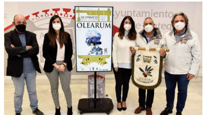
Presentación del Congreso. VIVA

El sábado y el domingo se han reservado para visitas guiadas.