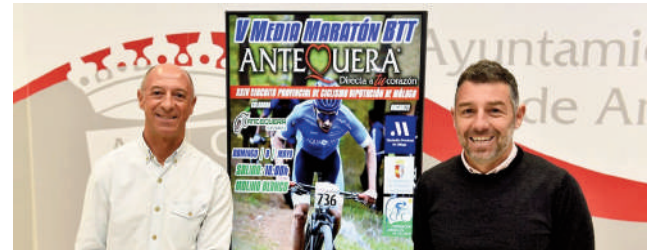
Presentación del campeonato VIVA

ANTEQUERA | Nueva cita con el ciclismo de montaña en Antequera. El próximo domingo 8 de mayo se disputa la V Media Maratón BTT de Antequera, prueba valedera para el XXIV Circuito Provincial de Ciclismo de la Diputación de Málaga. Unos 250 participantes se darán cita en una media maratón que tendrá 34 kilómetros de recorrido, con salida desde las inmediaciones del Restaurante Molino Blanco en el Nacimiento de la Villa desde las diez de la mañana. Las catego-