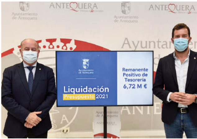
Foto de la rueda de prensa.