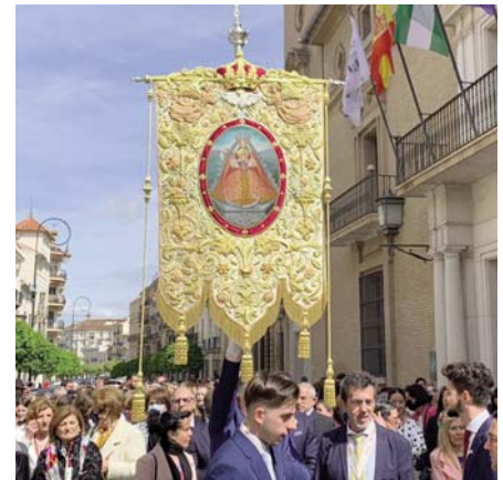
Las cabezas de los ángeles