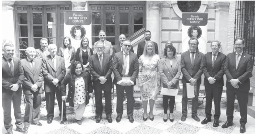
Foto de familia de los galardonados.