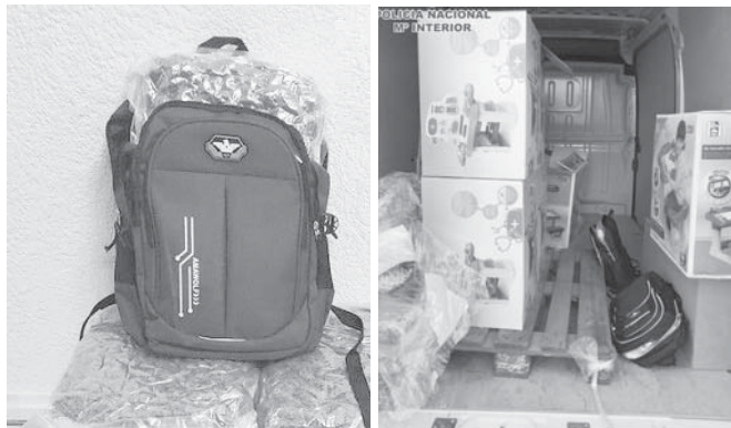
Droga escondida en mochilas y cajas de juguetes VIVA

El operativo contra el tráfico de drogas, que se ha venido desarrollando durante todo el mes de abril, ha culminado así con la detención de dos hombres y una mujer asentados en Málaga como presuntos responsables de un delito contra la salud pública, interviniendo 28,8 kilogramos de marihuana.