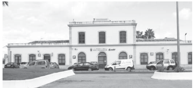
Vista de la antigua estación de trenes.

Estos suelos son de titularidad pública, en concreto del Administrador de Infraestructuras Ferroviarias (ADIF) y del Ayuntamiento de Antequera. En ese sentido, el Consistorio ya ha mantenido contactos con el ente estatal para adquirir la titularidad de la totalidad de estos suelos para ponerla a disposición de la Junta de Andalucía. El servicio de acceso al transporte interurbano en el municipio de Antequera se realiza en la estación de autobuses de la calle Sagrado Corazón, cuya construcción finalizó en 1986. Tras más de 30 años de existencia, y debido a los cambios normativos, los avances tecnológicos, el mayor nivel de exigencia en estándares de calidad, confort, ahorro energético o accesibilidad universal, así co-