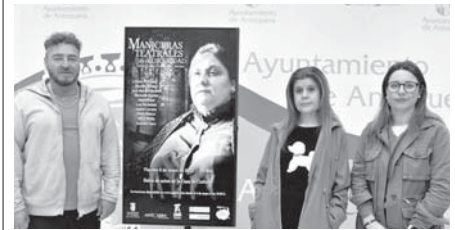
Presentación del teatro. VIVA