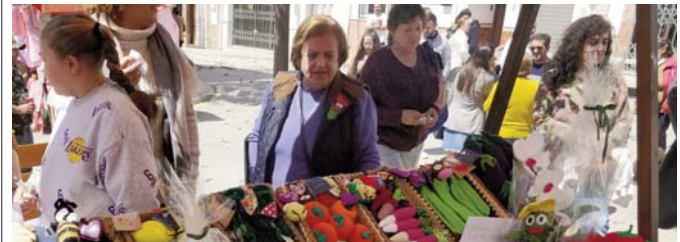
Día de la Haba en Villanueva de la Concepción. VIVA