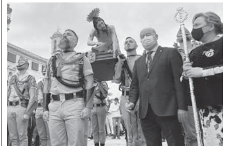
Barón participando en el traslado del Mayor Dolor VIVA

"Antequera ha estado preciosa, ha sido visitada más que nunca en ninguna Semana Santa anterior siendo notorio el completo hervidero de personas y visitantes que habían venido para ver completar los desfiles procesionales", concluyó el alcalde.