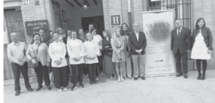
Durante la celebración de las jornadas.