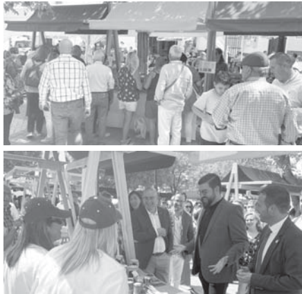
Asistentes en la Feria.

Como novedad este año, el pregón de la celebración corrió a cargo del presentador y humorista Manu Sánchez. Previamente, el treinta de abril, Sánchez ofreció una actuación en la caseta municipal de la localidad, atrayen-