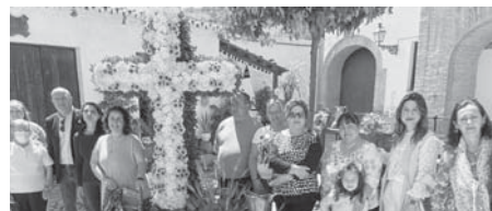
Cruces de mayo 2022. VIVA

En esta edición, dividida en tres categorías, han participado: la Asociación de Vecinos San Miguel, San Juan, La Fuga de Juan García, Veracruz y la Asociación de Mujeres Germinar, en la modalidad de asociaciones y entidades. También la parroquia de Santiago Apóstol, la orden hospitalaria San Juan de Dios y el grupo joven de la cofradía del Consuelo en el