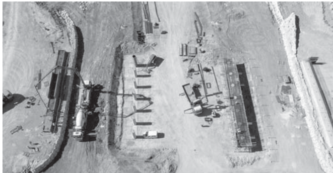
Avances de la urbanización de la primera fase. VIVA

con una extensión de nueve kilómetros se licitarán en 2023 con un presupuesto estimado 15 millones y un plazo de ejecución, una vez se inicien los trabajos, de entre 10 y 12 meses. Un 56,74 por ciento de la inversión corresponde a la empresa Puerto Seco de Antequera SL, mientras que el resto corresponde a la Consejería de Fomento, Infraestructuras y Ordenación del Territorio a