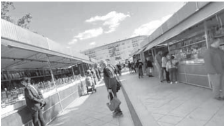
Feria del Libro Antequera 2022. VIVA

Otro de los eventos destacados dentro de la programación del 'Mes del libro' fue la celebración de la siembra de libros que volvió de la mano de la asociación cultural 'Alas de Papel' que tuvo una gran aceptación por parte del público. El objetivo era incentivar la lectura y la escritura en Antequera de una forma rápida, cómoda y sencilla, pues cada participante dejó un libro que tenía en casa para que otra persona lo