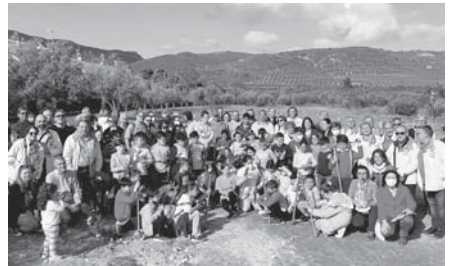
Alumnos del Reina Sofía en la plantación de olivos.

ción de la aceituna' fueron los títulos de ambas y respectivas intervenciones. A continuación, sobre las siete y media de la tarde, tuvo lugar el acto de entrega de los Reconocimientos Olearum 2022 al propio MVCA y a la Asociación en Defensa de las Chimeñas y el Patrimonio Industrial de Málaga, así como el XIII Premio 'Agustín Seres In Memoriam'. El sábado y el domingo se reservaron para visitas guiadas por la ciudad.