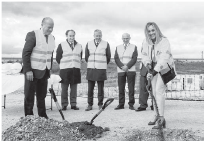
La consejera poniendo la primera piedra. VIVA

Asimismo, ha anunciado que la Junta de Andalucía va a asumir la construcción del ramal técnico ferroviario de conexión al Puerto Seco con la red estatal, ya que "su ejecución es fundamental para generar actividad y aprovechar este nodo logístico". "Al no tener compromiso firme del Estado para su ejecución, hemos decidido dar el paso al frente para construir el ramal", ha señalado la consejera, que ha indicado que en la actualidad está consensuando su diseño con el Administrador de Infraestructuras Ferroviarias (ADIF). Las obras del ramal,