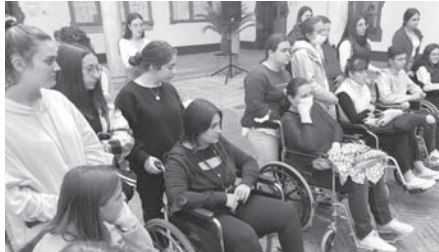
Lectura manifiesto Casiac por la Semana de la Diversidad. VIVA

El miércoles 27 tuvo lugar la presentación del proyecto de la Fundación Tutelar Cristina Marina en el salón de audiovisuales del MVCA. El viernes 29 se realizó la tradicional actividad de valoración de barreras arquitectónicas promovida por CASIAC y AFEDAC en colaboración con los institutos de la ciudad partiendo desde las diez de la mañana desde calle Lucena para finalizar en el Ayuntamiento a las doce re-