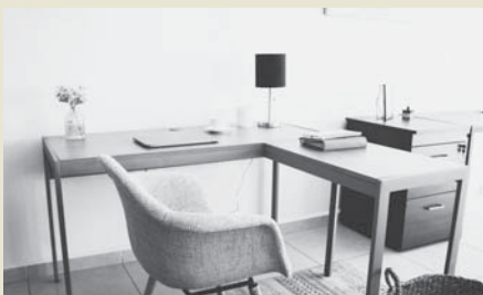
Imagen de recurso oficina. VIVA

Para comenzar, debes escoger una silla y un escritorio adaptado a tu tipo de trabajo y al espacio que necesites. Por ejemplo, un cómodo sillón estilo moderno con un escritorio más vintage, para dar un toque de frescura y juventud. Además, puedes optar por elegir muebles blancos, que aporten frescura y ligereza a la jornada. Además, no olvides cuidar