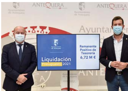
Foto de la rueda de prensa.