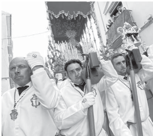
Virgen del Consuelo a la izquierda y Virgen de los Dolores a la derecha. VIVA

Uno de los mayores puntos de interés fue el paso entre ca-