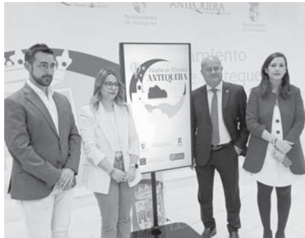
Rueda de prensa de La Noche en Blanco. VIVA

La ACIA también entregará bolsas de compra y establecerá un punto de encuentro en el que, a cambio de mostrar un tique de esa jornada nocturna se dará un pequeño obsequio. Además, repartirá papeletas para el sorteo de 10 cheques regalo de 50 euros. Por su parte, el Ayuntamiento también ha