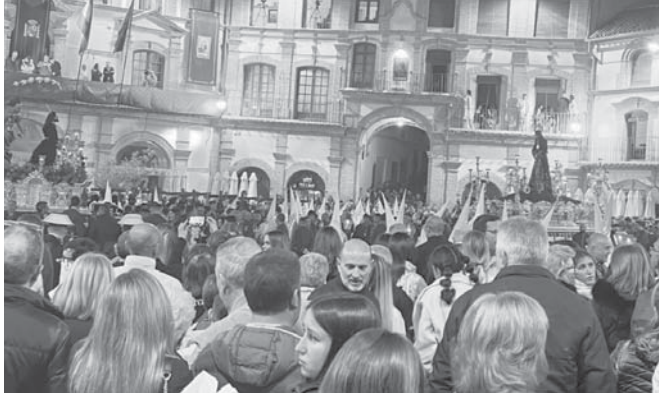
Cofradía del Huerto en la plaza Ochavada. VIVA

Al ritmo que marcan sus tan característicos campanilleros, la cabecera de la Sierra Norte de Málaga se ha vestido de gala para rendir culto a los Sagrados Titulares de sus seis cofradías: La Pollinica, El Huerto, El Nazareno, El Dulce Nombre, La Humildad y La Soledad. Desde el mismo Viernes de Dolores las cofradías han estado aguardando impacientes desde sus templos su esperada salida procesional tras completar todos los preparativos, montar los tronos, repartir túnicas y cerrar recorridos. Mucha ilusión también en conjunto por parte de su agrupación de cofradías que se encamina a los 100 años de historia, siendo la segunda más antigua de