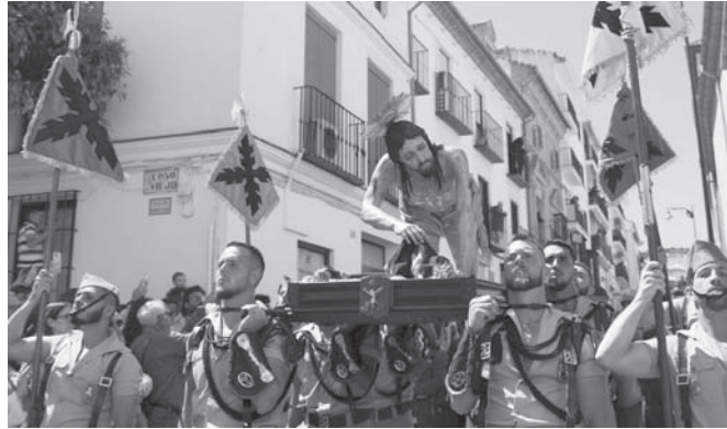
Traslado del Mayor Dolor con la Legión. VIVA

Al abrirse las puertas del templo, se pudo apreciar en