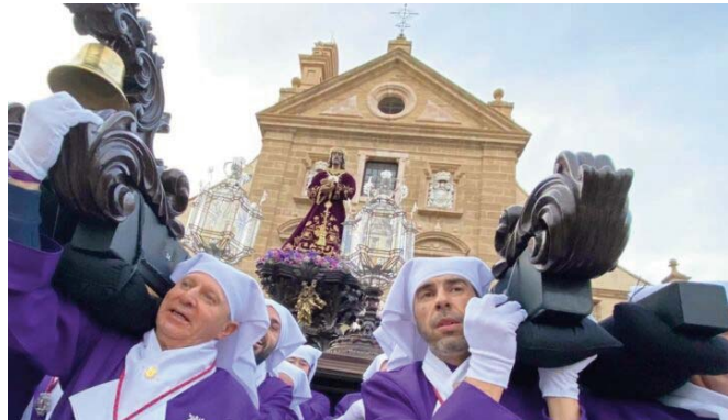
Moreno de la Cruz Blanca en Procesión. VIVA

Centenares de personas abarrotaron la plaza de la Cruz Blanca para presenciar el tradicional encuentro, que destacó por la entonación de marchas y saetas que marcaron el momento más especial de la jornada, demostrando que el Señor del Rescate sigue siendo una de las imágenes con más devotos de la Semana Santa antequerana, junto