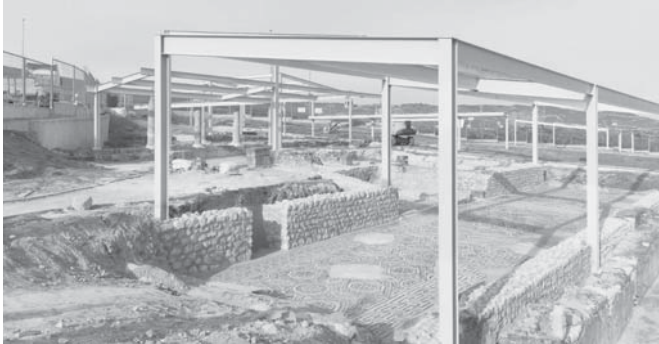
Vista de la Villa Romana VIVA

Un trabajo que, en palabras del alcalde, “ha sido