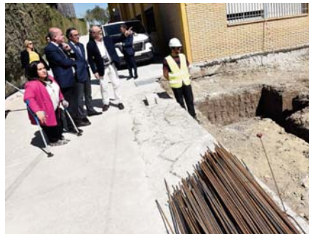
Obreros trabajando en calle Estepa.