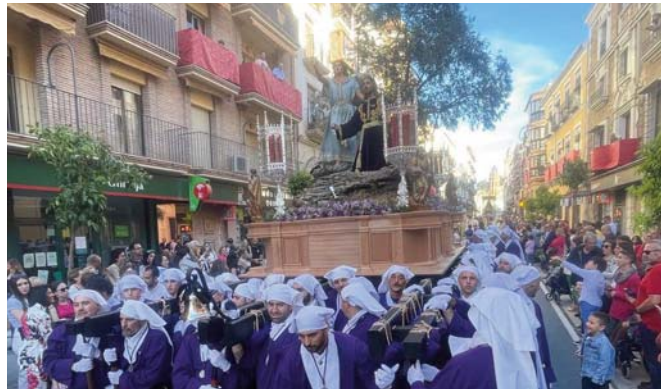
Jesús Orando en el Huerto durante la procesión.

Las calles antequeranas se cubrieron de un manto vivo de jóvenes portando trajes de hebreos y palmas olivo bendecidas para dar paso, a las seis de la tarde, a la salida de los Santos, que este año retomó su recorrido tradicional tras la finalización de las obras de la calle Infante Don Fernando. Así, la procesión tuvo su inicio en San Agustín, continuando por la calle Infante Don Fernando, calle Tribuna, Los Remedios, San Luis y calle Cantareros, donde se desarrolló el tramo en silencio para favorecer a los niños con autismo y sensibilidad auditiva. El recorrido continuó por Madre de Dios, Lucena, Medidores, Tintes y Encarnación. En la Plaza San