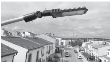
Alumbrado en Campillos VIVA

El Ayuntamiento ha actuado en la inmensa mayoría de barrios de Campillos y ha instalado un total de 1.588 luminarias, reduciendo el consumo anual en 83,62 KW de potencia, lo que supone un ahorro económico de unos 110.000 euros al año. Todas estas mejoras han supuesto una inversión de 48.811 euros.