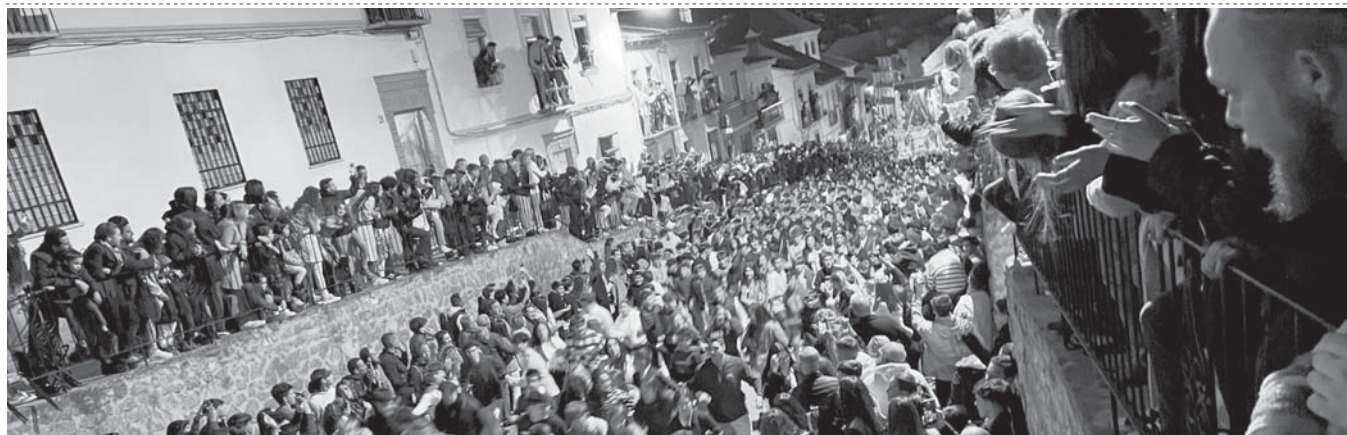
Vega de los Dolores en Cuesta de Archidona. VIVA

ANTEQUERA Cientos de personas esperaban con impaciencia la subida por Cruz Blanca y Cuesta de Archidona antes del encierro