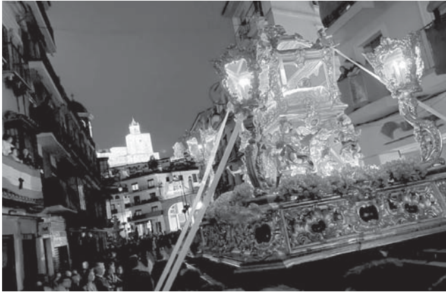
Santo Entierro a la izquierda y la Virgen de la Paz a la derecha. VIVA

ANTEQUERA Viernes Santo multitudinario en la ciudad con el cortejo procesional de tres de sus grandes cofradías