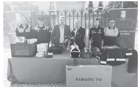
Presentación de la nueva dotación.