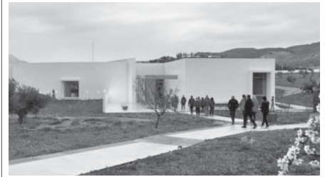
Visitantes en el museo de los Dólmenes. VIVA

Con el cambio de estación y la llegada de la primavera, toca cambio de horario de visitas. Hasta el 20 de junio el Conjunto Arqueológico de los Dólmenes de Antequera estará abierto de martes a jueves de nueve de la mañana a seis de la tarde, los viernes y sábado de nueve a nueve y los domingos y festivos de nueve a tres, mientras que los lunes permanecerá cerrado.