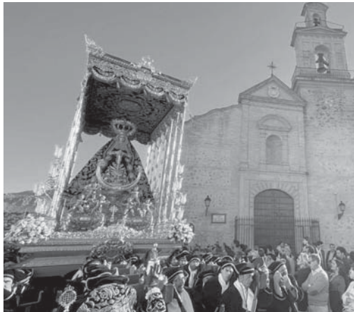
Cofradía del Socorro. VIVA

El desfile estuvo encabezado por la Infantería de la Marina, mientras que la Banda Municipal Amantes de la Música de Campillos repitió con la Virgen y la Banda Muni-