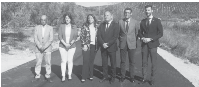
Visita de la consejera a la vía.

OBRAS Un total de 213.000 euros invertidos íntegramente por la Junta