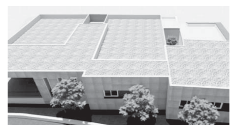
Cuevas de San Marcos centro de salud. VIVA

Lo que sí se llevará a cabo con la reforma es un proceso de homogeneización, recomponiendo la zona del jardín y empleando para la nueva fachada un hormigón prefabricado modular, muy versátil, que mejora la eficiencia energética.