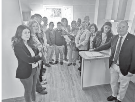
Acto de inauguración de la vivienda. VIVA