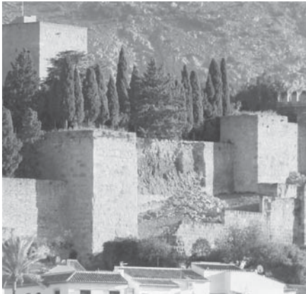
Estado del paño tras el desprendimiento. VIVA

En este sentido, el regidor ha llamado a la calma. "Es una actuación que no con-