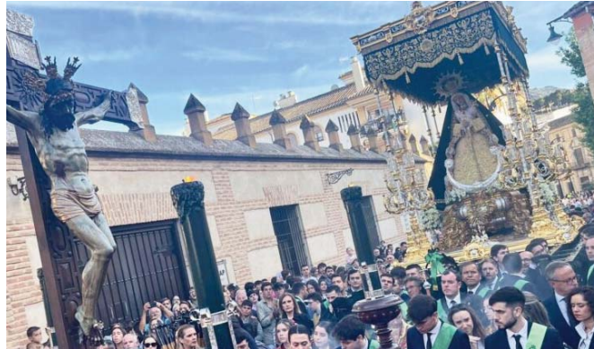
Santo Cristo Verde junto a Nuestra Señora de la Santa Vera-Cruz. VIVA

Este año la Cofradía ha podido lucir preciosas novedades, como es el caso del Palio del Nazareno de la Sangre, uno de los más antiguos de la