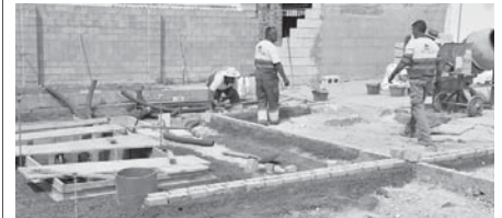
Albañiles en una obra de Antequera.

En el resto de pueblos de la comarca, el paro también ha bajado en Almargen (-6), Campillos (-28), Cañete la Real (-6), Humilladero (-3), Sierra de Yeguas (-15), Teba (-2), Valle de Abdalajís (-6), Villanueva de la Concepción (-7). Mientras que ha aumentado en Alameda (+1), Archidona (+2), Cuevas de San Marcos (+6), Fuente de Piedra (+1), Mollina (+15), Villanueva de Algaidas (+9), Villanueva del Rosario (+7), Villanueva del Trabuco (+1), Tápia (+3) y Cuevas Bajas (+11).