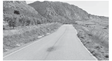
Carretera de La Joya.