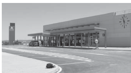
Vista general de la estación de AVE. VIVA

Se trata de una ampliación del contrato actual del autobús urbano, "no es ni la