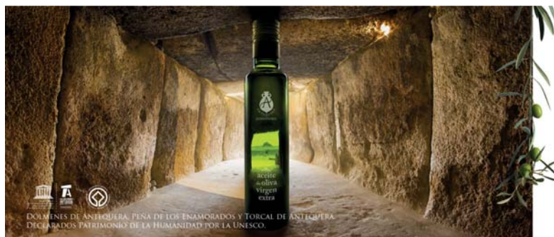
DOMINIOS DE ANTEQUERA, PENA DE LOS ENAMORADOS Y TORCAL DE ANTEQUERA. DECLARADOS PATRIMONIO DE LA HUMANIDAD POR LA UNESCO.