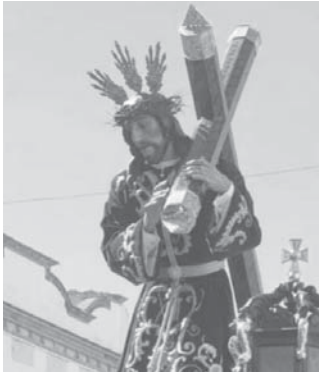
Semana Santa en Campillos.

El Domingo de Ramos procesionó por las calles de Campillos la Hermandad de Nuestro Padre Jesús a su Entrada en Jerusalén y María Santísima de Gracia y Esperanza que tuvo su inicio desde su Casa-Hermandad a las once y cuarto de la mañana