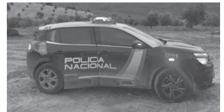
Patrulla Policía Nacional. VIVA

Los arrestados utilizaban vehículos alquilados para sus desplazamientos, y extremaban las medidas de seguridad para dificultar la investigación policial. Este grupo realizaba ilícitos de las mismas características en distintas partes de la geografía andaluza, centrándose en la zona limítrofe entre Málaga, Sevilla y Córdoba.