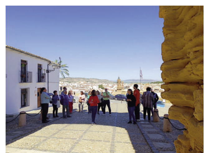
Visitantes en el Arco de los Gigantes.

La agenda terminó el sábado con un taller infantil y familiar de arqueología experimental: 'Construyendo