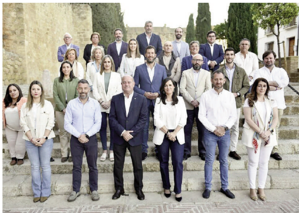
Miembros del Partido Popular que conforman la lista de las elecciones. VIVA

De hecho, el candidato a la reelección como alcalde ha definido al conjunto de los integrantes de su candidatura como “ejemplo de compromiso, lealtad, honestidad y honradez”, conformando una lista “que ama por encima de todo a Antequera” y en el que precisamente el “amor por nuestra ciudad es su denominador común”. Todo ello, con el objetivo principal de seguir conformando “una ciudad moderna”. Al mismo tiempo, ha confirmado que, si sale reelegido como alcalde, cumplirá todo el mandato en el cargo teniendo como única pretensión seguir estando al servicio único y exclusivo de Antequera.