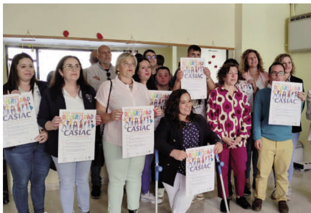
Presentación de la programación. VIVA

El miércoles 26 de abril a las siete de la tarde tendrá lugar una mesa redonda denominada 'Situación legal