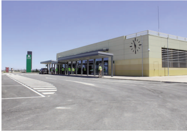
Vista de la estación de AVE. VIVA

El primer autobús sale de la estación a las ocho menos veinte de la mañana y el último llega a las nueve y treinta y seis de la noche. Cada trayecto de ida y vuelta (en total diez al día), cuenta con una duración en torno a los 26 minutos.