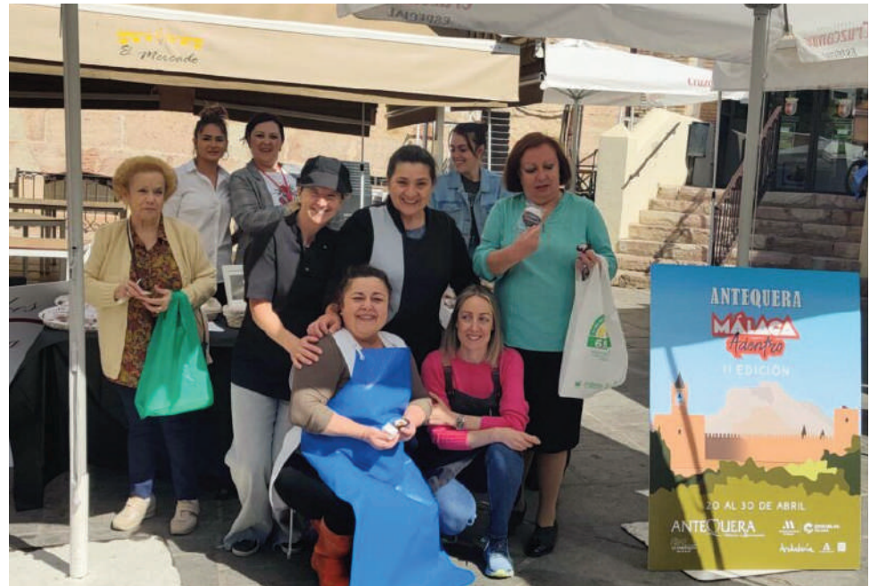
Mercado Gourmet en Málaga Adentro. VIVA

Y para continuar con otra intensa edición también llena de gastronomía, calidad y riqueza culinaria, el martes 25 de abril, en el Museo Ciudad de Antequera, se encontrarán los mundos del deporte y el turismo activo con el gourmet. El objetivo es convertir a Antequera en prescriptora de las nuevas corrientes que ya se están activando en el mundo en este campo del deporte y la gastronomía.