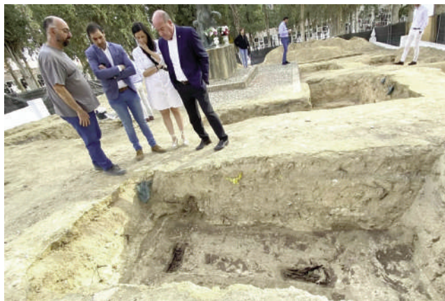
Visita de los trabajos. VIVA

Los trabajos que se han llevado hasta la fecha no han hallado ninguna fosa relativa a la Guerra Civil, descubriéndose osarios, enterramientos ordenados de neonatos, autopsias, restos de-