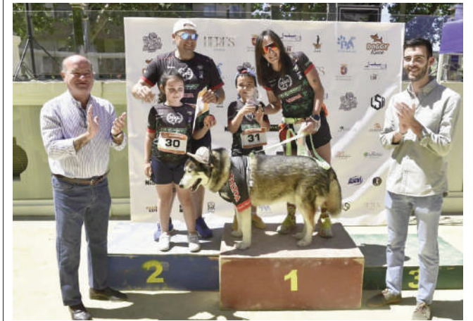
Carrera de perros. VIVA

petición que tuvo un recorrido de 3 kilómetros. Además de la carrera en sí, se desarrollaron exhibiciones de perros de la Policía Local y de la ONCE, así como numerosos sorteos y premios. El objetivo de la iniciativa ha sido unir deporte, convivencia familiar y concienciación sobre el respeto a los animales.