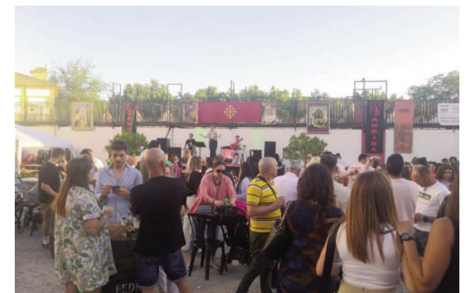
Cata de cerveza.