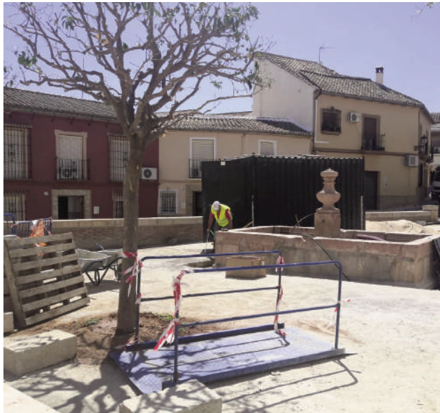
Albañiles en Antequera. VIVA

Los datos de contratación son una vez más muy positivos. Pues en el mes de abril se ha registrado otro medio millar de contratos indefini-