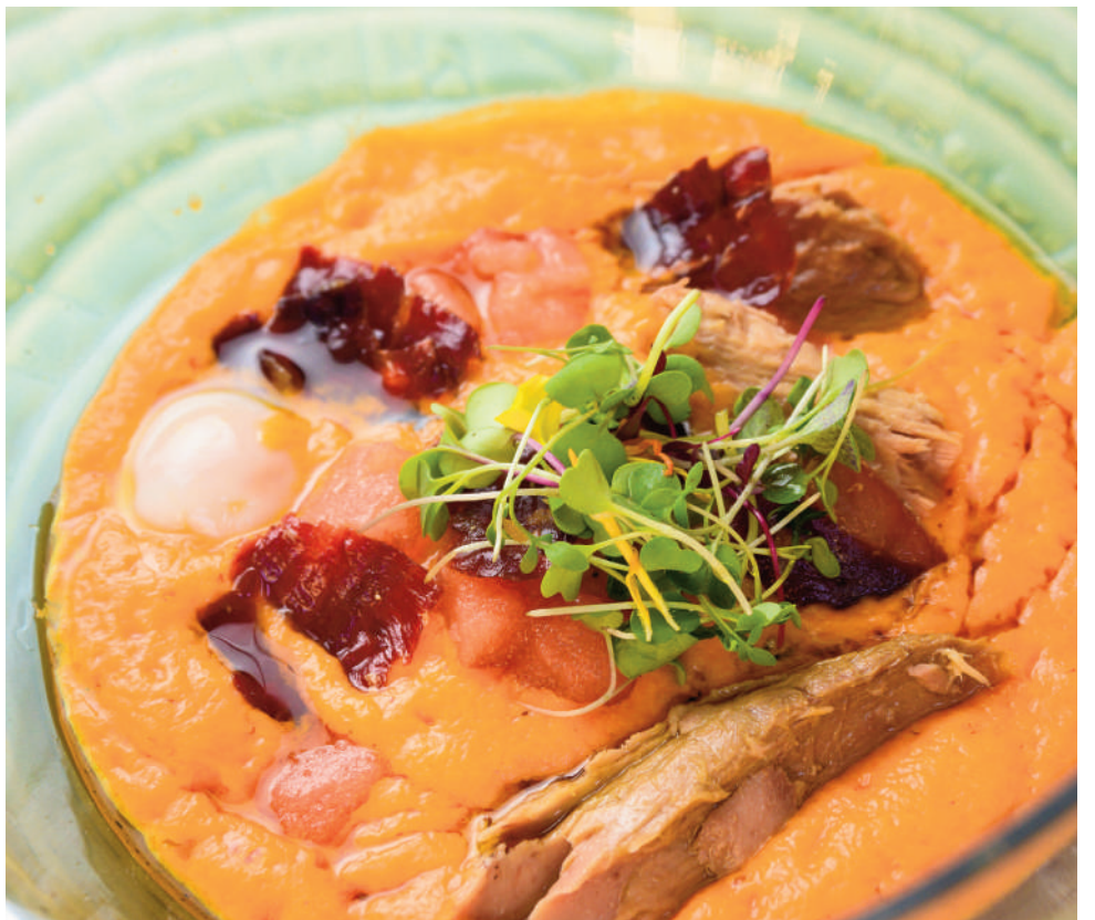
Porra ganadora. VIVA

ANTEQUERA Versiones de clásicos del pop rock en inglés y español