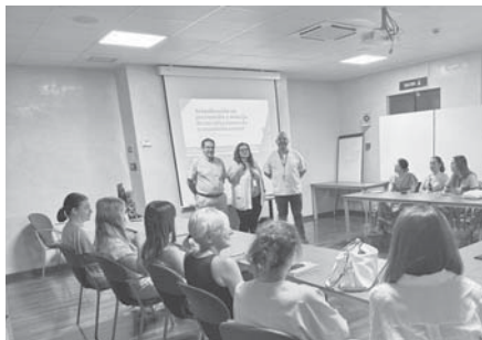
Profesionales formándose. VIVA

de Salud, La implementación de este modelo de atención en las ITS ha supuesto una mejora significativa en la calidad de la atención médica prestada para este problema de salud.