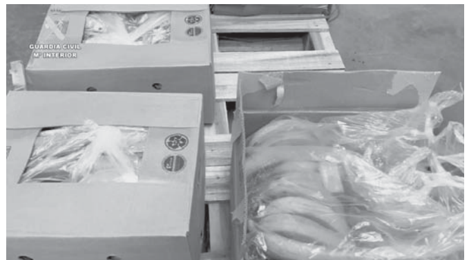
Pallets de bananas. VIVA

Desde diciembre hubo dos alijos frustrados, hasta que el pasado mes de mayo, la organización lo volvió a intentar. Realizaron el envío desde el puerto de Guaya-