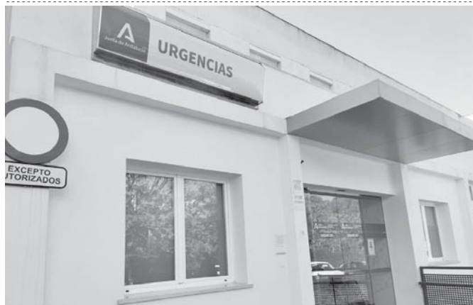
Puerta urgencias Campillo Bajo. VIVA