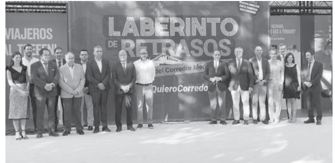
Autoridades en el laberinto. VIVA

El Corredor Mediterráneo es una infraestructura ferro-