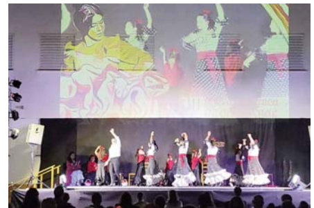
Imagen de una actuación VIVA

El evento, impulsado por la Peña Flamenca de Cartaojal, cuenta con la colaboración del Ayuntamiento de Antequera y la Diputación.