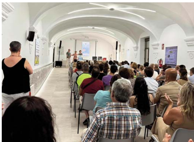
Participantes en las jornadas en la sede de la asociación. VIVA

Resurgir Proyecto Humano Antequera propone la educación, prevención y formación como pilares fundamentales en la lucha contra las drogas. Mediante la colaboración de todas las entidades, asociaciones e instituciones, se busca combatir la normalización de estas conductas en todos los ámbitos.