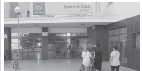
Centro de salud Antequera. VIVA

Una vez consolidada la apertura del punto de urgencias extrahospitalarias en Antequera, la atención no demorable de atención primaria del centro se prestará en el punto de urgencias extrahospitalarias del Campillo Bajo en horario ininterrumpido 24 horas los siete días a la semana.