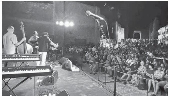
Actuación del año pasado. VIVA

ANTEQUERA Música y patrimonio se dan de la mano