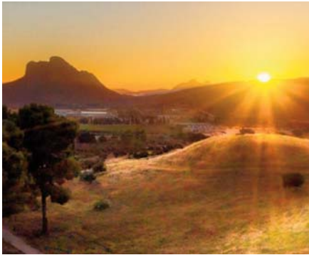
Vista de la Peña desde los Dólmenes VIVA

Las actuaciones musicales arrancaron el 4 de julio a cargo del Cuarteto de Cuerda de la EMMA en el interior de Menga y el 1 de agosto a las diez y media de la noche continuaron con el Dúo de Flauta y Violín de la misma escuela. El jazz de la EMMA también sonará en el Centro Solar Michael Hoskin con un concierto lleno de ritmo y ca-