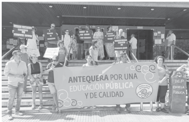
Nueva manifestación en la Delegación de Educación en Málaga.

Fue el 12 de abril cuando la comunidad educativa fue conocedora de la supresión de una de las dos líneas y el 4 de mayo cuando la Junta reafirmó su decisión.