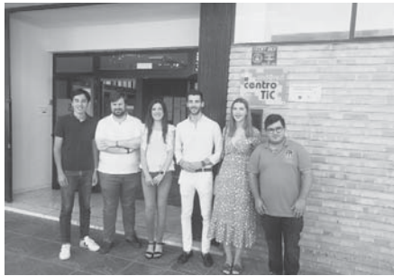
Durante la rueda de prensa. VIVA

En este sentido, ha destacado la incorporación de cuatro nuevos grados: la FP de Logística y Transportes en el IES Pedro Espinosa, la FP de Administración y Finanzas en el IES José María Fernández y la FP de Frío y Calor e Instalaciones Eléctricas en el IES Los Colegiales. "Era necesario que la oferta de FP estuviera adaptada a los territorios y a la demanda de cada municipio y un ejemplo de ello es lo que ocurre en este año", ha señalado. En este sentido, el popular también ha destacado el compromiso de la Junta por los jóvenes. "Desde Nuevas Generaciones siempre hemos apostado