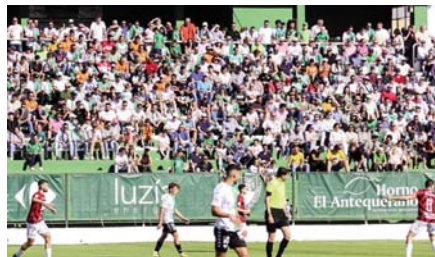
Grada de El Maulí. VIVA

tribuna baja por 140 euros, tribuna cubierta por 170 euros y tribuna cubierta plus por 200 euros. Los renovados disfrutarán de un descuento de 10 euros en todos estos precios. Además, se ofrecerá la opción de carnet infantil para los nacidos entre 2018 y 2010, a un precio de 50 euros para nuevos abonados y 40 euros para renovaciones. También habrá un abono para bebé por 10 euros, sin asiento asignado. El pack familiar se mantiene este año con un descuento del 10 por ciento para tres miembros y presentando el libro de familia. Las renovaciones y cambios de asientos comenzarán el 7 de julio y se extenderán hasta el 21 del mismo mes. A partir del 24 de julio y hasta el 7 de agosto, se podrán ad-