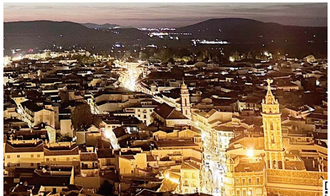
Antequera por la noche VIVA

También ha calificado a 'Luz de Luna' como "un programa de turismo participativo, no solo desde el punto de vista de las visitas turísticas, sino también desde el de la colaboración de todas las entidades e instituciones que de una manera u otra participan en el desarrollo turístico de Antequera".