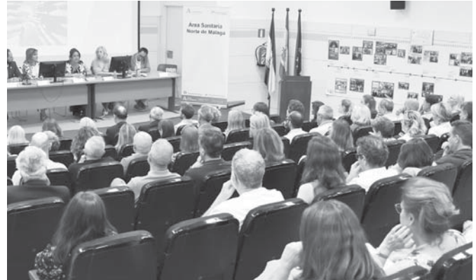
Presentación del programa. VIVA

Se priorizarán 10 actividades para este año, entre las que se encuentran la creación de un Código de Riesgo Suicida y un programa de posvención para personas en duelo por suicidio. El programa cuenta con la colaboración de diversas autoridades y organismos de salud en Andalucía.