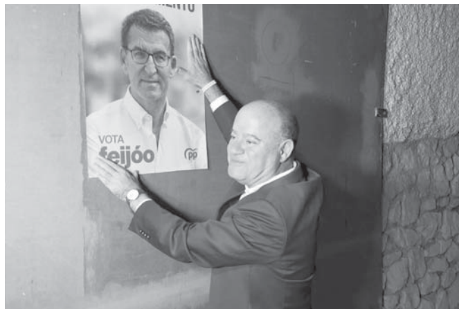
Partido Popular. VIVA

Integrantes de Vox Antequera, quienes no quisieron realizar declaraciones ante los medios, también mostraron su apoyo a Santiago Abascal en su carrera hasta la Moncloa.