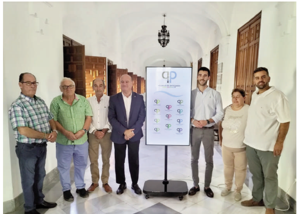
Alcaldes pedáneos junto al alcalde y el concejal de Anejos. VIVA

"Esto no es una tara, al revés, todo lo contrario, esto es una riqueza. Desde el Ayuntamiento intentamos pivotar las acciones necesarias para que todas las pedanías estén coordinadas y atentas a cualquier acción municipal que les pueda afectar", ha afirmado el primer edil.