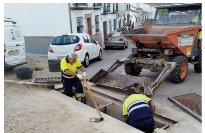
Limpieza de saneamientos. VIVA

Los técnicos de Aguas del Torcal están poniendo especial énfasis en las zonas más bajas de la ciudad y en aquellas en las que confluyen varias calles o arterias principales y, por tanto, más riesgo de acumulación de agua hay. Es el caso de calle Infante