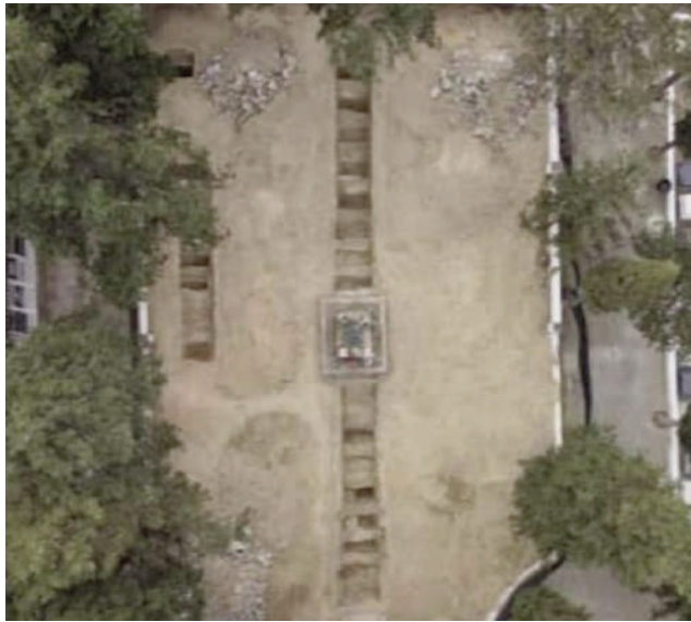
Vista aérea de los trabajos.

“Como conclusión, tras el desarrollo de los trabajos de excavación podemos confirmar que los cuerpos estudiados pertenecen a distintos períodos o momentos temporales. Se trata de depósitos individuales en féretros que se presentaban como enterramientos primarios con relaciones de anterioridad y posterioridad, pero que en ningún momento se interrumpían, desplazaban o rompían, salvo por la intrusión y afección de enterramientos secundarios u osarios que también hemos podido documentar”, se ha detallado en el informe llevado