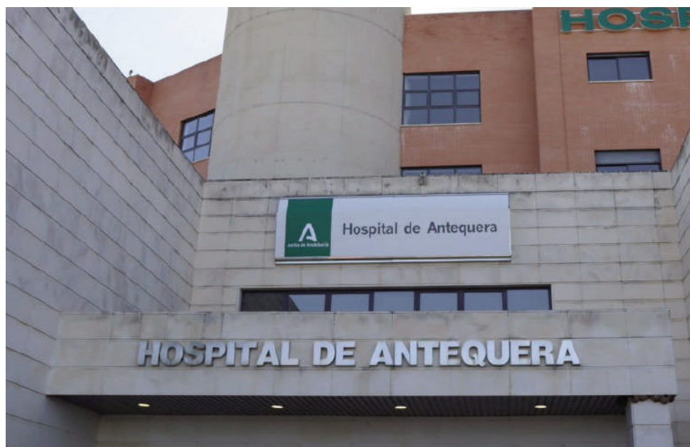
Fachada del hospital. VIVA

En este sentido, las conclusiones y propuestas de mejora resultantes de este análisis pueden ser extrapoladas a cualquier otro centro del Servicio Andaluz de Salud, para lo que se ha elaborado una instrucción de seguridad puesta a disposición de los mismos en el portal de PRL del SAS.