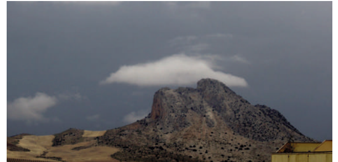
Nublado en Antequera. VIVA

A inicio de la semana, se espera tiempo revuelto, pero con temperaturas suaves.