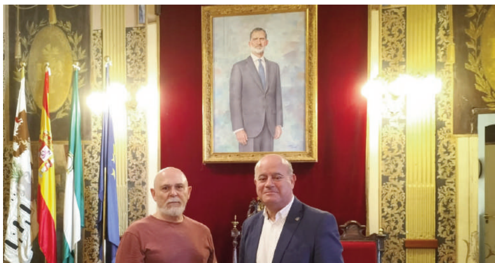
El artista y el alcalde posando junto al cuadro de Felipe VI.

El Ayuntamiento remitirá una foto del retrato a la Casa Real para su puesta en conocimiento, según ha dicho desde el Consistorio.