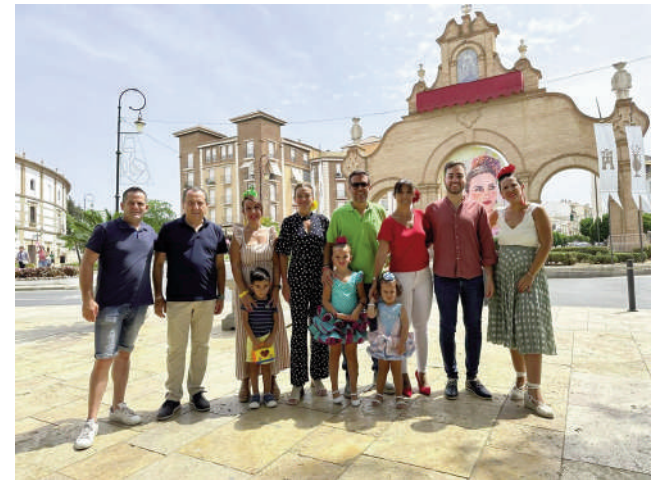
Miembros del Partido Socialista. VIVA

También se suma la controversia por el horario de las casetas de juventud, que se ha acordado una hora, así como la falta de actividades para los mayores, o en su defec-