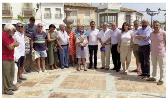
Visita a la plaza reformada. VIVA

Se trata de la intervención más ambiciosa del PFEA en