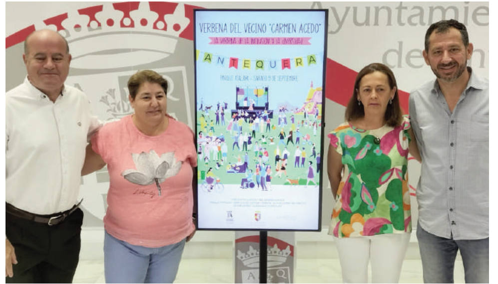
Presentación de la verbena.