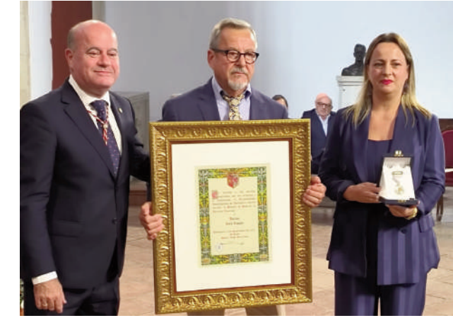
Horno San Roque, Medalla de Plata de la Jarra de Azucenas. VIVA