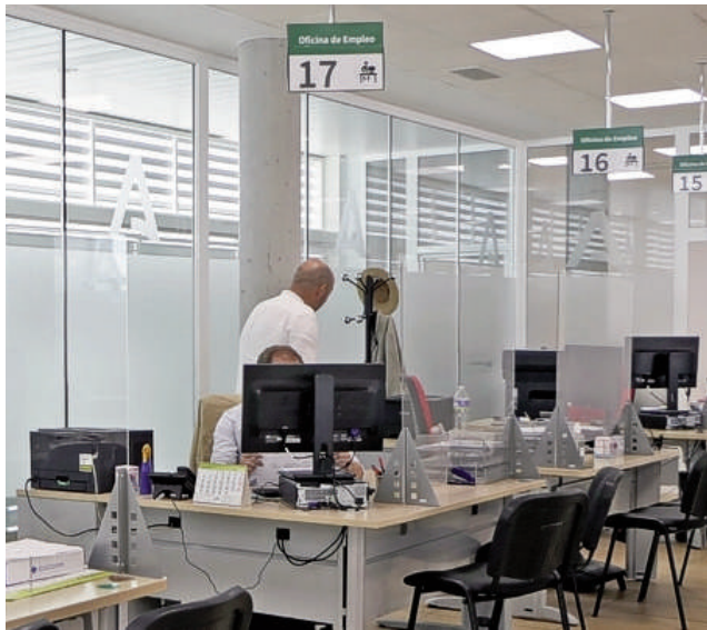
Oficina de empleo. VIVA

Además, cuentan con una superficie de 780 metros cuadrados, el doble que la actual sede de calle Fundición. Dispone de una zona para el SAE, otra para el SEPE, despachos, sala de reu-