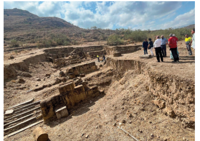
Ruinas de Singilia Barba. VIVA

Los proyectos a realizar son la limpieza y desbroce de fábricas emergentes y terrenos aledaños, con maquinaria y medios manuales y eliminación de la grava y geotextil que cubre el foro; actividad arqueológica preventiva de control de movimiento de tierras de los trabajos de