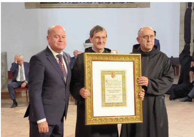
Residencia San Juan de Dios, Institución Predilecta. VIVA