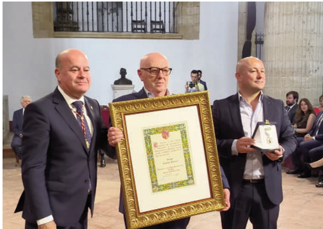
Grupo Sancho Melero, Medalla de Plata de la Jarra de Azucenas. VIVA