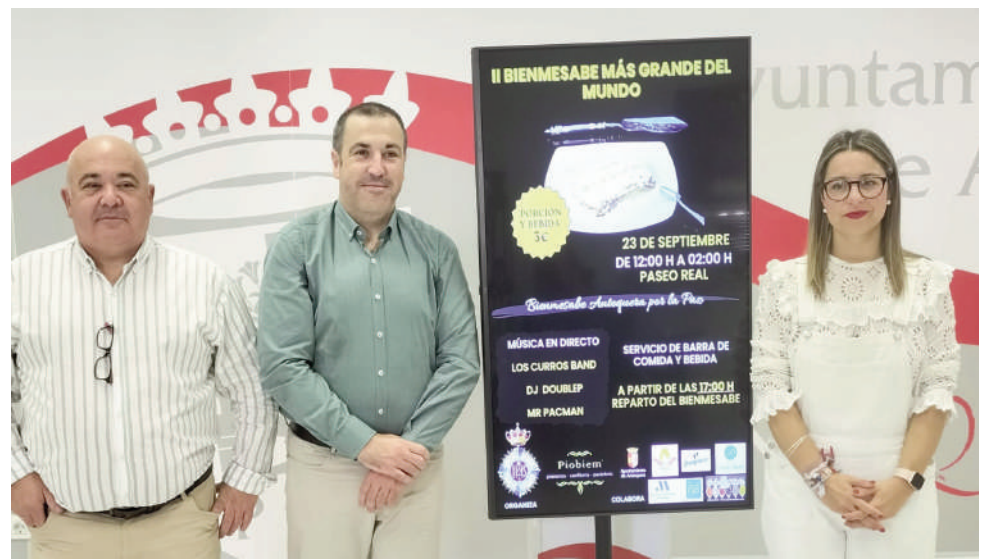
Presentación del evento. VIVA

El impulsor del evento prevé más participación si cabe. "Si el año pasado fue mucha gente, este año espe-