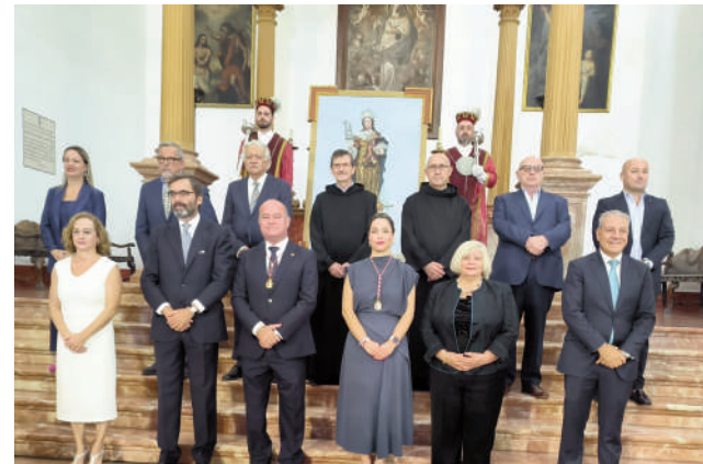
Foto de todos los galardonados.