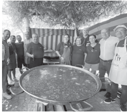
Instantes de la verbena. VIVA

El teniente de alcalde de Cooperación Ciudadana, Al-