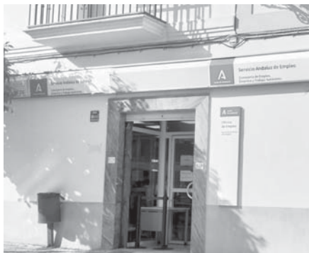
Oficina del SAE en Antequera. VIVA

Al contrario que la cabecera, el paro ha aumentado de forma generalizada en el resto