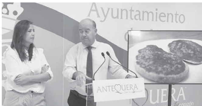
Anuncio de la noticia. VIVA