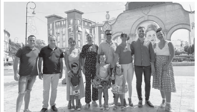
El PSOE en la feria. VIVA

"Para paliar la mala organización de esta Feria de Agosto, propondremos la creación de un grupo con entidades, caseteros y parte de la corporación municipal para repensar el modelo de feria y proponer medidas", ha concluido.