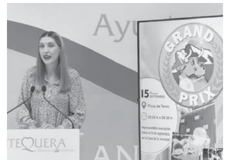
Presentación del Grand Prix. VIVA

La participación es por equipos y la inscripción en el concurso totalmente gratuita. Las solicitudes se podrán