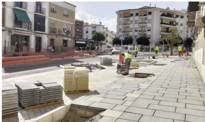
Obras en la Avenida de la Legión. VIVA

El proyecto, redactado por el Ayuntamiento de Antequera, se enmarca en la Estrategia Dusi Caminito del Rey: el desarrollo urbano a través del turismo de interior de la Costa del Sol, cofinanciado por la Diputación de Málaga y el Fondo Europeo de Desarrollo Regional (FEDER) en el marco del Progra-