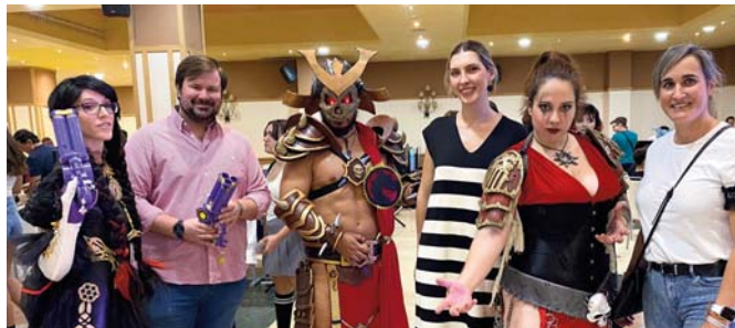
Salón del manga en el Hotel Antequera Hills. VIVA

CULTURA Previamente se presentó un libro sobre fotografía nocturna