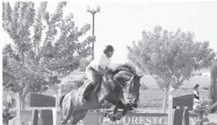
Club hípico. VIVA

Como novedad este año, a parte de la opción de cuadra, ha sacado un servicio más económico que es el pupillage en paddock compartido, donde el caballo vive en semilibertad con otros caba-