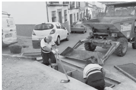
Limpieza de saneamientos. VIVA

Los técnicos de Aguas del Torcal están poniendo especial énfasis en las zonas más bajas de la ciudad y en aquellas en las que confluyen varias calles o arterias principales y, por tanto, más riesgo de acumulación de agua hay. Es el caso de calle Infante