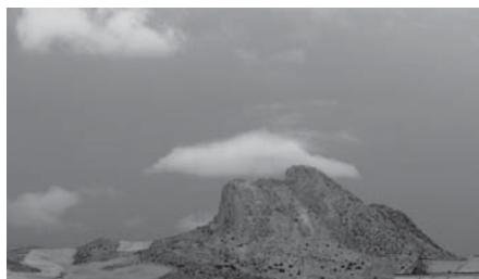
Nublado en Antequera. VIVA

A inicio de la semana, se espera tiempo revuelto, pero con temperaturas suaves.