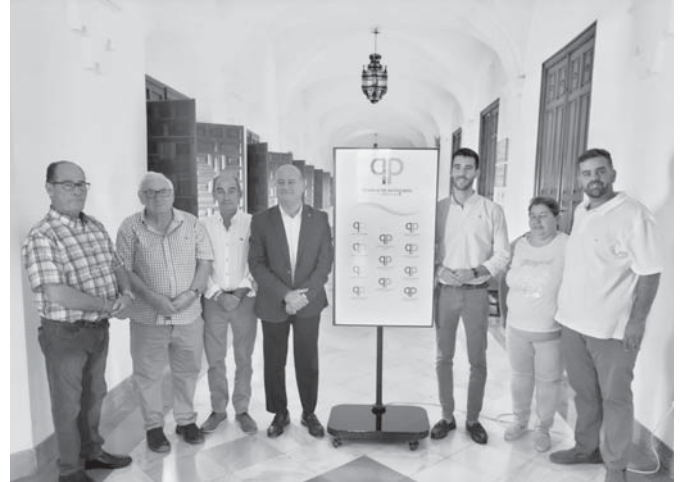
Alcaldes pedáneos junto al alcalde y el concejal de Anejos. VIVA

"Esto no es una tara, al revés, todo lo contrario, esto es una riqueza. Desde el Ayuntamiento intentamos pivotar las acciones necesarias para que todas las pedanías estén coordinadas y atentas a cualquier acción municipal que les pueda afectar", ha afirmado el primer edil.