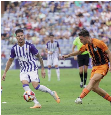
El Antequera CF contra el Recre. VIVA