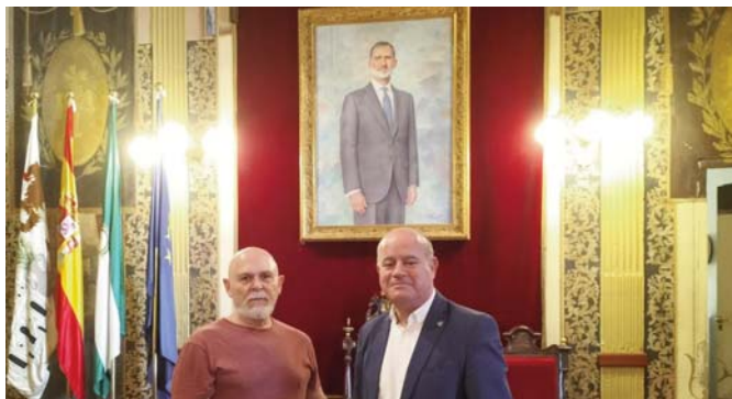
El artista y el alcalde posando junto al cuadro de Felipe VI. VIVA

El Ayuntamiento remitirá una foto del retrato a la Casa Real para su puesta en conocimiento, según ha dicho desde el Consistorio.