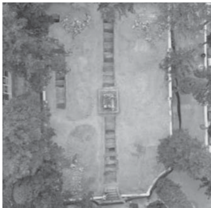
Vista aérea de los trabajos. VIVA

“Como conclusión, tras el desarrollo de los trabajos de excavación podemos confirmar que los cuerpos estudiados pertenecen a distintos períodos o momentos temporales. Se trata de depósitos individuales en féretros que se presentaban como enterramientos primarios con relaciones de anterioridad y posterioridad, pero que en ningún momento se interrumpían, desplazaban o rompían, salvo por la intrusión y afección de enterramientos secundarios u osarios que también hemos podido documentar”, se ha detallado en el informe llevado a cabo por los investigadores. Ante esta situación, los