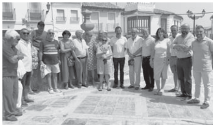
Visita a la plaza reformada. VIVA

Se trata de la intervención más ambiciosa del PFEA en