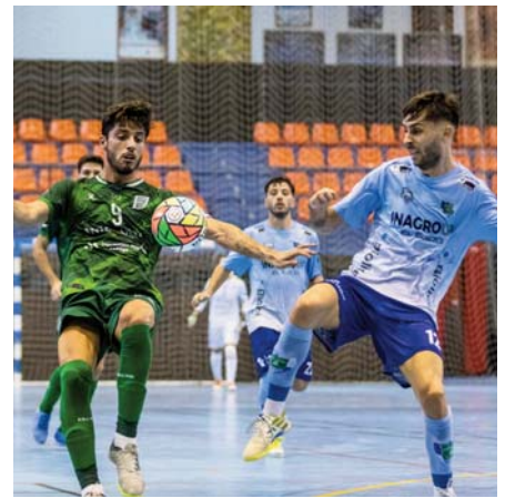
Partido del UMA Antequera. VIVA

Un resultado final de 53 antes de encarar la última semana de preparación con un amistoso el martes 12 de septiembre en Torremolinos