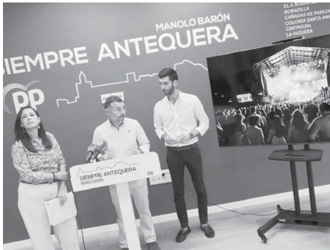
Rueda de prensa. VIVA