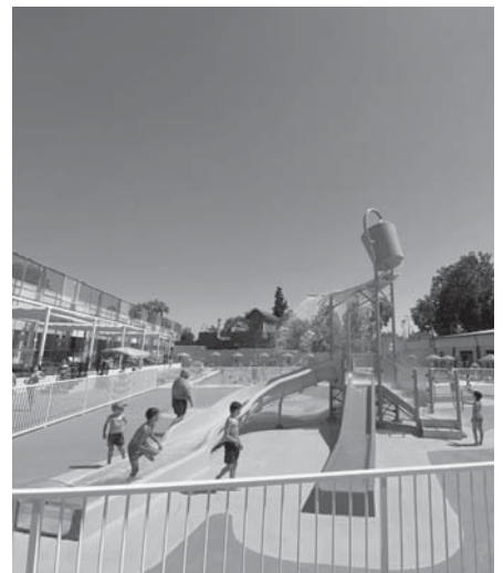
Piscina de Antequera. VIVA

“Ya están los permisos para la piscina de Bobadilla Estación”, que se sumaría a la piscina de verano de Antequera, la cubierta y la de