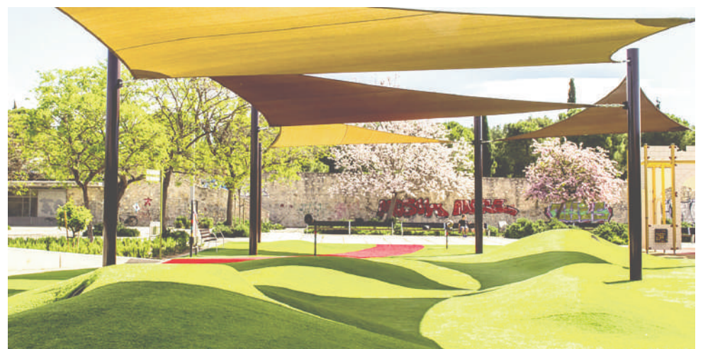
Presentación del sistema en El Romeral.

Salado ha explicado que en el centro de autismo las familias tendrán "un papel absolutamente protagonista en todos los proyectos que pongamos en marcha", y ha añadido que "también queremos a implicar a las entidades sociales y a las empresas privadas que, a través de sus políticas de RSC, puedan apoyar a este colectivo desde distintos ámbitos, como la formación y capacitación para el empleo e incluso la inserción labo-