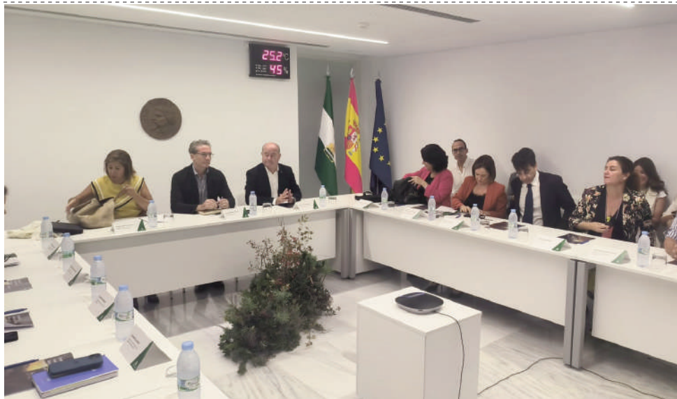
Presentación de los mapas. VIVA