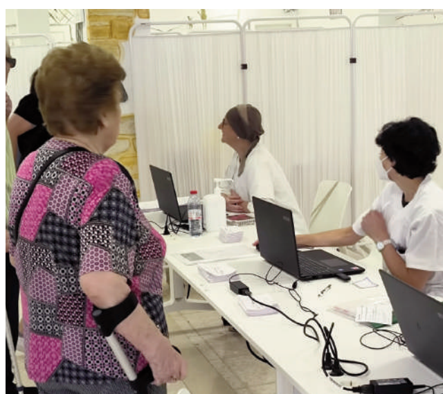
Presentación de la campaña . VIVA

Hasta el 31 de enero, todas las personas que acudan hasta la biblioteca para vacunarse de estas enfermedades recibirán de forma gratuita un libro a elegir en-