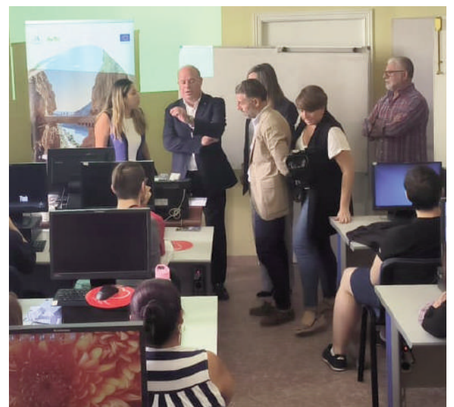
Uno de los cursos de formación . VIVA

“Desde el Ayuntamiento de Antequera estamos siem-