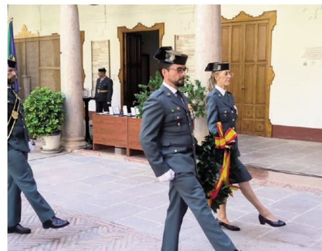
Acto en el Patio del Ayuntamiento. VIVA