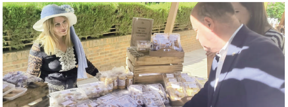
Mercado . VIVA

SALUD Regalan libros a las personas que se vacunen