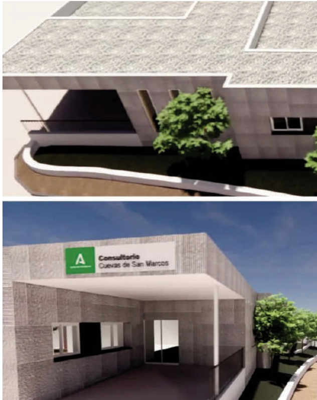
Proyecto ampliación centro salud. VIVA

Con estas reformas que rozan el millón de euros, el municipio de Cuevas de San Marcos dispondrá de un servicio médico más completo a beneficio de los casi cuatro mil habitantes que viven en la localidad malagueña y que ahora contarán con unas instalaciones mejoradas.