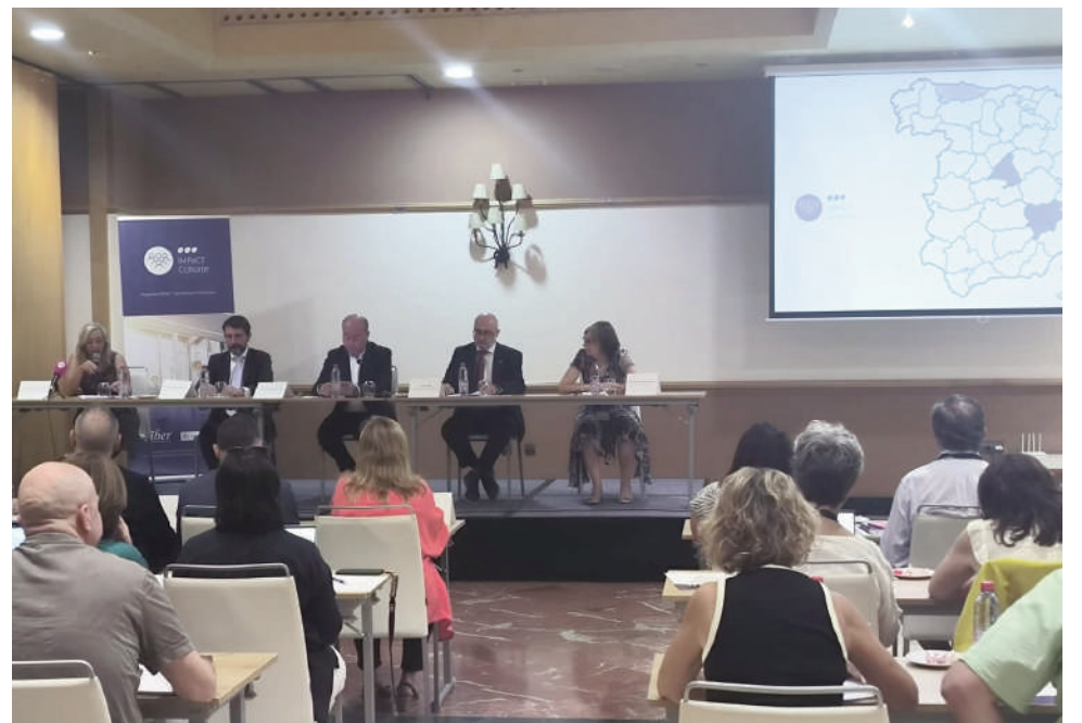
Inauguración del proyecto en el Antequera Hills. VIVA

El estudio prevé implantarse en 50 centros de salud (centros IMPaCT) repartidos por toda España, desde los que se contactará y monitorizará a los participantes seleccionados aleatoriamente. En línea con la distribución de la población española, un 30% de estos centros estarán en áreas rurales y otro 70% en áreas urbanas.