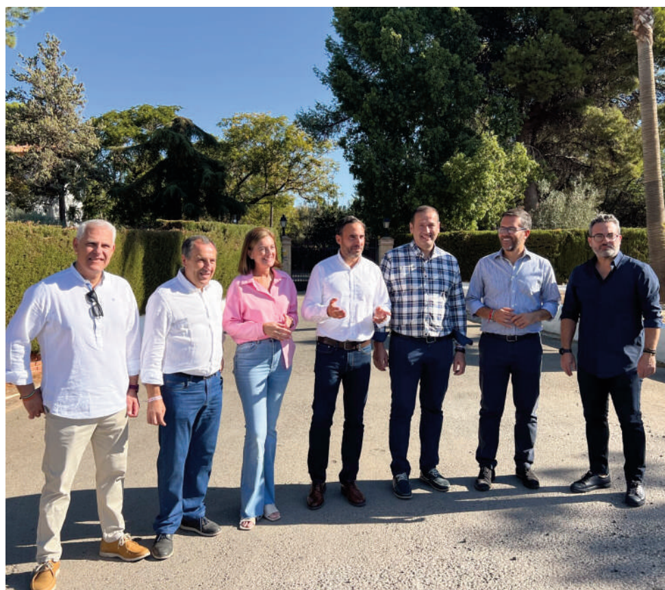
PSOE en la puerta de la residencia. VIVA

El PSOE va a presentar una moción en Diputación instando al equipo de gobierno de la Diputación a que garantice la continuidad de la residencia de La Vega en Antequera e instando a la Junta de Andalucía a llevar a cabo el concierto del mayor número de plazas.