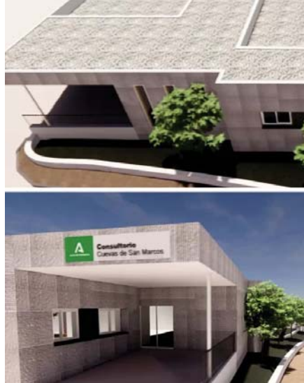
Proyecto ampliación centro salud. VIVA

Con estas reformas que rozan el millón de euros, el municipio de Cuevas de San Marcos dispondrá de un servicio médico más completo a beneficio de los casi cuatro mil habitantes que viven en la localidad malagueña y que ahora contarán con unas instalaciones mejoradas.