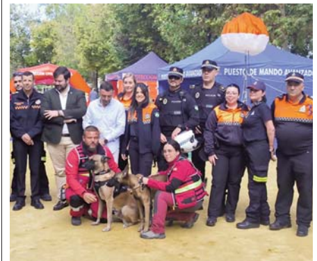
Inauguración de las jornadas VIVA

Los visitantes que buscaban un entendimiento más profundo y detallado de la exhibición tuvieron la oportunidad de participar en visitas guiadas. Estas visitas, lideradas por profesionales de ambos cuerpos, proporcionaron perspectivas enriquecedoras