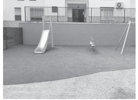
Nuevo parque en la barriada. VIVA

A principios de año, el equipo de Gobierno licitó por cerca de 100.000 euros la mejora de cuatro parques en Antequera, pero la inversión en el parque García Prieto ha sido "insatisfactoria, especialmente considerando las necesidades de las familias, ha manifestado el líder socialista, quien ha criticado a su vez el hecho de