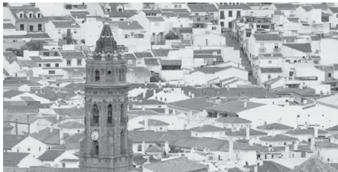
Ciudad de Antequera. VIVA

El último perjudicado fue una pareja que también perdió la fianza de 375 euros con el pretexto de que el propietario estaba hospitalizado. No satisfecho con ello, el actualmente condenado les propuso una vivienda "mejor", pero la dirección que les proporcionó les llevó a una iglesia, perdiendo así una vez más la cantidad de 600 euros que habían adelantado.