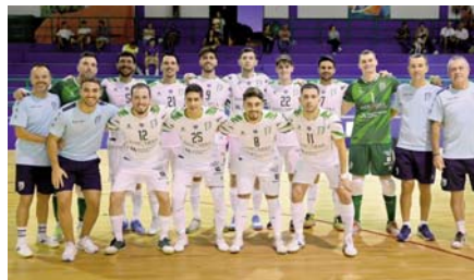
Equipo del UMA antes del partido. VIVA

El próximo partido será a finales de noviembre contra el Valdepeñas en el Argüelles.