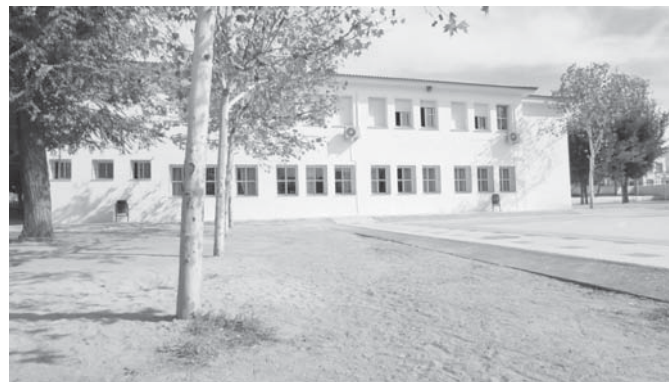
CEIP Miguel berrocal . VVA

Asimismo, a través del Programa de Educación Inclusiva, se acaba de asignar un refuerzo de un total de cinco horas a la semana de un profesional de Audición y Lenguaje”.