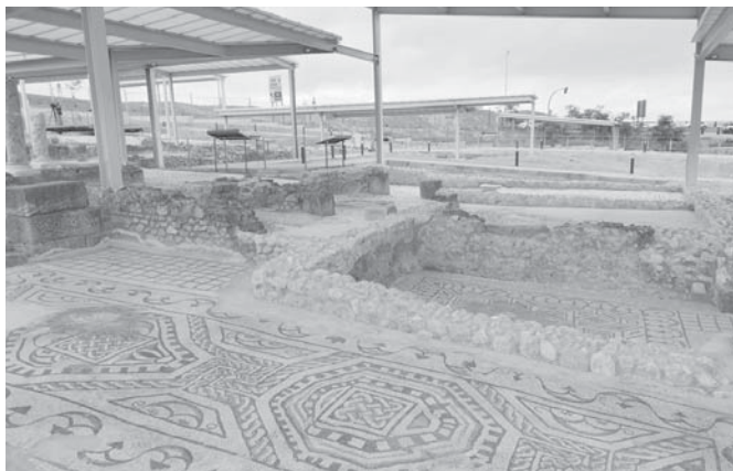
Vista de la villa romana de Antequera. VIVA

De esta forma, Antequera completa la pieza del puzzle que le faltaba en su historia al sumar un nuevo recurso patrimonial y cultural de primer nivel y con características únicas en la península que completa su rica oferta turística junto a los Dólmenes, la Alcazaba o la