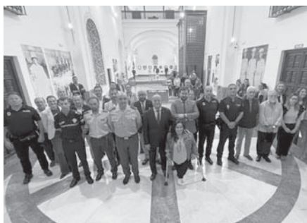
Inauguración exposición VIVA

El visitante puede encontrar así desde fotografías históricas a gran formato hasta utensilios utilizados, así como una cuidada selección de documentos de carácter histórico que se conservan hoy en día en el Archivo Histórico Municipal. El objetivo de la misma es el de hacer más visible a la Policía Local más allá de las habituales conmemoraciones en torno al día de su patrón a finales de septiembre, ofreciendo así una buena oportunidad para