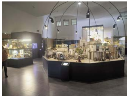
Museo de Belenes de Molina. VIVA

Inaugurado en noviembre de 2017 y ubicado en el Polígono Casería del Rey de Molina, el Museo Internacional de Arte Belenista cuenta también con un patio exterior donde se encuentran expuestas estancias de una casa popular andaluza de la primera mitad del siglo XX, así como maquinaria agrícola y una almazara de aceite empleada en esa época.