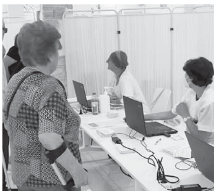
Presentación de la campaña. VIVA

Hasta el 31 de enero, todas las personas que acudan hasta la biblioteca para vacunarse de estas enfermedades recibirán de forma gratuita un libro a elegir en