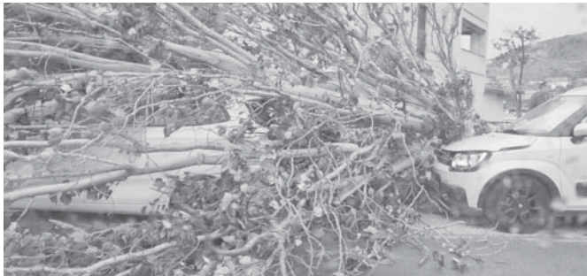
Incidencias del temporal ayer. VIVA