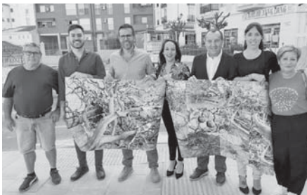
Socialistas enseñando fotos de los naranjos arrancados. VIVA

El socialista ha argumentado que los árboles deberían haber sido retirados con cuidado para poder ser replantados tras las obras. Además, Calderón mostró su desacuerdo con el proyecto de colocación de palmeras