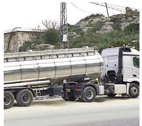
Camiones cisterna en el Valle de Abdalajís.

Según Márquez, la solución pasaría por una tubería desde Antequera, Aguas de Verdiales o los embalses. Una actuación que tendría un coste de unos tres millones de euros y pondría fin al “suplicio del pueblo y sus 2.500 habitantes”, apostilló, afirmando que con esta medida “se dejaría de tirar el dinero en camiones cisterna, como se ha estado haciendo en los últimos años, que es una opción insostenible e insatisfactoria”, dijo en un comunicado recientemente la institución.