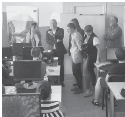
Uno de los cursos de formación.

“Desde el Ayuntamiento de Antequera estamos siem-