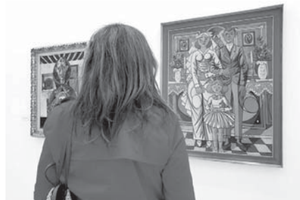
Mujer visitando la exposición VIVA

Zabaleta (1907-1960) es uno de los pintores más interesantes del realismo expresionista español. Se expone en la provincia de Málaga por expreso deseo de la familia en el marco del Año Picasso que se celebra con motivo del cincuenta aniversario del fallecimiento del pintor malagueño.