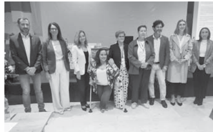
Inauguración de las jornadas VIVA

Estas jornadas estuvieron destinadas tanto a profesionales como a estudiantes de Grado de Psicología, Educación Social, Ciencias de la Salud, Nutrición humana y Dietética, así como de Grados superiores de Dietética e Integración Social.