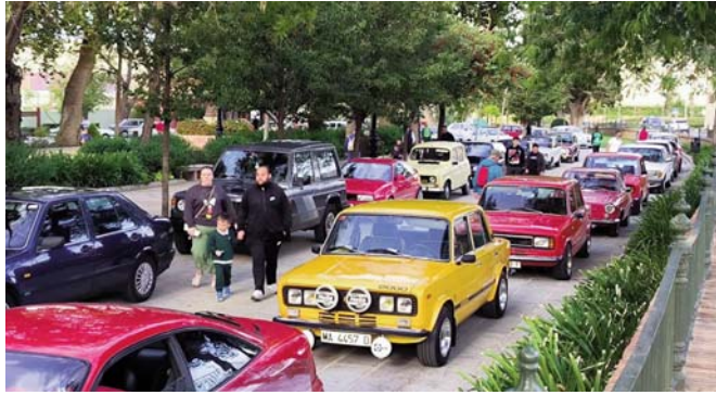
Concentración en el Paseo Real VIVA

En esta ocasión los participantes se reunieron directamente en el Paseo Real de Antequera, donde se les hizo entrega de los dorsales tras comprobar la documentación. Después de más de una hora de exposición de