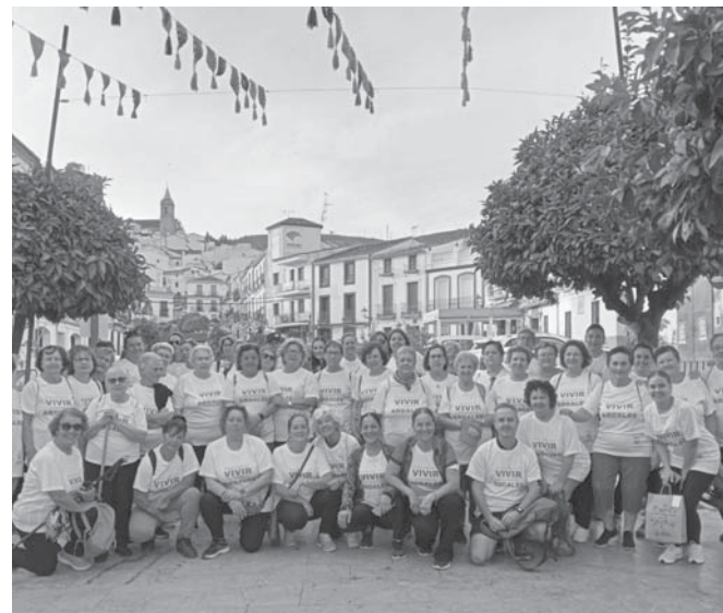
Jornada de convivencia por el Día de la Mujer Rural en Ardales. VIVA

Las pedanías de las zona norte (Bobadilla, Colonia Santa Ana, Cañadas de Pareja, Los Llanos de Antequera y Cartajal) pudieron disfrutar de esta iniciativa el pasado 10 de octubre, mientras que las pedanías de la zona sur (La Higuera, La Joya, Los Nogales, Las Lagunillas, Puerto El Barco y Villanueva de Cauche) lo hicieron el martes 17 de octubre.