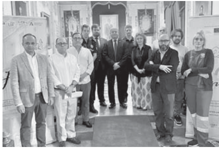
Presentación del simulacro. VIVA

Se simulará el caso de edificios afectados por un movimiento sísmico y posterior incendio, teniendo que evacuar a sus ocupantes y rescatar a los heridos, así como posteriormente realizar el rescate de las obras de arte, como ejercicio de protección del patrimonio, comprobando así la activación del Plan de Emergencias Municipal con su Plan de Actuación Local de Riesgo Sísmico. En esta actividad