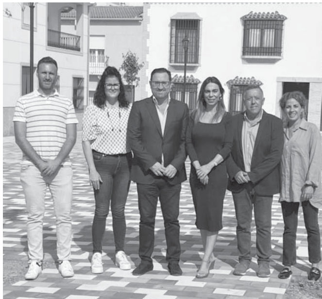
Durante la visita de la Delegada a Sierra de Yeguas. VIVA

Así, desde la Junta de Andalucía vuelven a mostrar su interés por los municipios del interior de la provincia de Málaga, como es el caso de Sierra de Yeguas, potenciando ayudas para favorecer actuaciones en la localidad, que ahora se consolidan con los 350.000 euros que se han destinado a la localidad en los últimos tres años y que han permitido ejecutar obras de importante nivel.