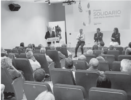
Entrega de premios. VIVA