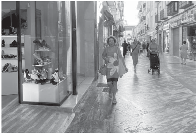
Calle Duranes en el Centro Comercial Abierto VIVA

Está previsto que dicha campaña se pueda visualizar y escuchar desde mediados de este mes y durante noviembre a través de medios escritos y digitales, así