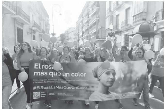
Imagen de la marcha solidaria. VIVA

Para formar la gran marea rosa, La Verónica entregó camisetas solidarias a todas las personas que se unieron a cambio de un donativo voluntario que fue destinado de forma íntegra a la AECC Antequera.