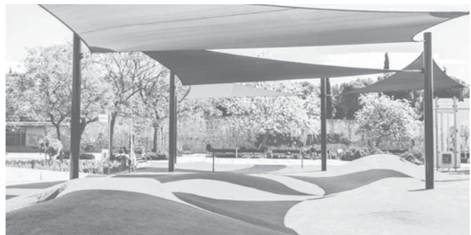
Presentación del sistema en El Romeral.