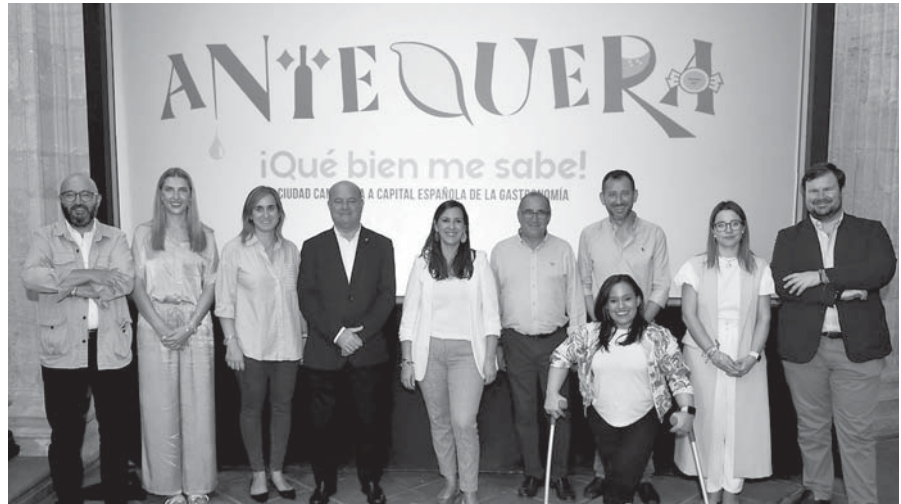
Arranca la campaña promocional. VIVA

Actualmente se está ultimando el informe que se va a remitir antes de que finalice el presente mes para que sirva como base de la candidatura junto a un vídeo promocional que se ha grabado en diversas localizaciones de la ciudad.