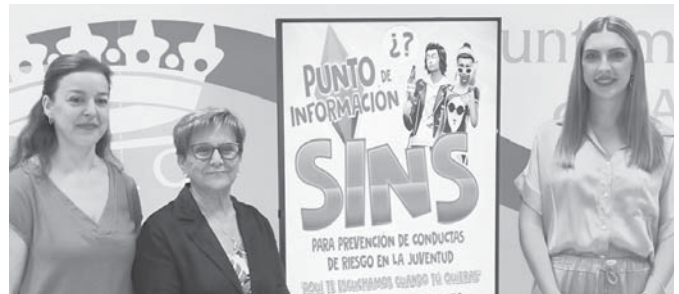
Presentación del punto de información. VIVA

De todos estos temas pueden asesorarse en este nuevo punto de información que nace con el objetivo de seguir trabajando en la prevención de adicciones y otras conductas de riesgo.