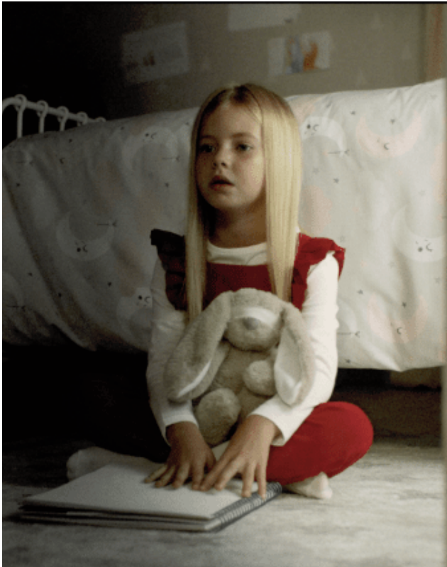
Frgamento del cortometraje 'Alicia'. VIVA

En 2017 rodó 'Black Eyed Child', que se estrenó en Fantasporto y tuvo un gran recorrido por festivales como Screampfest o Sitges, con más de 90 selecciones y 20 premios internacionales. Su siguiente trabajo, 'Abrazitos', tuvo un gran éxito.