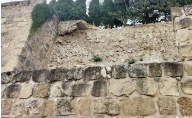
Parte de la muralla desprendida. VIVA

Mientras tanto, el Consistorio ya ha obtenido permiso de la Delegación Territorial de la Consejería de Cultura de la Junta de Andalucía en