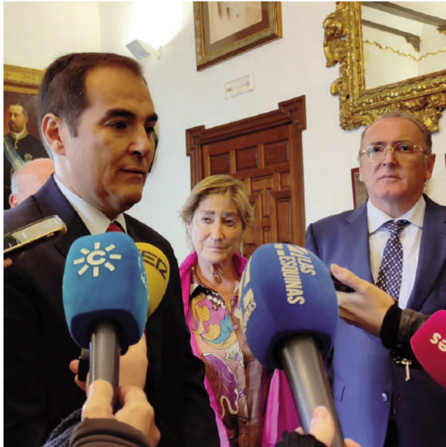
Nueva estación de AVE VIVA