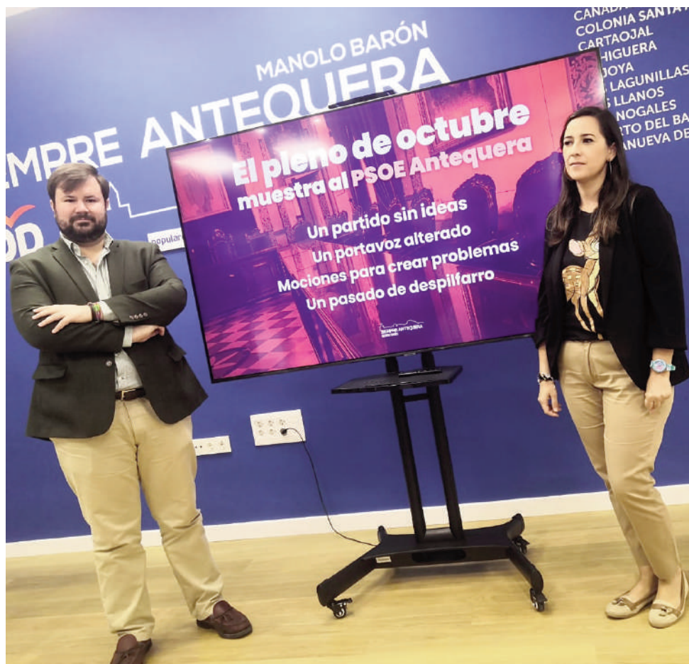
Rueda de prensa del PP.