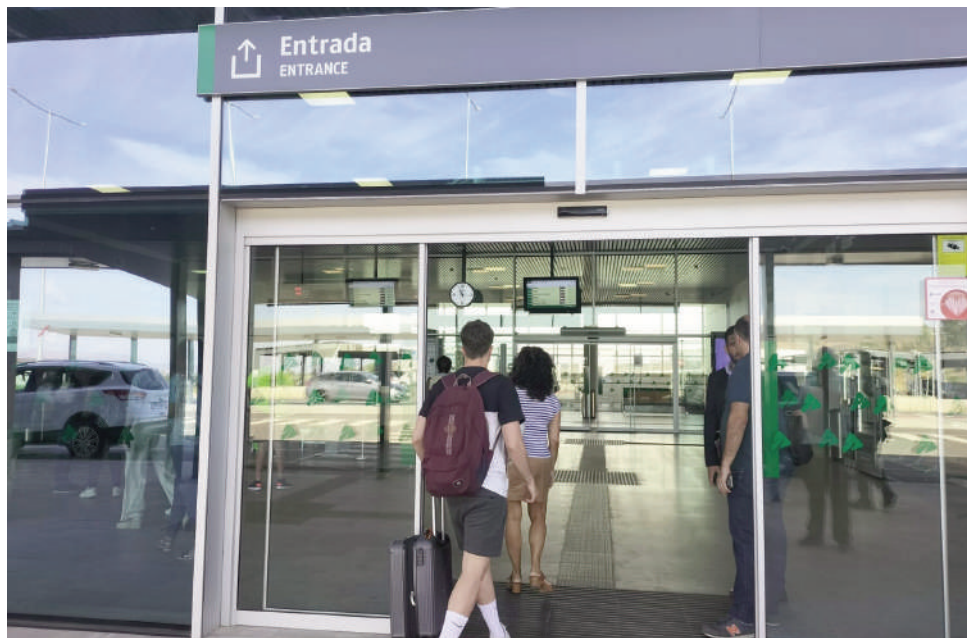
Nueva estación de AVE. VIVA

Por último, Cebrián ha denunciado que se trata de "una problemática de las muchas otras que hemos ido viendo estos meses" con respecto a la nueva estación de AVE. "Desde que entró en