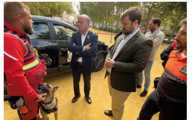
Exposición de Policía y Protección Civil.