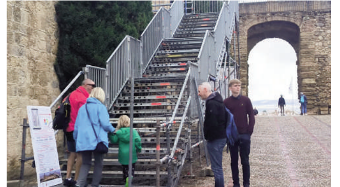
Turistas accediendo a la Alcazaba por las escaleras. VIVA

Una de las principales preocupaciones a la hora de llevar a cabo las obras era permitir que la entrada de visitantes “siguiera en movimiento”. “No podíamos en ningún momento dejar un recinto como es la Colegiata