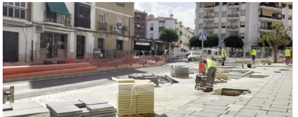
Obras Avenida de La Legión. VIVA

obra se demore un par de meses no creo que sea una cuestión absolutamente llamativa para poner el grito en el cielo. A mí los que no me protestan son los vecinos, solamente el partido socialista. No sé si es que no quiere que arreglemos calles, no quiere que mejoremos los pavimentos o no quiere que hagamos la zona accesible. La obra se va a terminar, se va a quedar estupendamente”.