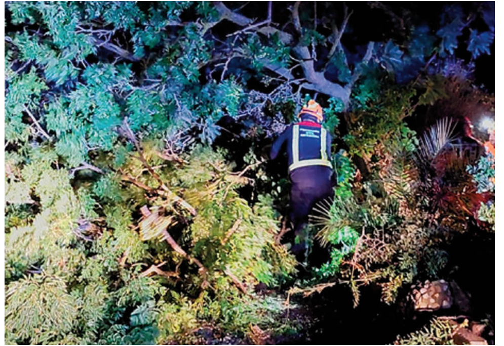
Actuación de los bomberos.

Asimismo, no quedaron muchos contenedores en pie y varias viviendas sufrieron la caída de tejas y muchas persianas quedaron colgando. El viento además dañó señales de circulación, provocando que cayeran letreros y placas solares y se partieron postes con la consiguiente rotura del cableado.