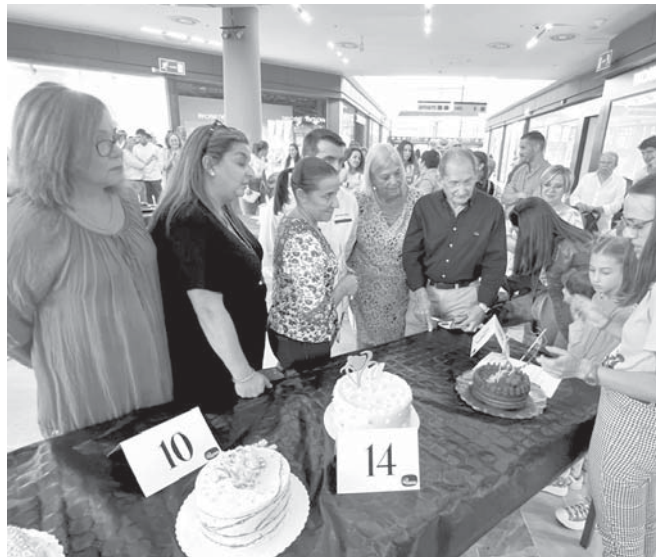
Concurso de tartas. VIVA

Además, la Verónica celebró también su aniversario con una gran fiesta infantil, que tuvo lugar el sábado 23 de septiembre a partir de las seis y media. Se trató de una actividad muy especial preparada para los más pequeños.