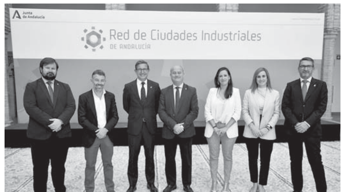
Participación de Antequera en el encuentro. VIVA

El objetivo de la actividad ha sido el de visibilizar el apoyo real a la implantación