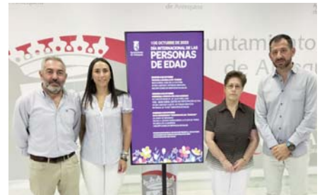
Presentación de la programación. VIVA

Por último, el domingo 8 de octubre se desarrollará la