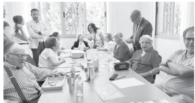
Usuarios en la nueva sede.

Aunque se ha conseguido el objetivo, el camino ha estado lleno de obstáculos y contratiempos. Según ha explicado el regidor, la puesta en funcionamiento del centro ha sido "muy complicada" con infinidad de trabas administrativas en