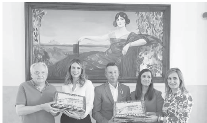
Presentación de la lata conmemorativa.

En el mes de diciembre será el turno de las ediciones especiales limitadas del 'Tronco especial' y del 'Roscón 135 Aniversario', que se podrán degustar en la cafetería antes de su lanzamiento y cuyas fechas serán anunciadas a través de las