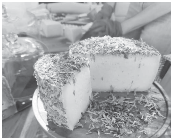
Feria del Queso Teba 2023. VIVA