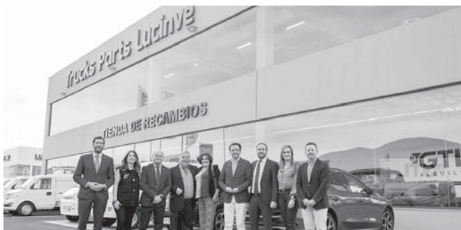
Inauguración de las instalaciones. VIVA

El próximo año iniciarán las obras en la parcela contigua a la inaugurada en el día de hoy en la que se va a invertir 3 millones de euros sobre una parcela de 10.000 metros cuadrados para obtener una nave de 2.500 metros cuadrados. En estas instalaciones se ubicará un concesionario Renault Trucks pasando la plantilla de Veinluc de 11 empleados que tiene actualmente a 18, y se espera que el grupo de