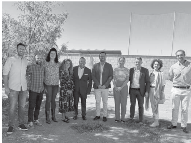
Visita de los diputados a los terrenos.

Además de la propia pista polideportiva cubierta, el proyecto alberga una sala multi-deporte contigua de 400 metros cuadrados y dos pistas de pádel cubiertas.