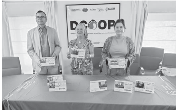
Presentación del calendario. VIVA

“El cáncer es una enfermedad que afecta a toda la sociedad, porque desgraciadamente es muy común y no distingue ni de territorio, ni de raza, ni de sexo, ni de nada. Llevamos muchísimo tiempo colaborando con esta entidad y creemos que estamos ante una iniciativa muy interesante con la que ayudar a recaudar esos fondos para la investigación”, ha concluido.