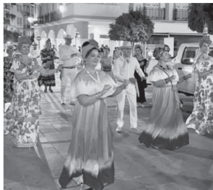
Fiesta de los pueblos. VIVA

Además, a partir de las nueve de la noche, los asistentes pudieron disfrutar de un 'photocall', servicio de bar, un rincón temático cubano y degustar comidas internacionales, como arepas, empanadas, cuscús, y platos típicos de Ucrania, Brasil y Campillos. Durante la semana, se realizaron diversas actividades en los centros educativos de la localidad, entre ellas, un taller flamenco titulado 'Cantes de ida y vuelta. El valor de la interculturalidad' y un taller de percusión y danza.