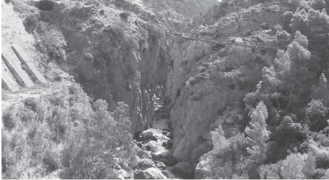
Caminito del Rey. VIVA

Se puede llegar al paraje a través del servicio de Cercanías hasta El Chorro/Caminito del Rey desde las estaciones María Zambrano y Málaga Centro. El Caminito del Rey cuenta con un centro de recepción de visitantes ubicado en el término municipal de Ardales que dispone de aparcamiento con