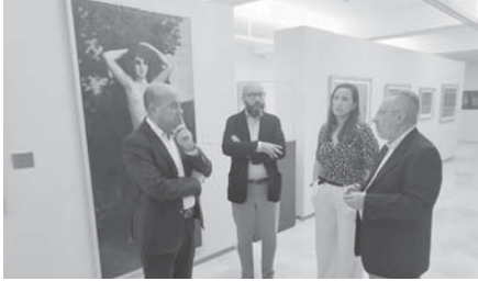
Visita a la sala. VIVA

La obra de Fernández, originalmente ubicada en la segunda planta del edificio, ha sido reorganizada y realizada. Se retiraron piezas del siglo XIX que compartían el espacio con sus creaciones,