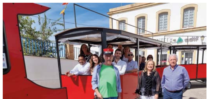
Pasacalles de época. VIVA

dos para la ocasión, desfilaron al ritmo del espectáculo musical 'Princesas Golosinas', ofrecido por la compañía teatro 'La Carpa'. Una de las peculiaridades de esta celebración fue la degustación de 'ollas ferroviarias' en los bares de la localidad, un delicioso plato que se ofreció por el módico precio de 5 euros. La tarde del sábado estuvo marcada por la música y el teatro. A las seis, la Plaza Virgen de los Dolores se llenó con las melodías de la Joven Orquesta Provincial de Málaga (JOPMA).