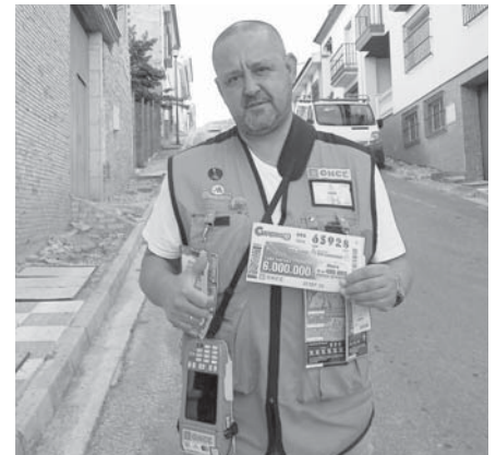
Vendedor de los cupones. VIVA

Por su parte, el Eurojackpot, el mega sorteo europeo que vende en España la ONCE con otros 17 países del espacio económico europeo, ofreció el pasado martes, 26 de septiembre, un bote de 13 millones de euros.