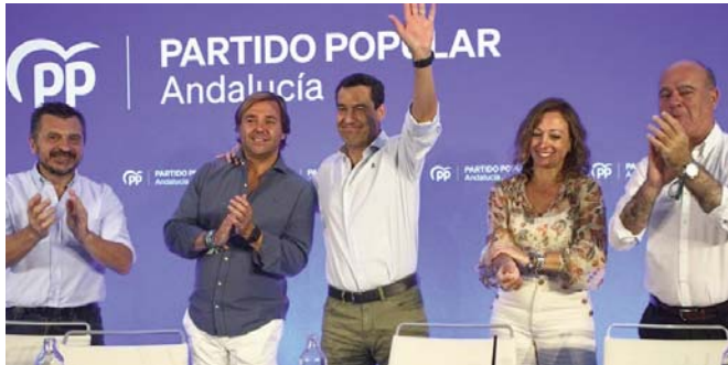
Jornadas parlamentarias PP VIVA

Al respecto, comparó esta situación con el Congreso de los Diputados. "Pedro Sánchez no solo ha incendiado España rompiendo el principio de igualdad, sino que también va a incendiar Cataluña", manifestó, lamentando que el PSOE de Andalucía