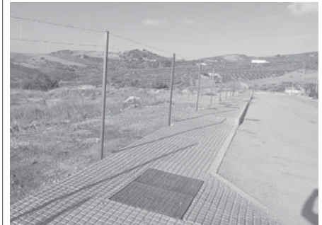
Imagen del polígono industrial.

Se ha concluido ya con esta primera fase y la intención es continuar próximamente con más trabajos.