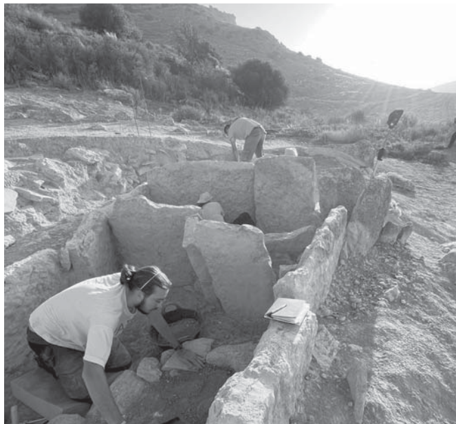
Necrópolis La Lentejuela Teba. VIVA

“La Lentejuela era un conjunto megalítico por explorar y han sido estas investigaciones que el Consistorio ha venido realizando en los últimos tres años las que han motivado que la Junta de Andalucía ponga sobre la mesa que existen evidencias científicas y empíricas que demuestran que existe un conjunto dolménico y megalítico en Teba que requiere la catalogación de Bien de Interés Cultural (BIC) para proceder a su protección y puesta en valor”, ha concluido el primer edil, satisfecho de que al fin este yacimiento se sume al resto de BIC con los que cuenta la localidad del Guadalteba.