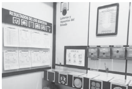
Vista de la administración de lotería. VIVA

Este boleto de Antequera ha sido el único premiado en toda la provincia de Málaga, siendo los siguientes más próximos Cuevas del Campo, Guadix y Jun, localidades de Granada donde también se ha vendido el cupón.