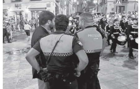
Protección Civil vigilando en una procesión.

senta la aplicación es la disponibilidad de un mapa con todos los hidrantes del municipio, sus características y el estado de los mismos. Desde el apartado de archivos, se pueden subir fichas de los voluntarios y toda la información necesaria para el desarrollo de su actividad. La aplicación también permite tener un inventario exhaustivo de todo el material que componen las diferentes secciones que forman una agrupación de voluntarios y permite dar de alta o de baja material de nueva adquisición o material que esté en desuso y no pueda ser utilizado de nuevo.