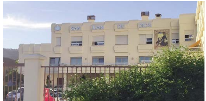
Residencia de San Juan de Dios. VIVA

Uno de los principales objetivos de la residencia, es que los usuarios que quieran y puedan, participen en "la vida" de la ciudad. "Se trata también de que no estén segregados de la sociedad. Son gente de Antequera y pueden seguir haciendo su vida de relaciones y de amistad como lo han venido hacien-