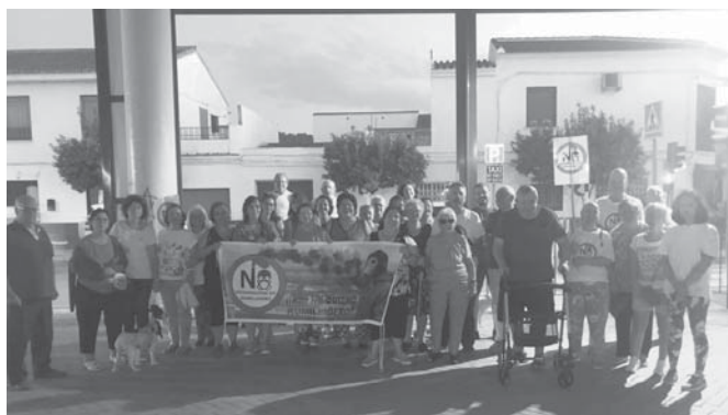
Plataforma ciudadana. VIVA

otros colaboradores por su oposición al proyecto. De hecho, la plataforma ciudadana ha recibido el apoyo de organizaciones ecologistas y ciudadanos, realizando reuniones, marchas y recogiendo más de 4.000 firmas en contra de la incineradora. A pesar de esta 'victoria', la plataforma permanecerá activa- se concentrarán el último miércoles de cada mes- y vigilante de futuros proyectos industriales en Humilladero para garantizar el cumplimiento de normativas medioambientales, y por consiguiente, la salud de los ciudadanos del pueblo.