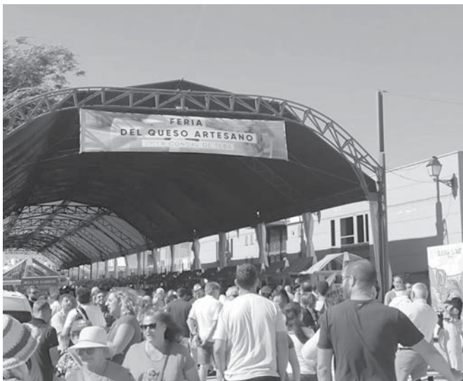
Feria del Queso Teba 2023. VIVA

queso de verdad y el nuestro es todavía más complicado de conseguir porque la mayor parte se queda en Mallorca, que es donde más se vende. Por eso estas ferias son importantísimas para dar a conocer el queso artesano y el quesero de verdad”, concluye.