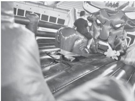
Gran Prix. VIVA

Con un repertorio de actividades que iban desde un toro mecánico hasta una emocionante tirolesa, pasando por un circuito de bolas locas y carreras de goma elástica, los participantes, agrupados en equipos, demostraron su destreza, rapidez y fuerza en cada desafío. La emblemática 'vaquilla'