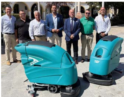
Presentación de las máquinas. VIVA

Esta nueva solución de limpieza de suelos incorpora la última tecnología del sector con un nuevo sistema de control digital claro y simple para operar que permite ex-