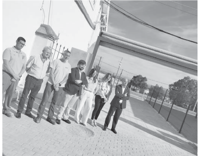
Apertura de la puerta del paso subterráneo. VIVA

El Ayuntamiento ya está trabajando para hacer llegar hasta allí la fibra óptica de cara al futuro intercambiador de transportes, el próximo gran proyecto que ejecutará la Junta de Andalucía con acuerdo del Ayuntamiento de Antequera y Adif, del que están esperando la cesión de los terrenos.