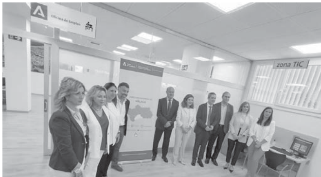
En las nuevas dependencias de empleo. VIVA

A su vez, Carnero señaló ya se han destinado 3,6 millones de euros para la mejora de oficinas de empleo en las dependencias de San Pedro de Alcántara, Marbella, Estepona, Benalmádena, Málaga-El Palo y Torrox, incluyendo ésta de Antequera. "Esta actuación permitirá mejorar el servicio a la ciudadanía y las condiciones laborales y los espacios en los que desarrollan su labor los empleados públicos", subrayó, destacando que "los 11 empleados públicos del SEPE en la oficina atienden una media mensual de 1.200 citas y en agosto, en concreto, la Oficina de Antequera ha alcanzado a 4.769 beneficiarios de