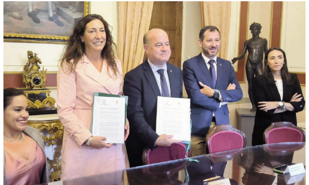
Firma del convenio. VIVA

Por otro lado, Antequera se ha sumado al Plan Corresponsable de la Junta de Andalucía. En concreto, en la provincia de Málaga se han adherido 16 ayuntamientos y la institución provincial, contando con un total de 4,6 millones de euros. Además de en Antequera, en esta jornada se ha procedido a la entrega de las resoluciones a la Diputación Provincial, el Ayuntamiento de Málaga, Alhaurín de la Torre, Coín, Estepona, Fuengirola, Benalmádena, Cártama, Nerja, Torremolinos y Rincón de la Victoria. El Plan Corresponsable 2023, dotado con 31,6 millones procedentes de una