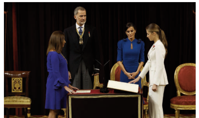
Imagen del acto.

Por último, el regidor ordenó la colocación del repostero de la Jarra de Azucenas, símbolo de la ciudad, en señal de júbilo por este acontecimiento.