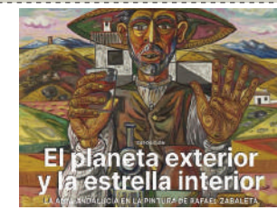
"El planeta exterior y la estrella interior"

El Torcal de Antequera ofrece un amplio número de actividades para disfrutar en familia durante todo el otoño con rutas, senderos y recorridos para todas las edades y destrezas.