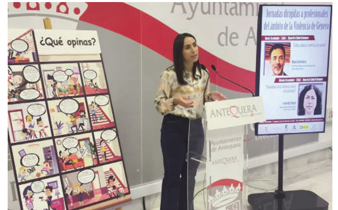
Presentación de la programación en el Ayuntamiento. VIVA

Para hacer más hincapié en la prevención, se trabajará con los centros educativos de secundaria con un proyecto denominado la casa de los micromachismos, con escenas de micromachismos que se experimentan en el día a día. Paralela-