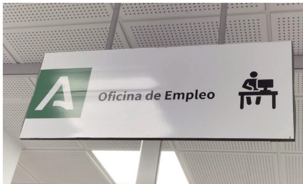
Cartel de la oficina de empleo VIVA

En cuanto a los pueblos de la comarca, este mes se han registrado más descensos