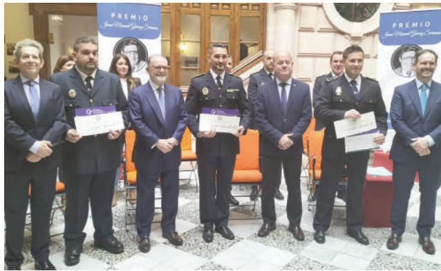
Premiados del año pasado. VIVA

Los ciudadanos podrán presentar su candidatura desde el día 28 de este mes de octubre y hasta el 18 de noviembre mediante un formulario de inscripción a través de la web oficial del premio