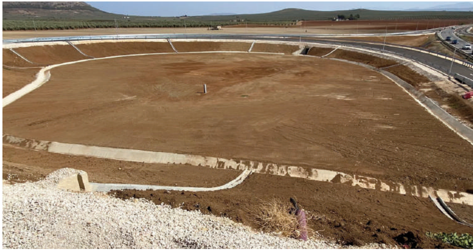
Vista actual del Puerto Seco VIVA

Al respecto, Barón ha destacado el cambio que ha experimentado el nodo logístico en poco tiempo. “Es una barbaridad. Son unos viales kilométricos, unas rotondas espectaculares, unos accesos impresionantes y unas parcelas que van a tener una capacidad de metros cuadrados para la implantación de empresas”, ha detallado, al tiempo que ha asegurado