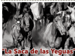
"La Saca de las Yeguas"