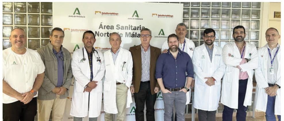
Equipo médico del hospital. VIVA

El retraso en la detección del VIH es un serio problema, ya que un diagnóstico tardío provoca retrasos en el inicio del tratamiento.