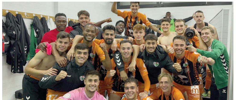
Celebrando la victoria. VIVA

De esta forma, el Antequera CF disputará la siguiente ronda con un equipo de Primera o Segunda División. El sorteo se realizará el martes 7 de noviembre.