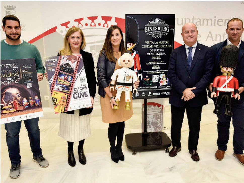
Presentación de las exposiciones. VIVA

ANTEQUERA 'Antequera en un click' incluye tres exposiciones