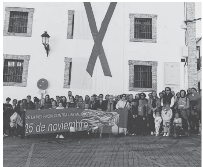
Durante la celebración del acto VIVA

Las actividades fueron organizadas por el Ayuntamiento de Cañete la Real con la colaboración de las Asociaciones de Mujeres Yerma y Albacara. Desde el Ayuntamiento se ha agradecido la participación e implicación de ciudadanos y colectivos.