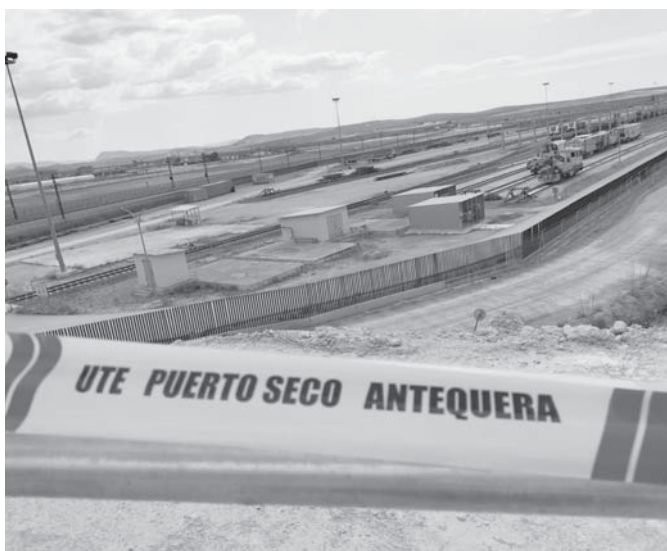
Puerto Seco. VIVA

ANTEQUERA Jornada organizada por Diario SUR