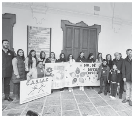
Acto en el Ayuntamiento.

Antes de la lectura del escrito, el regidor saludó a todos los presentes “en esta gran fiesta por la integración, en la que recordamos que todos somos iguales independientemente que unos tengamos unas capacidades diferentes a las de otros”, manifestó el primer edil. “Estamos encantados de que Antequera sea una ciu-