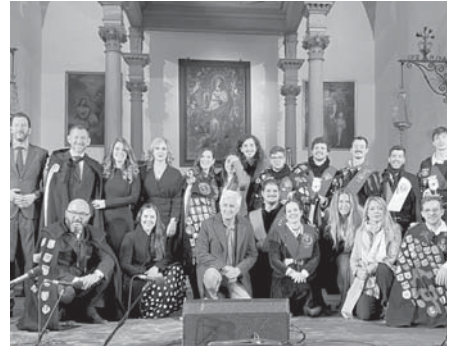
Certamen de Tunos. VIVA

Ya el sábado a las tres y media se desarrolló el gran espectáculo de tunas en la Real Colegiata de Santa María la Mayor, resultando ganadora la Tuna de Peritos e Informática de Madrid. La actividad fue presentada es-