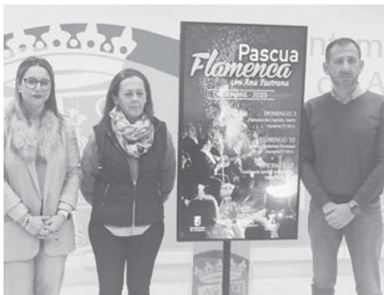
Presentación del cartel. VIVA

En cada una de ellas participarán todos los barrios, haciendo una promoción del flamenco e incentivando la importancia de este arte que será, una vez más, protago-