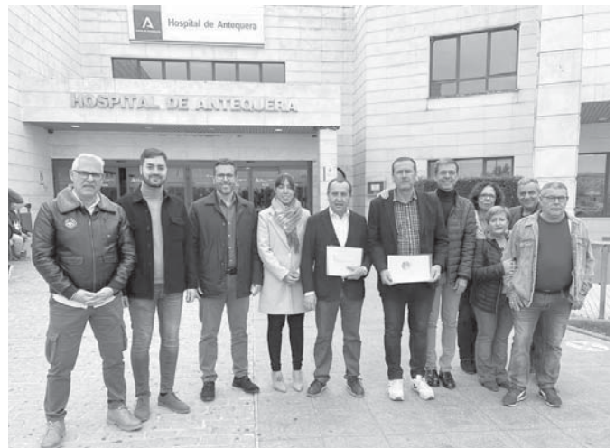
Psoe en la puerta del Hospital comarcal. VIVA

De esta forma, en Traumatología y Cirugía ortopédica, tal y como apuntan los socialistas, son 1219 pacientes los que están en lista de espera, de los que 309 de ellos llevan más de dos meses en la misma, y habiendo aumentado esta en 200 personas. “En el caso de Urología, son 240 pacientes, de los que 122 llevan en lista de espera más de dos meses. En lo que se refiere al aparato digestivo, son 357 pacientes los que esperan a ser atendidos, 78 de ellos desde hace más de dos meses. Cirugía General y Digestivo cierra el primer semestre del año con 466 pacientes en lista de espera, 109 más que