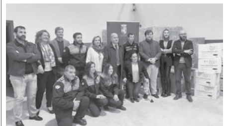
Entrega del material. VIVA

Además, se está planteando la idea de poder hacer llegar también este material a las residencias de mayores. “La inmunidad de rebaño parece que ya está adquirida, pero tenemos que seguir adoptando medidas preventivas para evitar contagios, no solo de la Covid, sino de cualquier otro virus o enfermedad contagiosa”, explicó la responsable.