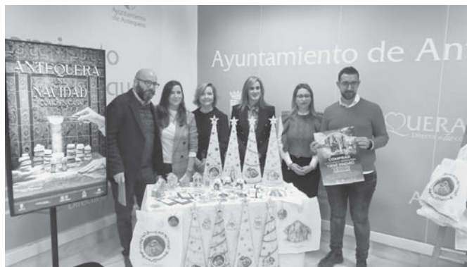
Presentación de la campaña. VIVA

Asimismo, se han publicado 3.000 programas de mano