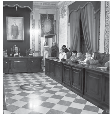
Pleno infantil. VIVA

Por su parte, los interventores del Reina Sofía hicieron hincapié en conflictos que asolan actualmente al mundo, como el de Ucrania o el de la Franja de Gaza. "Hoy, venimos a hablar sobre el derecho que tenemos los niños y niñas a vivir en paz. Sabemos que en la actualidad, en diferentes lugares del mundo, desgraciadamente hay guerras, conflictos, sin ir más lejos, en Ucrania, en la Franja de Gaza, en África".