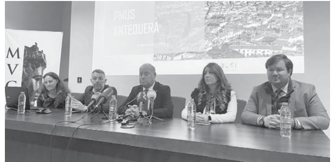
Plan de movilidad en el MVCA. VIVA

El alcalde confirmó que este plan se integra con el resto