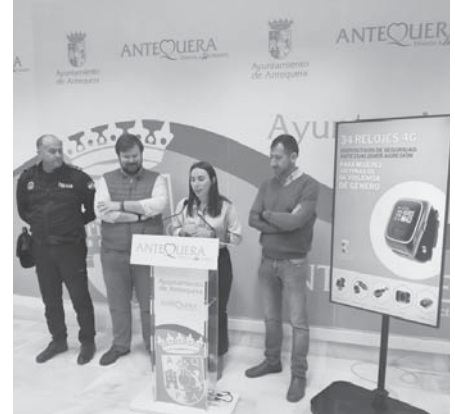
Rueda de prensa dando a conocer la iniciativa.