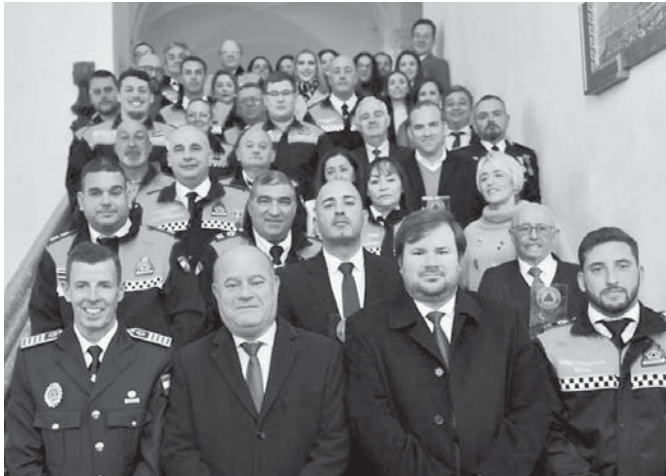
La corporación municipal con el cuerpo de voluntarios. VIVA

ANTEQUERA | El Ayuntamiento de Antequera ha conmemorado por primera vez la festividad del patrón de los voluntarios de Protección Civil, San Francisco Javier, con un acto de entrega de distinciones al mérito y los galardones específicos por la constancia en el servicio.