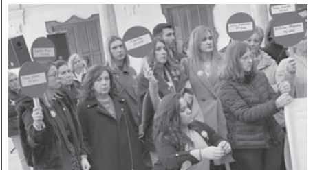
Acto en el patio del Ayuntamiento. VIVA

Esta vocación, tal y como han trasladado, se convierte en una prioridad totalmente necesaria que debe adoptar la administración local así como la ciudadanía para conseguir la erradicación de esta lacra.