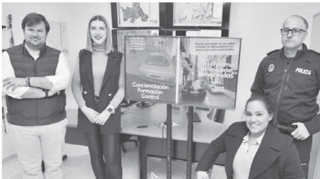
Presentación de las medidas en rueda de prensa. VIVA

En principio se utilizará por la zona centro, en calles como Mercialles, Laguna, Cantareros, Infante Don Fernando o Calzada donde hay más tránsito y menos aparcamiento. La idea es que el uso de este dispositivo tenga