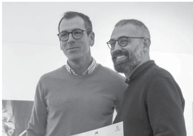
El presidente de la Comunidad junto con el ganador. VIVA

Igualmente, se ha llevado a cabo la entrega de premios del III Certamen Escolar de Pintura Ciudad de Antequera en el que han participado 910 alumnos de 17 centros educativos de Antequera y sus anejos, en cuatro categorías, de 9 a 10 años, de 11 a 12 años, de 13 a 14 años y de 15 a 17 años, con dos premios en cada categoría. Estas obras serán expuestas en dos sitios: en el patio de columnas del Edificio San Juan de Dios y en el patio de columnas de la Biblioteca San Zoilo, donde se ubica la Pinacoteca Andaluza Ciudad de Antequera, entre los días 2 de diciembre y 7 de enero de 2024.