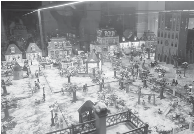
Exposición Binesburg. VIVA

ANTEQUERA La calle Infante Don Fernando vuelve a brillar con especial protagonismo, acaparando la mirada de vecinos y visitantes