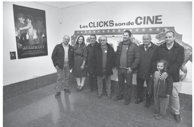
Carteles de películas de cine protagonizados por Playmobil. VIVA