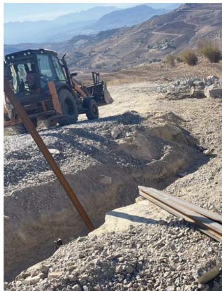
Trabajos de drenaje.