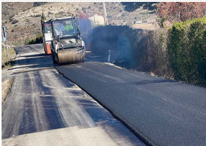
Labores de asfalto. VIVA

ANTEQUERA Nuevo asfalto en siete puntos concretos