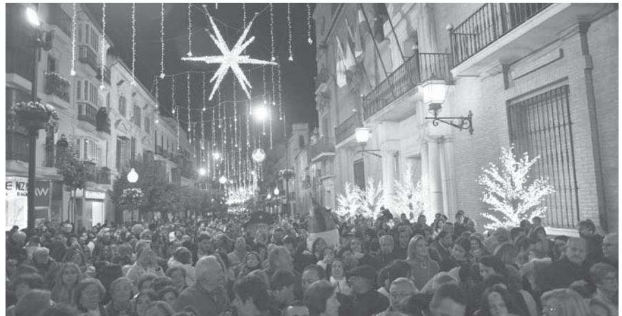
Alumbrado calle Infante. VIVA

Esta exposición tiene un precio de 4 euros para los adultos, de 2 para los niños y gratuita para los menores de 5 años. También se han habilitado 600 entradas 'premium' de 15 euros que incluyen un click de la Policía Nacional, un kit de merchandising y un cómic creado para la ocasión.