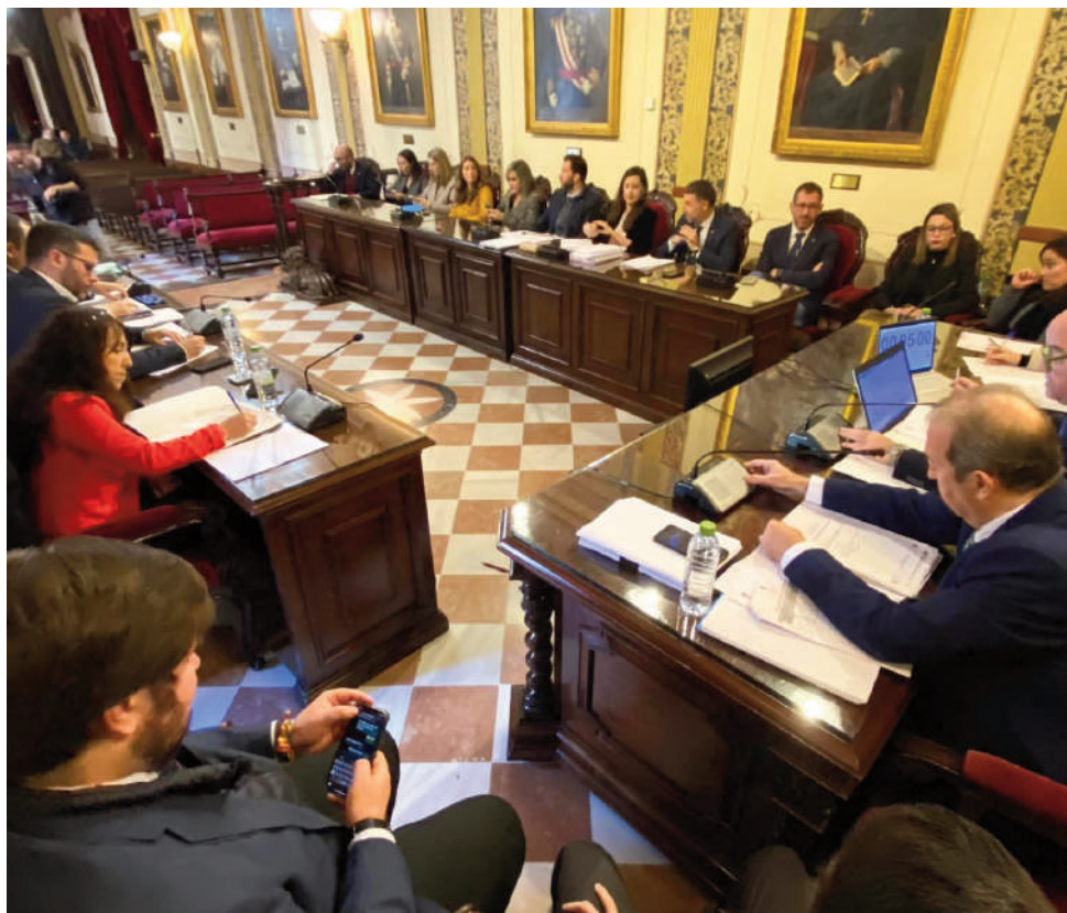
Pleno del mes de diciembre del Ayuntamiento de Antequera. VIVA