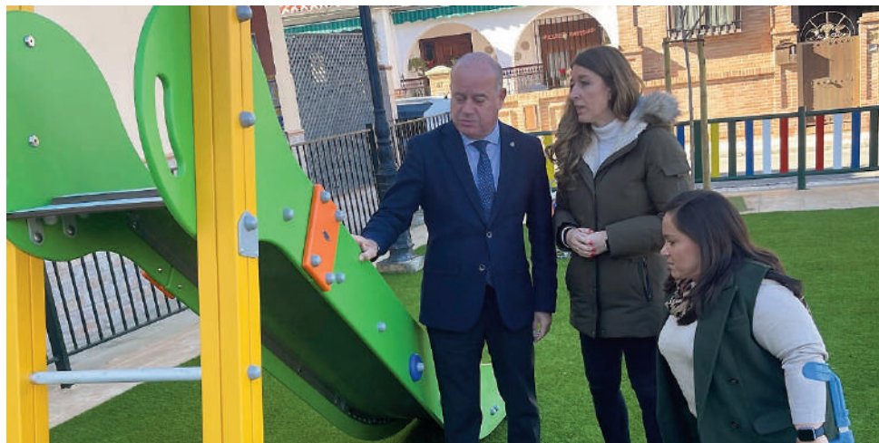
Visita a uno de los parques de Antequera. VIVA

Precisamente, las actuaciones realizadas han estado especialmente dirigidas a la mejora de la seguridad y de la accesibilidad, renovando y actualizando tanto pavimento superficial, como vallados perimetrales y elementos de juego en sí,