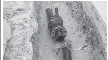
Obras en Fuente de Piedra VIVA

"Con la red de agua nueva en estas calles, evitamos averías y fugas, lo que nos permite optimizar al máximo los pocos recursos hídricos existentes", han manifestado desde el Consistorio.