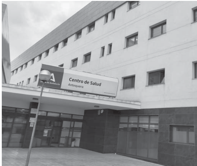
Puerta del centro de salud. VIVA

El Colegio ofrece atención y asesoramiento gratuito a los profesionales que han sido víctimas de agresiones físicas y verbales en el ejercicio de su profesión.