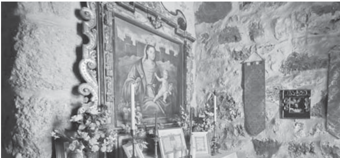
Ermita y altar de la Virgen VIVA