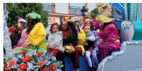
Cabalgatas de Archidona viva

COMARCA Esta cifra global se ha alcanzado tras los cerca de 30.000 visitantes que este año han acudido al centro cultural