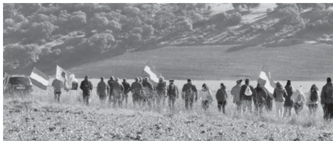
Marcha del año pasado. VIVA

El acto cuenta con el respaldo del Ayuntamiento de Alcalá del Valle, Cuevas del Becerro, Cañete la Real, El Burgo, Serrato y Teba. Asimismo, cooperan la Asociación Socio Cultural La Desbandá, el Partido Comunista de Arriate y Cañete la Real; la Asociación de Memoria Histórica del mismo pueblo y de Setenil de las Bodegas.