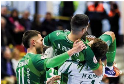
Celebrando la victoria. VIVA

Tres puntos que refuerzan el liderato y distancia a seis a Wanapix Sala 10 Zaragoza y a nueve a su primer oponente del 2024. El próximo sábado 20 de enero, a las cinco, recibirá al Oleoinnova Mengíbar FS en el estreno de la segunda vuelta del campeonato.