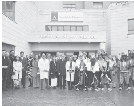
Visita de los Reyes Magos al hospital Comarcal de Antequera. VIVA

Tras su estancia en el complejo sanitario, los tres reyes emprendieron su camino hasta el centro de Antequera, concretamente al Ayuntamiento, para volver a saludar desde el balcón a todos los niños y vecinos del municipio.