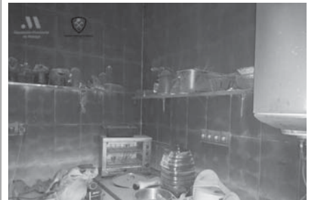
Cocina calcinada. VIVA

El aviso al 112 Andalucía tuvo lugar en torno a las once y media de la noche. Rápidamente se movilizó a los bomberos, a la Guardia Civil, a la Policía Local y los servicios sanitarios, que atendieron a una mujer por inhalación de humo.