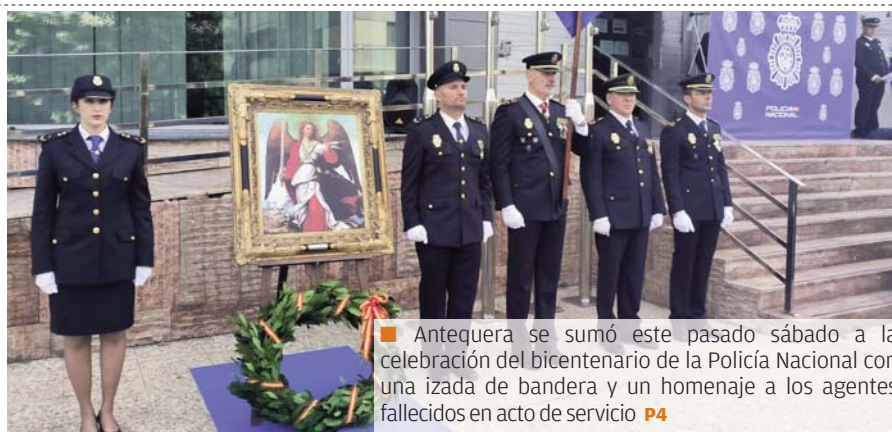
Antequera se sumó este pasado sábado a la celebración del bicentenario de la Policía Nacional con una izada de bandera y un homenaje a los agentes fallecidos en acto de servicio P4