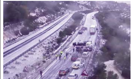
Momento del suceso.

Además, debido al accidente, la vía permaneció cortada buena parte de la mañana, estableciéndose un itinerario alternativo por la A-92M, donde en el kilómetro 4 también se produjo un segundo siniestro a la altura de la pedanía archidonesa de Salinas.