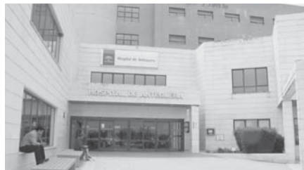
Puerta del Hospital VIVA