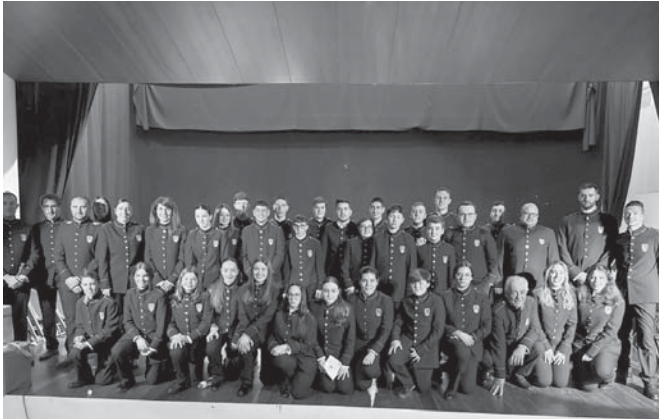
Presentación de los trajes VIVA

Archidona dio así la bienvenida al nuevo año con música. El auditorio, que completó su capacidad, se inundó de emoción y armonía gracias a la ejecución magistral de un extenso programa musical preparado para la ocasión. Entre las piezas interpretadas se en-