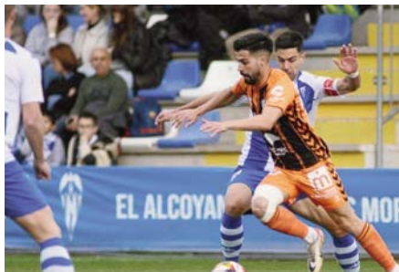
Antequera contra Alcoyano.