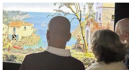
Visitantes del museo viva

el museo se vio obligado a cerrar sus puertas durante buena parte del 2020 debido a la pandemia del coronavirus, lo que también frenó la presencia de turistas. Esta cifra global se ha alcanzado tras los 27.854 visitantes que han llegado a lo largo del histórico 2023, en el que se ha cumplido el octavo centenario de la primera recreación del nacimiento de Jesús de Nazaret por parte de San Francisco de Asís.