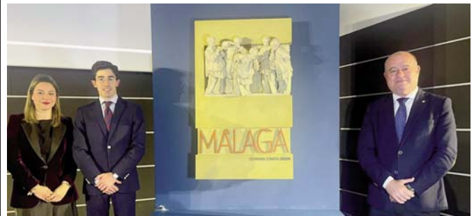
Sarmiento junto con el cartel acompañado por Melero y Barón. VIVA

Durante el acto intervinieron el presidente de la Diputación, Francisco Salado; la consejera de Economía, Carolina España y el alcalde de Málaga, Paco de la Torre.