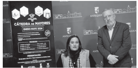
Presentación del programa. VIVA

El proceso de preinscripción terminó el pasado 11 de enero. Las personas admitidas deberán inscribirse en la sede de Loaza abonando una cuota de 20 euros hasta el día 16 de enero.