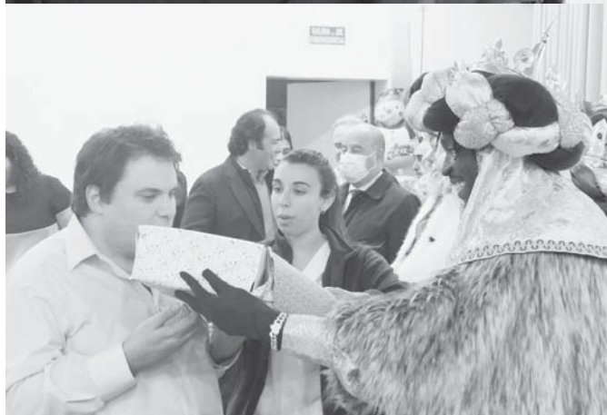
Reyes Magos visitando las residencias y ADIPA. VIVA

ANTEQUERA Recogió las cartas de los niños