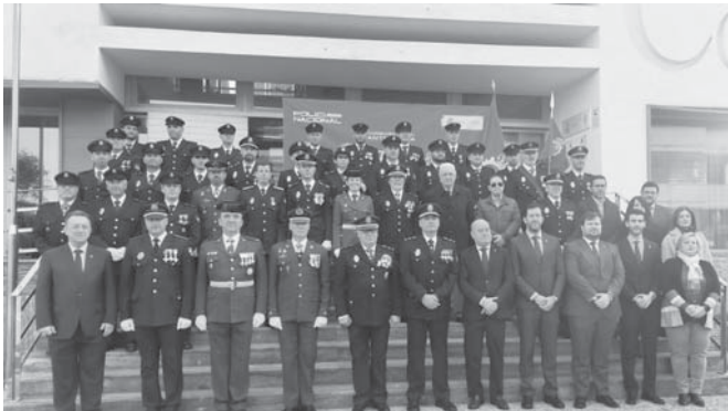
Acto Bicentenario Policía Nacional. VIVA

La celebración consistió en el izado de la bandera nacional, un emotivo homenaje a todos los policías fallecidos en acto de servicio con