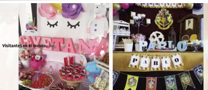
Visitantes en el museo viva