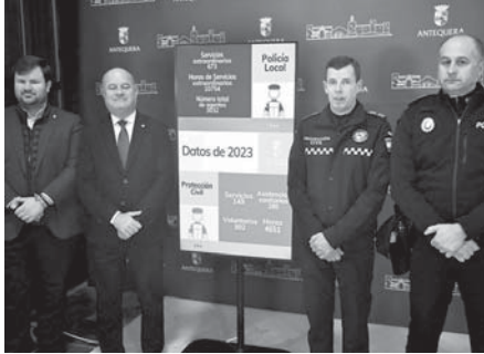
Presentación de los datos. VIVA

Algunas de las actuaciones más reseñables del 2023 fueron la atención a los pasajeros de RENFE afectados por