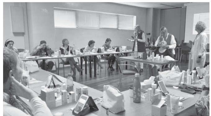
En una de las sesiones de la Escuela de Salud. VIVA

especializado a quienes asumen la responsabilidad de cuidar a familiares dependientes. Este programa busca dotar a los cuidadores de habilidades clave para mejorar su calidad de vida y la de sus seres queridos, evitando el aislamiento social y previniendo trastornos emocionales. La primera edición de este curso ha ofrecido cuatro sesiones intensivas que han abordado temas como el apoyo psicosocial, la gestión de emociones, manejo del estrés, alimentación, actividad física, higiene postural, y movilización de pacientes. Esta iniciativa ha proporcionado un espacio de diálogo y apoyo comunitario, evidenciando la importancia del bienestar emocional y físico de los cuidadores. Con este nuevo paso, el ASN refuerza su visión de una atención sanitaria