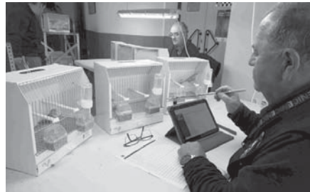
Jurado evaluando los canarios. VIVA

El concurso establece puntuaciones mínimas en diversas categorías, incluyendo color, fauna europea mutada e híbridos, y postura.