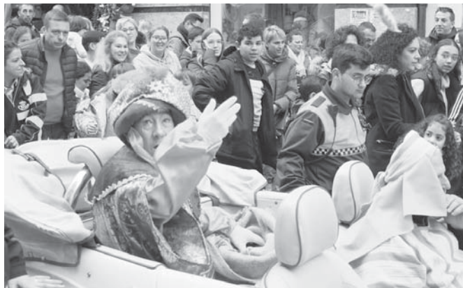
Paso del heraldo real por Antequera. VIVA