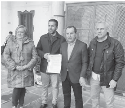
El PSOE en rueda de prensa. VIVA

ANTEQUERA | El PSOE de Antequera se ha mostrado crítico con la pérdida de hasta cinco subvenciones en los últimos meses y ha instado al Partido Popular de Antequera a solicitar a la Junta una ayuda para la construcción de centros residenciales y así poder llevar a cabo la residencia pública en el antiguo hospital de San Juan de Dios.