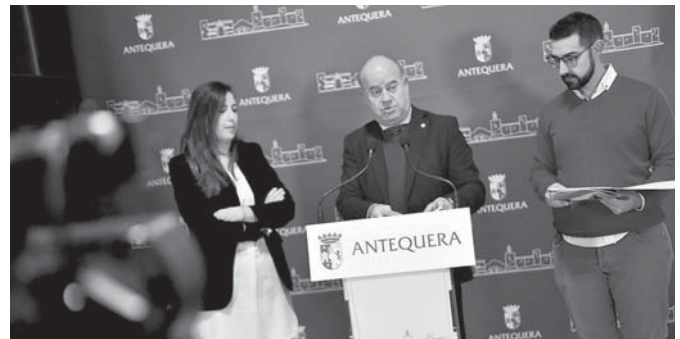
Balance campaña comercial de Navidad ante los medios de comunicación. VIVA