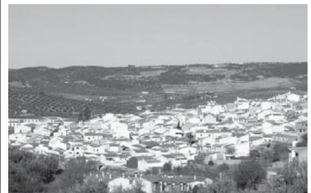
Villanueva del Rosario. VIVA

La capacidad máxima de alumnado en los cursos será de 15 personas y para participar en el programa, como persona candidata, además de cumplir los requisitos a la fecha de preselección por parte del Servicio Andaluz de Empleo, se tendrá que adoptar la fecha de formalización del contrato de formación y aprendizaje.