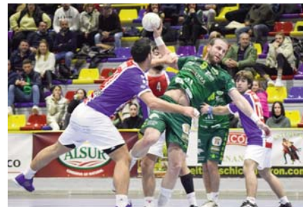
Momento del partido.

mienzo dubitativo tanto en defensa como en ataque ante un equipo que venía con hambre de victoria y muy poco que perder. A pesar de las malas sensaciones, el marcador se fue igualado al descanso 11-11, pero en el segundo tiempo todo fue a peor para los locales en lugar de encontrar la reacción. Final de la primera vuelta en octava posición con 15 puntos. El próximo sábado de nuevo partido en casa contra el colista, el Zamora, antes de visitar al Trops Málaga en la capital.