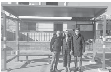
Nueva marquesina en el Rosario VIVA

Esta inversión ha permitido modernizar y mejorar el servicio de transporte de viajeros por carretera, ya que algunas de estas paradas o carecían de marquesinas o sus instalacio-