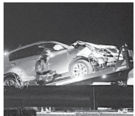
Coche afectado en el accidente. VIVA

El carril izquierdo de la vía tuvo que cortarse, mientras el operativo se encargó de retirar los vehículos.