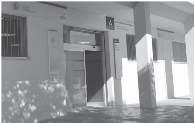
Oficina de empleo VIVA

En cuanto a la comarca, el municipio que ha experi-