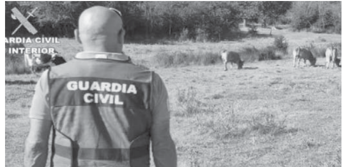
Guardia Civil de Roca foto de archivo. VIVA

Fueron solicitados diversos informes veterinarios a la Junta de Andalucía que certificaron las irregularidades cometidas por el veterinario que llevó a efecto el reconocimiento de los animales, tanto en la extracción de los microchips como en la consignación en las nuevas cartillas de unas edades que diferían notablemente de las reales. Por ello fue investigado el facultativo por el delito de falsedad documen-