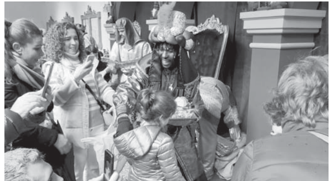
Llegada de los Reyes Magos al Ayuntamiento. VIVA

ANTEQUERA Ilusión entre los usuarios que, por sus circunstancias, tuvieron que pasar la noche más mágica del año en el centro hospitalario