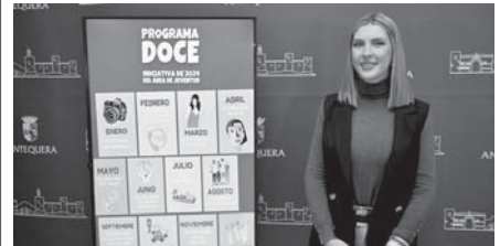
Presentación del programa. VIVA

la Mujer; abril al Día Mundial del Arte y mayo al Día Mundial del Juego. También se volverá a incidir en temas como el medio ambiente, en junio, o el ocio saludable, en julio. El mes de agosto se centrará en el Día Mundial de la Juventud; septiembre, en el Día Mundial de la Prevención del Suicidio; octubre, en el Día Mundial de la Educación Vial; noviembre, en el Día Mundial de las Librerías y diciembre, en el Día Mundial del Voluntariado.