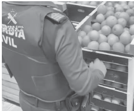
Guardia Civil descubriendo la droga. VIVA

Los detenidos fueron puestos a disposición de la Autoridad Judicial que decretó su ingreso en prisión.