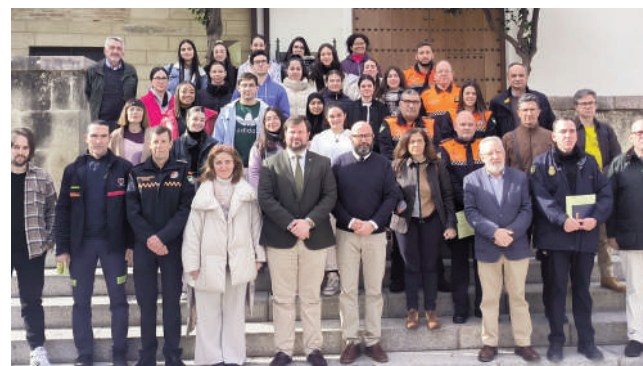
Foto de familia tras la entrega de los diplomas.