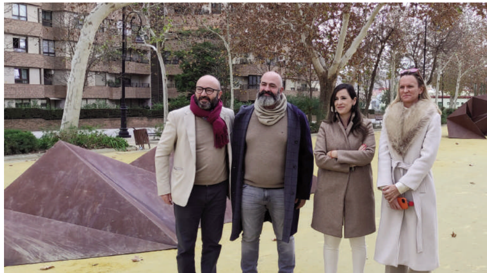
Exposición en el Paseo Real. VIVA

Por su parte, el creador de la obra, Matías Di Carlo, ha mostrado su agradecimiento por poder mostrar su trabajo en dicho entorno. “Lo más difícil al trabajar con la tridimensionalidad es buscar un entorno como es este paseo. El entorno, el color, la línea, la idea de una línea continua es algo difícil de encontrar. Así que muchísimas gracias, es un gusto poder ahora estar un poquito implicado en la historia Antequera”, dijo el artista. La exposición ha viajado por toda España y diferentes partes del mundo, siendo Antequera la penúltima parada antes de volver a su taller, y se podrá visitar de forma totalmente gratuita hasta finales de mayo.