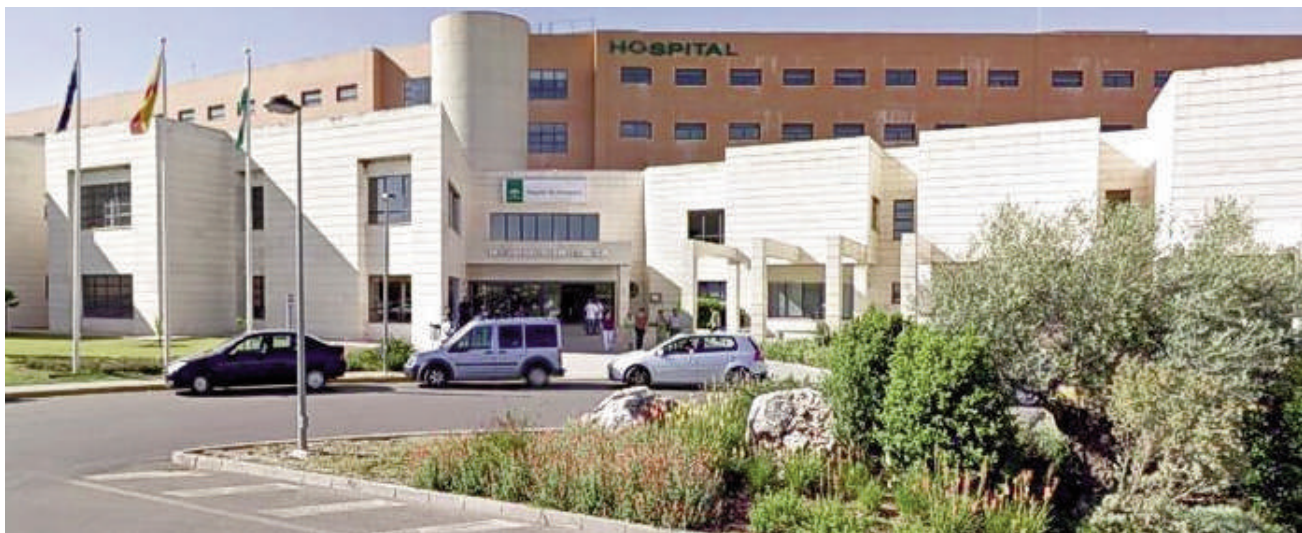
Hospital de Antequera. VIVA

«Este sindicato reitera su condena a las acciones violentas de los usuarios con los trabajadores del SAS y vuelve a exigir a la administración las medidas necesarias para erradicar este problema que se está enquistando en la sanidad andaluza», han reivindicado.