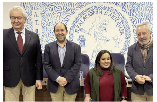
Inauguración del curso. VIVA

grama mucho más pedagógico, intentando que la educación salga a la calle y se palpe a través de las emociones