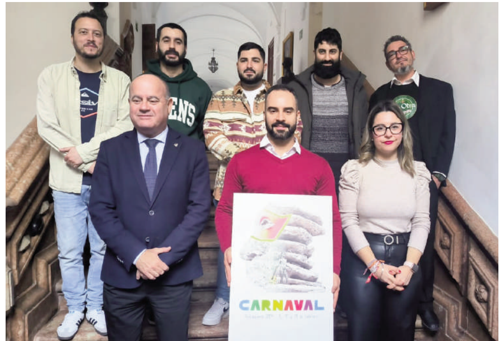
Paso del heraldo real por Antequera. VIVA

ANTEQUERA El concurso de disfraces necesitará previa inscripción