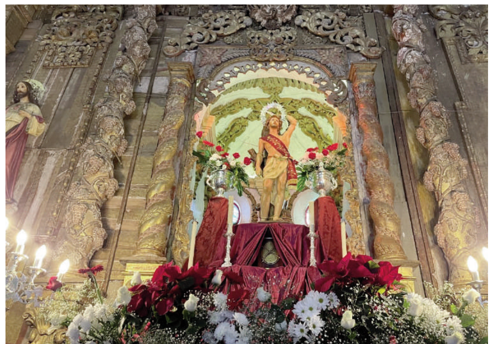
San Sebastián. VIVA

Tras sobrevivir a un primer martirio en el que fue aseteado, volvió a interpelar al emperador, quien decretó su apaleamiento. Tras ser arrojado a una cloaca, se apareció en sueños a Santa Lucina para señalar dónde se hallaba su cuerpo. Es uno de los más importantes protectores contra la peste en la Edad Media. Su martirio se convirtió en excelente excusa para el estudio de la anatomía masculina durante el siglo XV.