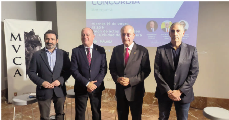
I Foro de Libertad y Concordia. VIVA