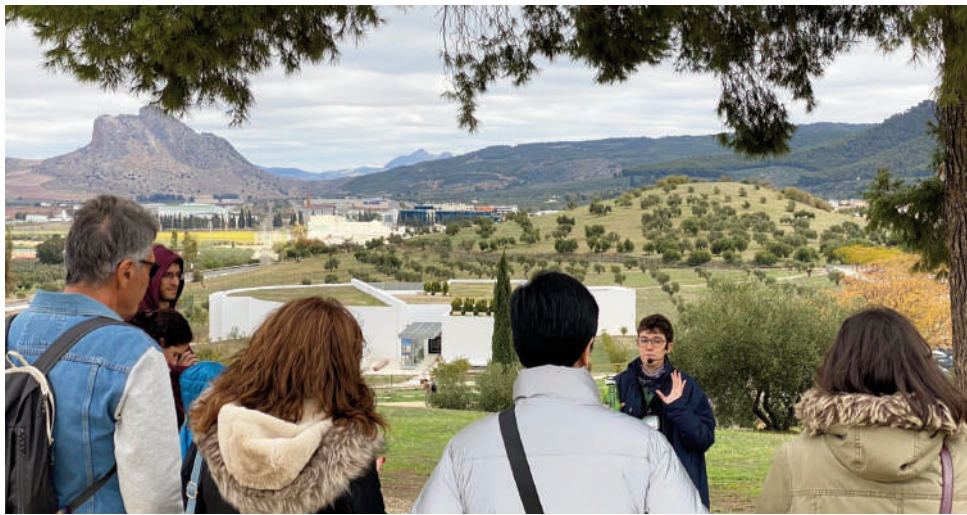
Visita guiada en los Dólmenes. VIVA

Hay que recordar que tras su declaración como Patrimonio Mundial en 2016, los Dólmenes superaron por primera vez el umbral de los 200.000 en 2017, y así hasta tres años consecutivos. Un dato muy positivo en el que también ha tenido mucho que ver la celebración del Festival 'MengaStones' des-