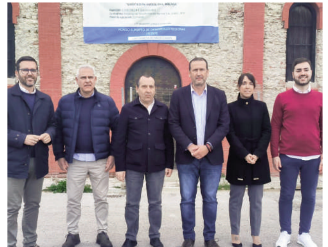
PSOE en la puerta del antiguo depósito.