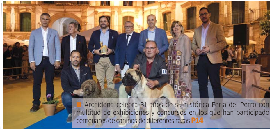
Archidona celebra 31 años de su histórica Feria del Perro con multitud de exhibiciones y concursos en los que han participado centenares de caninos de diferentes razas P14

Cerca de 500 opositores para un puesto en el Ayuntamiento