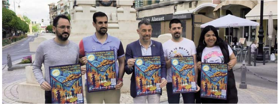
Presentación de la carrera VIVA