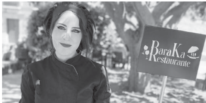
Ganadora de la ruta . VIVA

Una marcha más, un toque extra de potencia para deleitar los sentidos de cada per-