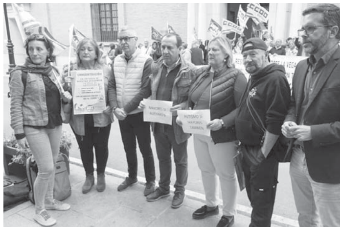
Protesta en la puerta del Ayuntamiento. VIVA

La Diputación de Málaga ha venido anunciando desde hace meses la construcción de un nuevo centro de autismo en el complejo de La Vega y