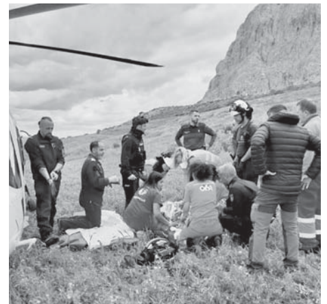
Momento del rescate.

La herida y su acompañante se refugiaron en un