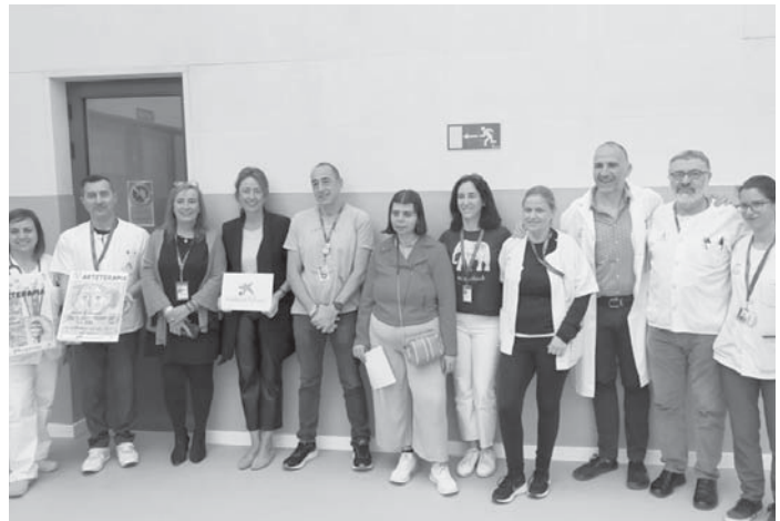
Presentación del proyecto. VIVA

miento mental tradicional. Se toma el enfoque de lo que es ver más allá de lo que supone ir a un hospital y recibir tratamiento. Nos da la oportunidad de observar la vida de otro modo, de ver la capacidad que tiene cada individuo por separado y que no solamente está la enfermedad. Este programa ayuda a que cada paciente pueda ver con otros ojos de lo que es capaz”, señaló una paciente del proyecto. Este programa completa el trabajo diario de los terapeutas ocupacionales, que se marcan objetivos tan importantes como son incrementar los sentimientos de logro, satisfacción y motivación, y también permite salir del ámbito hospitalario y conseguir participación.