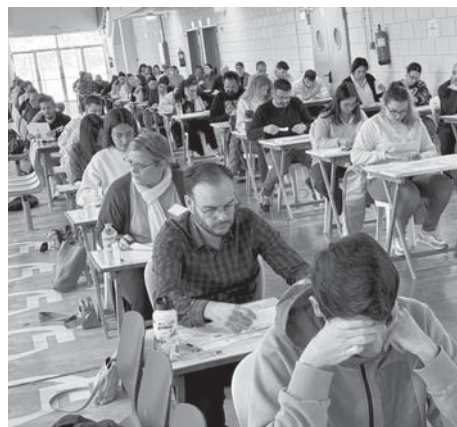
Opositores a las plazas de administrativo VIVA

Además, cabe reseñar el desarrollo de un dispositivo especial de tráfico coordo-