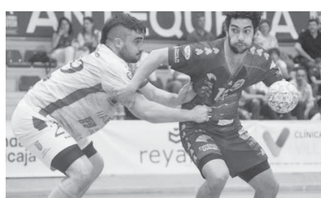
Momento del partido. VIVA

El próximo y último desafío de la temporada será el 18 de mayo en la pista del Balonmano Agustinos Alicante a las siete de la tarde.