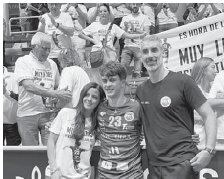
Despedida en el Argüelles.