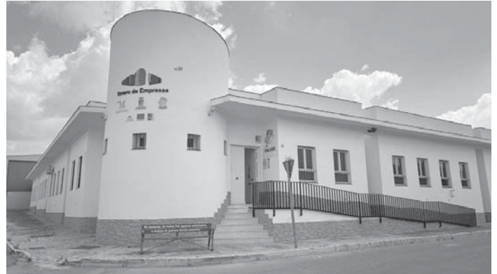
Sede del Grupo de Acción y Desarrollo Local Comarca de Antequera. VIVA

El 7 de mayo será el turno de la Casa de la Juventud y Cultura de Mollina, que acogerá a los distintos actores implicados en el sector de la agricultura y la ganadería, a partir de las siete de la tarde. Para incentivar la participación ciudadana en este procedimiento para el diseño de la próxima Estrategia Leader del territorio, la página web del GADL-CANT ( https://www.antequeracom.com/proceso-participativo-cuestionarios/ ) ha habilitado un serie de cuestionarios para que cualquier persona que lo desee pueda dar su opinión al respecto de varias temáticas: las instituciones, el tejido social y el empresarial, el sector primario, el turismo y patrimonio, así como una