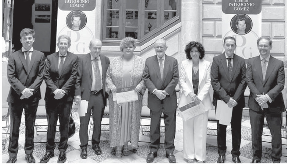
Ganadores de este año. VIVA

Desde la organización del premio se continúa animando a todos los usuarios del sistema sanitario de Antequera a seguir participando en esta iniciativa, dado el gran éxito de las convocatorias hasta el momento.