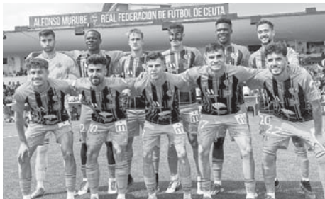
Once inicial del Antequera CF. VIVA

“Desde primera hora ha sido un partido muy roto y alocado y nos ha podido el estrés. No hemos podido controlar muchas cosas, hemos intentado remontarlo, seguir dentro del partido, pero no hemos podido. Nos llevamos una derrota dura, de la que aprenderemos y nos hará más fuerte”, dijo el mister en rueda de prensa.