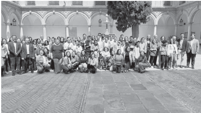
Participantes en la jornada de sensibilización de barreras arquitectónicas. VIVA

El viernes 26 de abril a las diez de la mañana en la plaza de Castilla se realizó la tradicional jornada de sensi-