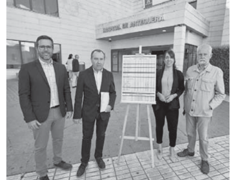
Rueda de prensa. VIVA

En relación a todos los hospitales de Andalucía y de la provincia de Málaga, el de Antequera se sitúa en el octavo lugar para una cita con especialistas y de los 50 hospitales de toda la región por el incremento de estas listas de espera en el año pasado, un 20 % de incremento con más de 3.000 personas que esperan una media de más