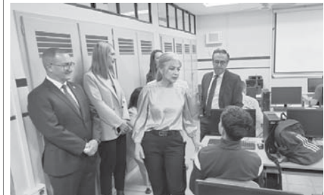
Visita de Patricia del Pozo al Pedro Espinosa. VIVA

Más tarde, la consejera participó en el IV Congreso de Escuelas Infantiles Unidas, organizado por la Asociación de Escuelas Infantiles Unidas en el Hotel Antequera Hills. Durante su desarrollo, del Pozo destacó el "éxito" del modelo andaluz de escuelas infantiles.