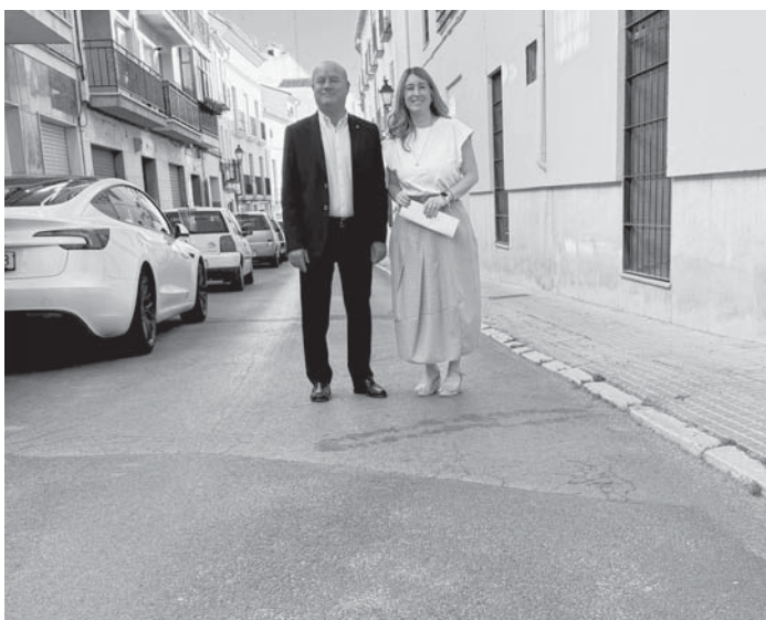
Barón y Molina en la calle Aguardenteros. VIVA

La presentación de dichos proyectos se ha realizado en calle Aguardenteros, uno de los ejemplos de la apuesta del equipo de Gobierno por la accesibilidad y el desarrollo urbano. Esta calle pasará a disponer de plataforma única para garantizar la movilidad, se instalará mobiliario urbano y contará con una total renovación de sus saneamientos, dotando al espacio de puntos de recogidas de agua a través del eje principal de la calle. El proyecto se llevará a cabo en dos fases, con una duración de siete a ocho meses en el caso de la primera, que comprenderá el tramo existente entre la intersección con calle Infante Don Fernando y la calle Sierpes.