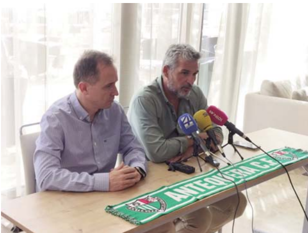
Presentación de la campaña VIVA

ANTEQUERA | Bajo el lema ‘Legado Blanquiverde’, el Antequera CF ha lanzado su nueva campaña de abonados para la segunda temporada en Primera RFEF. Con este eslogan, el club pretende rendir homenaje a todas las generaciones que han disfrutado y siguen disfrutando de la historia y trayectoria del club. El objetivo del equipo es superar los cerca de 1.800 abonados que en la pasada campaña les acompañaron en las gradas de El Maulí.