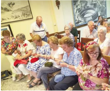
Mayores en el taller de crochet. VIVA

"Para nosotros era fundamental iniciar este proyecto elaborando un diagnóstico social de municipio, incluyendo las once pedanías. Seguiremos trabajando en esa