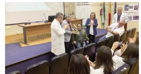
Cuarta ponencia. VIVA

exploró el vínculo antropológico de la obesidad con las primeras especies de homínidos y el papel de los factores anorexigénicos digestivos y cerebrales en la evolución de esta enfermedad. Además, se abordó el cambio de paradigma que supone la aparición de nuevos fármacos antiobesidad que tienen como objetivo las sustancias anorexigénicas presentes en el tracto digestivo.