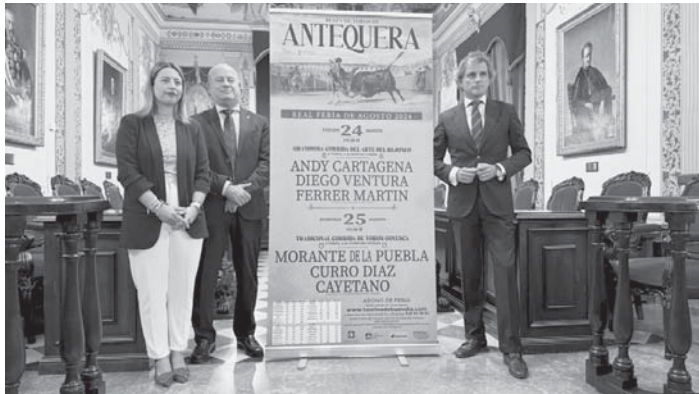
Presentación del cartel. VIVA

Las taquillas de la Plaza de Toros estarán abiertas al público desde el lunes 12 de agosto de diez a dos y de seis a nueve y media. Los días de festejo habrá horario ininterrumpido desde las diez. Habrá un abono para los dos espectáculos con un 5 por ciento de descuento. Los precios de las localidades oscilan entre los 95 y los 12 euros, tratando así de ofrecer precios populares. Se pone además a disposición de los aficionados e interesados el teléfono 626 50 38 82, así como la posibilidad de comprar online a través de la web.