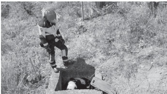
Bomberos rescatando el cuerpo VIVA

ANTEQUERA | Accidente mortal en Antequera el pasado domingo 23 de junio. Un motorista murió tras sufrir un accidente de tráfico en la A-92, kilómetro 146, sentido Sevilla. Una dotación del Consorcio Provincial de Bomberos de Málaga intervino para rescatar el cuerpo sin vida del hombre de 70 años y nacionalidad belga, que cayó dentro de una arqueta.