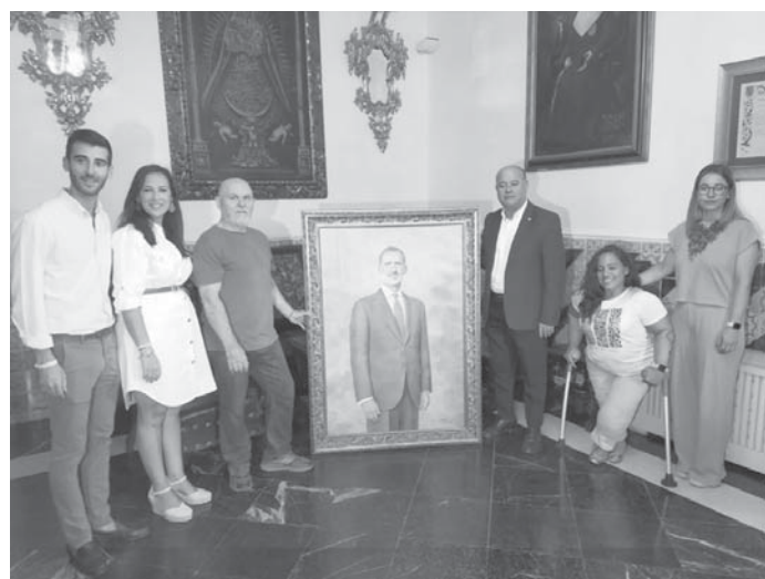
Imagen del Rey. VIVA

"Desde Antequera, ciudad también clave históricamente, enviamos una afectuosa y sincera felicitación a Su Majestad el Rey Felipe VI por el cumplimiento de estos diez primeros años de reinado, deseándole lo mejor también de cara al presente y al futuro de una monarquía garantizada ya a través de Su Alteza Real la Princesa de Asturias, Doña Leonor de Borbón y Ortiz como heredera legítima al trono. ¡Viva España! ¡Viva el Rey!", finaliza el bando público.