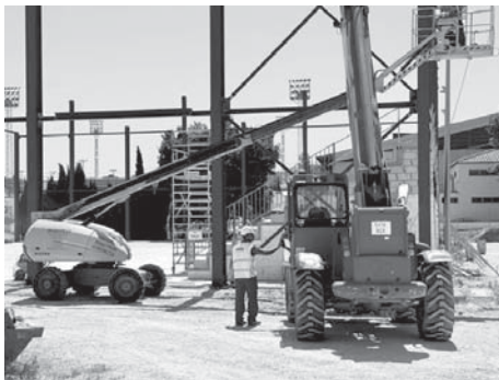
Trabajos a pleno rendimiento. VIVA

“Una vez que finalice la instalación de los pilares de la estructura metálica, comenzará el montaje de la cubierta. En los próximos meses la actuación estará totalmente ejecutada y disponible para solucionar todas las necesidades dotacionales de práctica deportiva cubierta para que cuando haya inclu-