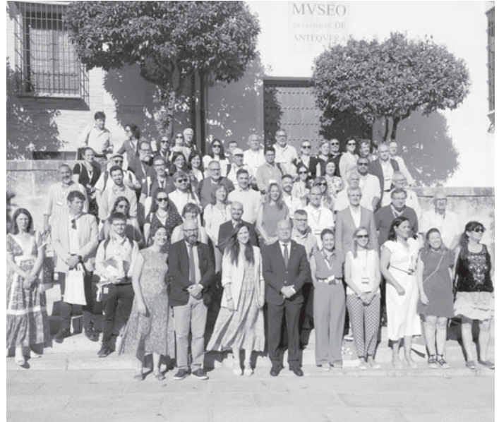
Asistentes al foro.