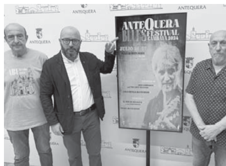
Rueda de prensa VIVA

El sábado 27 será el turno de El Oso de Benalúa y sus