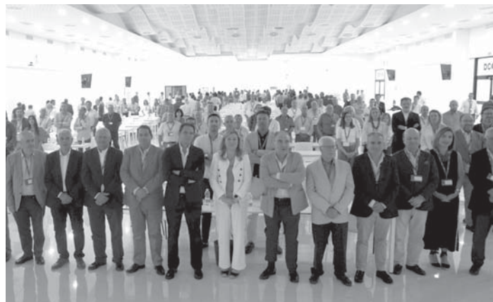
Asamblea general de Dcoop. VIVA

En el ámbito de la sostenibilidad, Grupo Dcoop ha avanzado significativamente al veri-