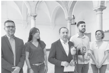
Rueda de prensa PSOE VIVA

El portavoz socialista ha destacado la paralización de las obras del Teatro Torcal y el depósito de Veracruz, así como los retrasos en otras actuaciones como la aveni-