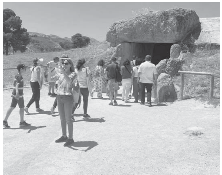
Visitantes en los Dólmenes. VIVA

Hasta el 20 de septiembre, el nuevo horario de verano de los Dólmenes de Antequera será el siguiente: de martes a sábado de nueve a tres y de ocho a diez; los domingos, festivos y lunes víspera de festivo de nueve a tres. Por norma general, los lunes permanecerán cerrados. Todo ello para aprovechar las horas de menor calor.