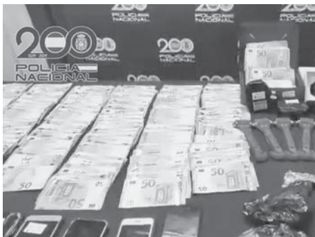
Botín intervenido VIVA

En total, 15 personas han sido detenidas por su presunta implicación en delitos de robo con violencia, usurpación de funciones públicas, blanqueo de capitales y pertenencia a organización criminal. Los asaltos reportados han sumado un botín de 290.000 euros. El primer robo, que desencadenó la investigación, ocurrió en el polígono Guadalhorce de