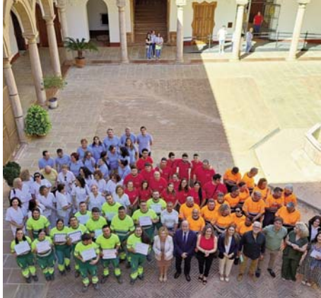
Inauguración de los cursos VIVA

Los programas están diseñados para satisfacer las necesidades formativas y profesionales del mercado laboral local, asegurando así