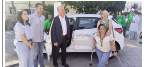
Presentación del vehículo. VIVA

Este servicio de transporte gratuito estará disponible para toda persona de la comarca que "se encuentre sola y no tenga quien la lleve al hospital", explicó durante la presentación.