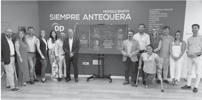
Rueda de prensa VIVA