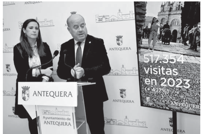
Presentación de la campaña. VIVA

En cuanto a la ocupación hotelera, en el año 2023 se han contabilizado un total de 271.044 pernотaciones y una ocupación global que alcanza el 50,83 por ciento, con una evolución muy positiva conforme transcurrieron los meses del año y un diciembre, por ejemplo, en el que se ha mejorado en más de 6 puntos porcentuales las cifras de 2022.