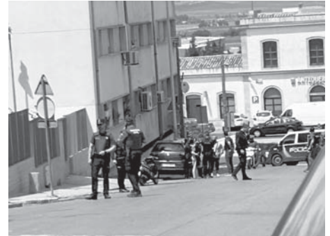
Dispositivo policial en la calle del tiroteo VIVA

El Juzgado de Primera Instancia e Instrucción número 2