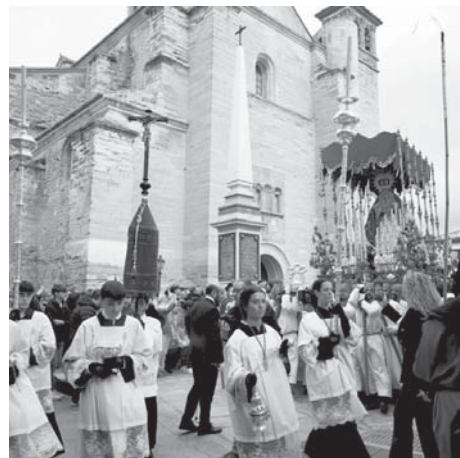
Salidad procesional de la Virgen del Consuelo VIVA

Sin embargo, esta vez el agua por fin dio algo de tregua por la tarde, lo que permitió a la Cofradía del Consuelo y la Cofradía de los Dolores poder celebrar sus tan esperadas estaciones de penitencia por las calles, donde compartieron su pasión con los cientos y miles de fieles que abarrotaron el entorno de la iglesia de San Pedro y Belén y en honor a todas las cofradías que no han podido sa-