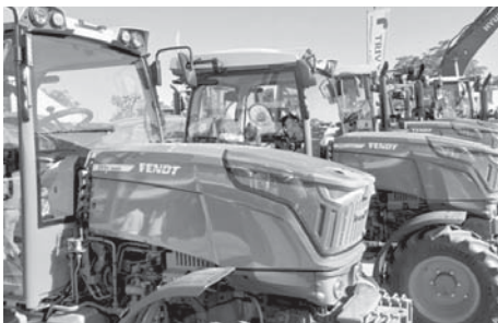
Exposición de tractores VIVA

La Feria Agrícola y Ganadera de Antequera, Agrogant, tuvo como protagonista un año más a la cabra malagueña, destacando actividades como el Concurso Nacional de la Raza Caprina Malagueña, su exposición y su granja escuela. Entre los expositores, participaron este año entidades como la Asociación Española de Criadores de la Cabra Malagueña - Cabrandalucía, Ordefrío, Delavao, Alicoop y Material Ganadero SPC. Durante el fin de semana, vecinos y vi-