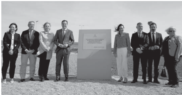
Inauguración de la primera fase con las distintas autoridades. VIVA

La primera fase de urbanización del Puerto Seco de Antequera, que abarca 102 hectáreas de terreno de las más de 300 que tendrá en total, ha supuesto una inversión público-privada, de la mano del Puerto Seco de Antequera y de la Agencia Pública de Puertos de Andalucía, que finalmente ha superado los 50 millones de euros, a los que se le suman los 4,6 millones de la subestación eléctrica. Se estima que permitirá crear cerca de 2.500 empleos direc-