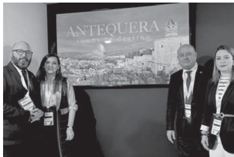
Presentación en FITUR. VIVA

«En estos 10 últimos años, hemos ofertado las potencia-