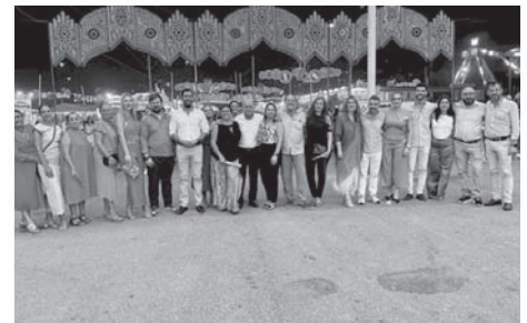
En el Real de la Feria. VIVA

En cuanto a la Feria de Día, resaltó su popularidad, especialmente en el Paseo Real, que congregó entre 12.000 y 15.000 personas durante la actuación de 'King África'. Además, mencionó los planes futuros de ampliar las instalaciones con el desarrollo urbanístico de los antiguos jardines del Corazón de María, donde se prevé construir un auditorio destinado a actividades juveniles. El objetivo es integrar este nuevo es-