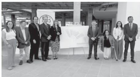
Presentación del proyecto. VIVA

Se trata de una ayuda de 1,2 millones de euros procedente de fondos europeos ‘Next Generation’. Justo hoy la Junta de Andalucía, a través de la Consejería de Inclusión Social, Juventud, Familias e Igualdad, ha publicado la resolución definitiva de la con-