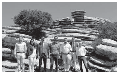
Visita al Torcal. VIVA

“El Torcal es un paraje natural único, declarado Patrimonio Mundial de la Humanidad por la Unesco, que supone un enorme reclamo para este municipio, pero también para toda la comarca y la provincia de Málaga”, señaló el consejero en su visita.