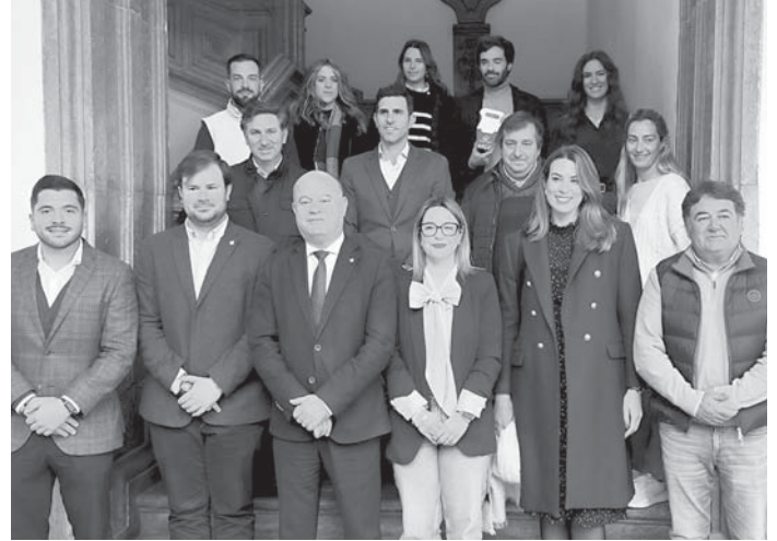
Presentación de la cabalgata con los colaboradores VIVA

El Heraldo Real les echará una mano por la mañana recogiendo las cartas de pequeños y mayores en su clásico coche descapotable que partirá desde la Plaza del Coso Viejo, pasando por Tintes, Medidores, Lucena, San Agustín e Infante Don Fernando hasta llegar al consistorio. Para tal fin, el Ayuntamiento ha editado unas 3.000 cartas que se han repartido entre los colegios de la ciudad y anejos. También se pueden conseguir en las exposiciones de Santa María y del Ayuntamiento. "Estamos ante uno de los eventos más bonitos y