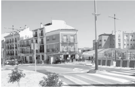
Nueva apariencia de la avenida VIVA

Salado resaltó que esta actuación, cuyo proyecto realizó el Ayuntamiento antequerano, permite que esta avenida se convierta en «mucho más sostenible y amable para los ciudadanos». En este sentido, el pavimento peatonal