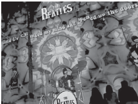
Videomapping colegiata.

Uno de los momentos más impresionantes fue el videomapping proyectado en la fachada de Santa María, que ofreció un viaje nostálgico por la música de todos los tiempos, destacando artistas como Frank Sinatra, The Beatles, ABBA, Queen y Beyoncé. Además, el Mirador de las Almenillas deslumbró con un espectáculo lumínico