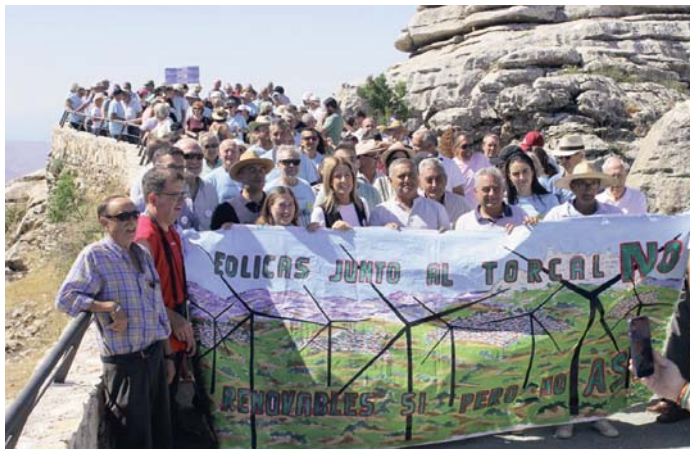
Concentración en el Torcal de Antequera.

Durante la concentración, los vecinos alertaron, además, del grave impacto medioambiental generado por las cimentaciones, desmontes y excavaciones, lo que tendría consecuencias nefastas para las especies del lugar. "Las aves, los murciélagos y otras especies voladoras sufrirán colisiones".