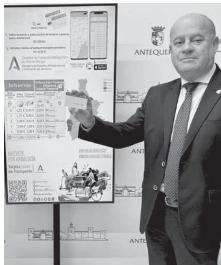
Barón con la tarjeta. VIVA

Por otra parte, el Consorcio está trabajando para incorporar un cajero automático en la propia estación de autobuses, así como está finalizando el concurso que tienen abierto para la instalación de paneles informativos y marquesinas.