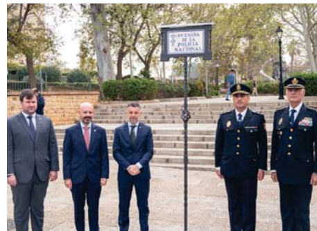
Rafael Cañas VIVA

El renombramiento, que fue aprobado en pleno por el Ayuntamiento en 2018, tuvo lugar el miércoles 20 de marzo durante la celebración de un acto institucional y conmemorativo que consistió en desvelar la placa con la nueva denominación de la calle, un monolito en la rotonda y una ofrenda de corona de laurel por los agentes caídos en acto de servicio ante una