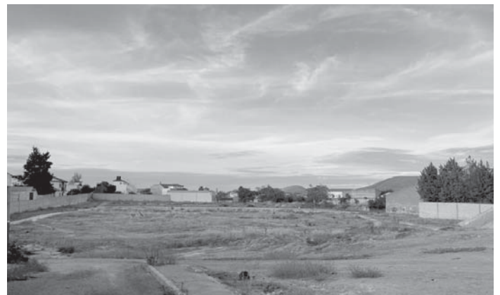
Terrenos adquiridos por el Ayuntamiento de Fuente de Piedra.