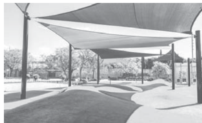
Zona del jardín.

Salado explicó que este centro, que aspira a convertirse en un referente en la atención a las personas con trastorno del espectro autista (TEA) en España, desarrollará iniciativas y programas para “mejorar la calidad de vida de las personas con TEA