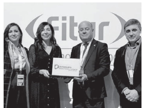
Recogida del reconocimiento.

Se trata de un nuevo reconocimiento recibido por el Ayuntamiento de Antequera que catalogó a la ciudad como un destino turístico innovador, consolidado sobre una infraestructura tecnológica de vanguardia, que garantizó el desarrollo sostenible del territorio turístico, accesible para todos, facilitando