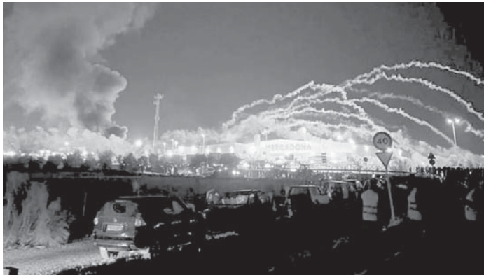
Momento de desalojo. VIVA

Pasada la medianoche, el Parque Empresarial de Antequera fue recobrando la normalidad, con la salida de camiones y los trabajadores de la cadena de alimentación. Lo que comenzó siendo una