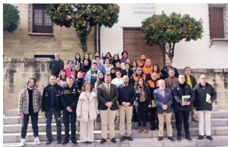
Entrega de diplomas VIVA

Una de las novedades más destacadas fue la simulación de riesgos estructurales en la torre de la biblioteca y el arco