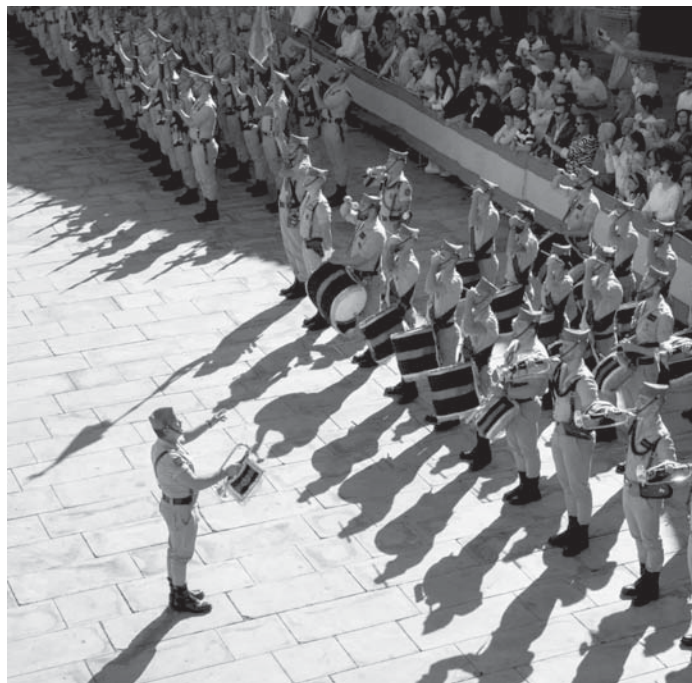
Legionarios en la jura de bandera con la Legión. VIVA