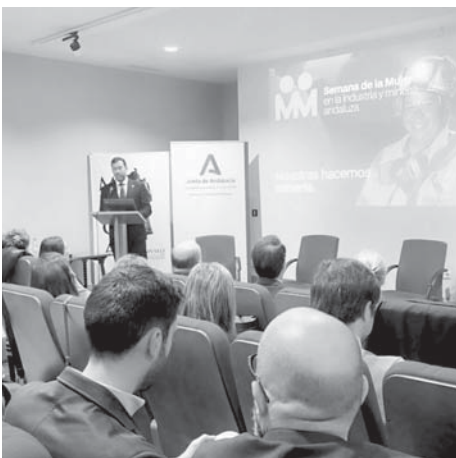
Imagen de la jornada.