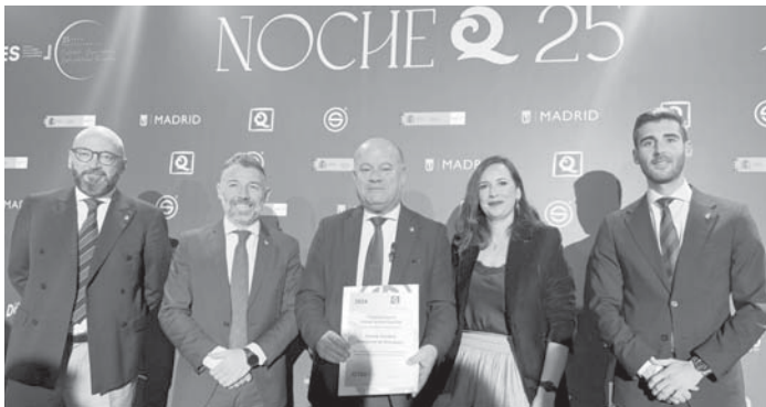
Recogiendo el certificado en Madrid.

ANTEQUERA | Antequera sigue posicionándose como referente en materia de turismo inteligente tras recibir el certificado Q de Calidad Turística.