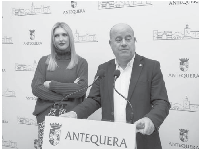
Barón en rueda de prensa. VIVA

“Dudo mucho que tengan viabilidad económica. Desde luego yo lo que no quiero es que le quiten a Antequera ni un solo euro para sufragar estos inventos”, ha concluido.