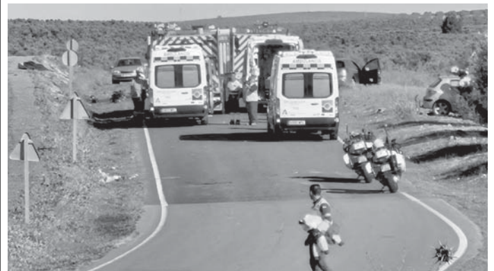
Efectivos en el lugar de los hechos VIVA

Civil y del Consorcio Provincial de Bomberos, varias ambulancias, así como un helicóptero medicalizado. Tal y como informó el servicio de Emergencias 112 a este medio, se desconocen las causas del accidente, así como el estado de los dos heridos.