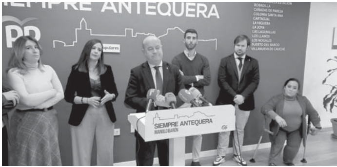
Rueda prensa PP VIVA