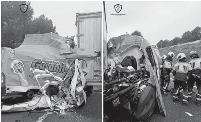
Imágenes del siniestro VIVA

ANTEQUERA | Efectivos del Consorcio Provincial de Bomberos de Antequera y Colmenar intervinieron el pasado lunes en un aparatoso accidente de tráfico ocasionado por una fuerte colisión entre una furgoneta y un camión