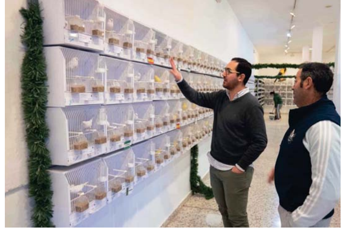
Concurso de Canaricultura de Archidona. VIVA

El viernes 17 a las siete se premió a los ganadores del tradicional concurso de dibujo infantil en la sala de exposiciones del ayuntamiento, una actividad que fomenta la educación y la participación de escolares en el concurso un año más.