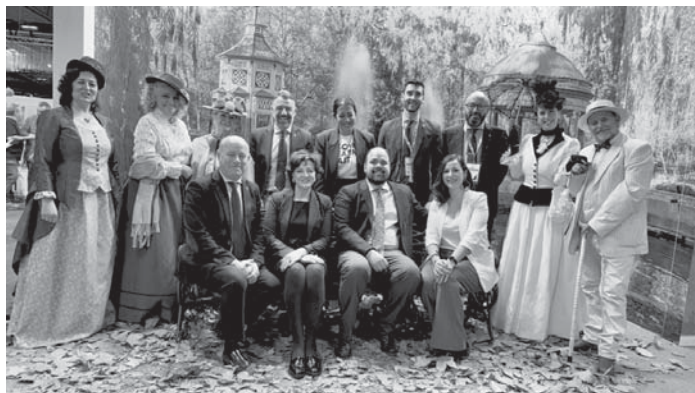
Momentos de Fitur. VIVA

ANTEQUERA Fue recogido en el Palacio de Cibeles de Madrid, sede del Ayuntamiento de la capital