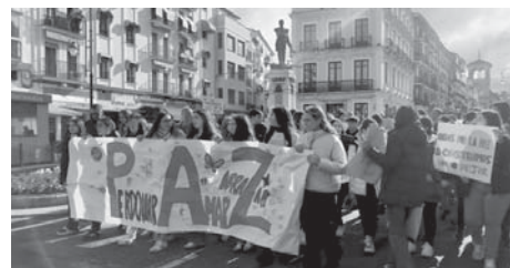
Marcha reivindicativa VIVA

A las once de la mañana, los participantes se congregaron en el Patio del Ayuntamiento de Antequera, donde dio inicio la manifestación. La marcha recorrió las principales calles del municipio, pasando por la calle Infante Don Fernando y la Alameda, hasta llegar al Paseo Real.