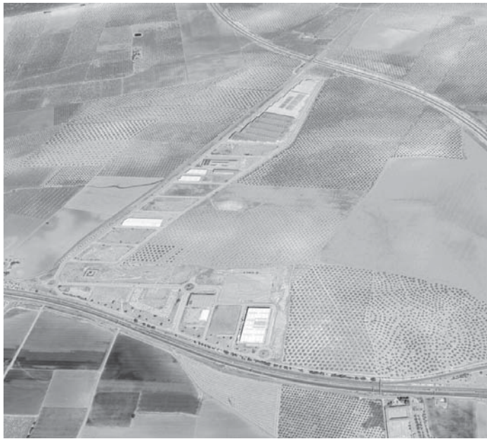
Terreno donde se instalará la planta logística. VIVA

En 2024 se han abierto 15 nuevos supermercados: 6 supermercados en Comunitat Valenciana, 4 en Cataluña, 2 en Andalucía, 2 en la Región de Murcia y 1 en Castilla-La Mancha. Las tiendas que han abierto sus puertas en Andalucía en los últimos meses son Huércal de Almería (Almería) y Vegas del Genil (Granada). Para este año 2025, Consum tiene previsto abrir otros dos supermercados en Andalucía en su conjunto.