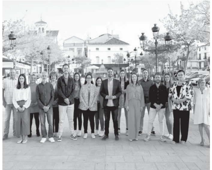
Equipo de gobierno de Fuente de Piedra. VIVA

Por otro lado, se han incorporado medidas para apoyar el desarrollo y fomentar la participación de la juventud, como las ayudas para el carnet de conducir o el Consejo Local de Juventud. También incluyen partidas económicas para diversos niveles y necesidades educativas.