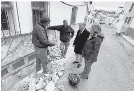
Visita a las obras. VIVA

Este anuncio coincide con un contexto de récord para Antequera, que registra actualmente los mejores datos de empleo de los últimos 17 años, con 2.788 desempleados. Solo para ejecutar estos proyectos, se formalizarán un total de 598 contratos laborales. Entre las actuaciones previstas destacan las primeras fases de remodelación integral de las calles Pasillas, Aguadenteros,