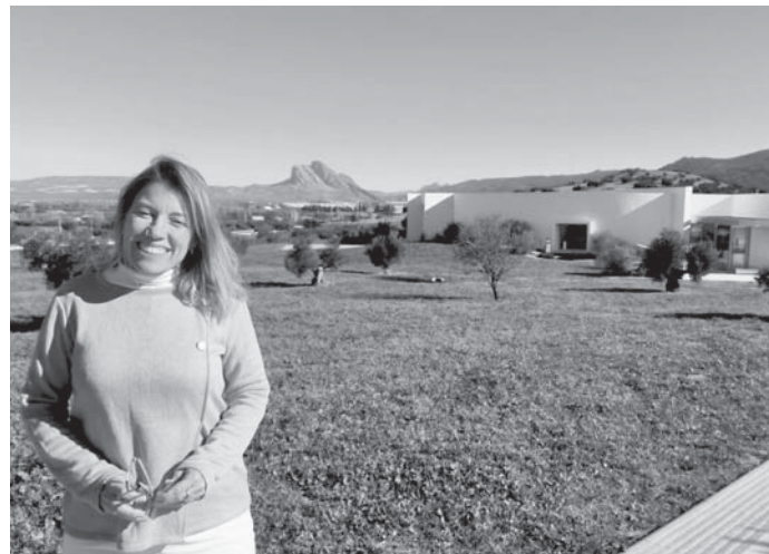
Imagen del recinto con la entrevistada en primer plano. VIVA

Particularmente tengo el corazón dividido. En cualquier sitio de Europa cobran entrada, de hecho cuando vienen los turistas, sobre todo franceses e ingleses, y ven que el acceso es gratuito, se asombran. Si las cosas se hacen bien, no habría ningún problema. Se puede poner cobro de entrada, al igual que dar facilidades a las personas que vivan en Antequera, así como a colectivos desfavorecidos, niños, jóvenes y mayo-