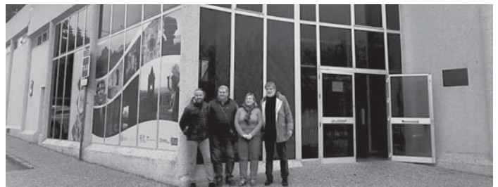
IU en la estación VIVA

servicios”. Por ello, desde IU consideran que se “debería valorar muchas de las cuestiones de los vecinos” ya que son “los que realmente conocen el tema”. “A esta estación se le puede sacar muchísimo partido tal y como está ahora mismo, por eso se debería valorar y preguntar a los usuarios del día a día qué consideran más factible”. Izquierda Unida ha vuelto a pedir la reforma integral de la estación de autobuses de Antequera, evitando así su traslado junto a la nueva estación de la AVE, tal y como está previsto.