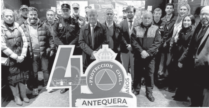
Inauguración exposición VIVA

También se ha presentado el logotipo oficial que recordará esta efeméride durante todo el año 2025, un símbolo que acompañará las múltiples actividades previstas para conmemorar este aniversario. Entre ellas destacan la reedición de una exhibición de diferentes cuerpos de emergencias en el marco del Día de las