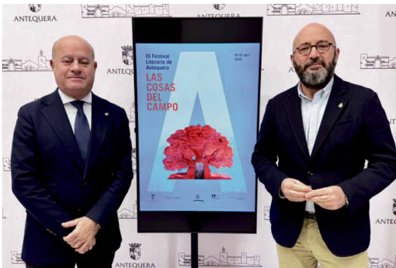
Presentación 'Las cosas del campo'. VIVA

El festival concluirá el 26 de abril con la representación de 'La Ratona', de Agatha Christie, en la Casa de la Cultura a las siete de la