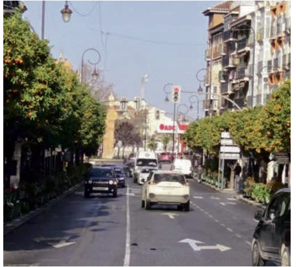
Alameda de Andalucía. VIVA

La reforma de la Alameda de Andalucía, que fue anunciada en 2024, se suma así a las actuaciones desarrolladas en los últimos años en el centro urbano y se perfila como una de las inversiones más significativas del municipio. Así, si todo va según lo previsto, este 2026 se podrá dar inicio a uno de los trabajos más ambiciosos para la ciudad de los Dólmene, proyecto que ha conseguido dar un paso más y que, con este anuncio, se encuentra en fase de licitación, a la espera de conocer cuál será la empresa encargada de las obras.